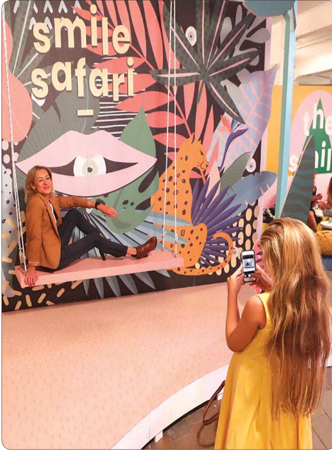
طفلة تلتقط صورة لوالدتها أثناء زيارة لمتحف Smile Safari الذي تم افتتاحه مؤخراً في بروكسل.

ومن طرق علاج سرطان الدم ومحاربهه المعالجة الكيميائية، أو يتم ذلك من خلال دواء مثبث التيروسين كيناز المسؤول عن تفعيل العديد من البروتينات.