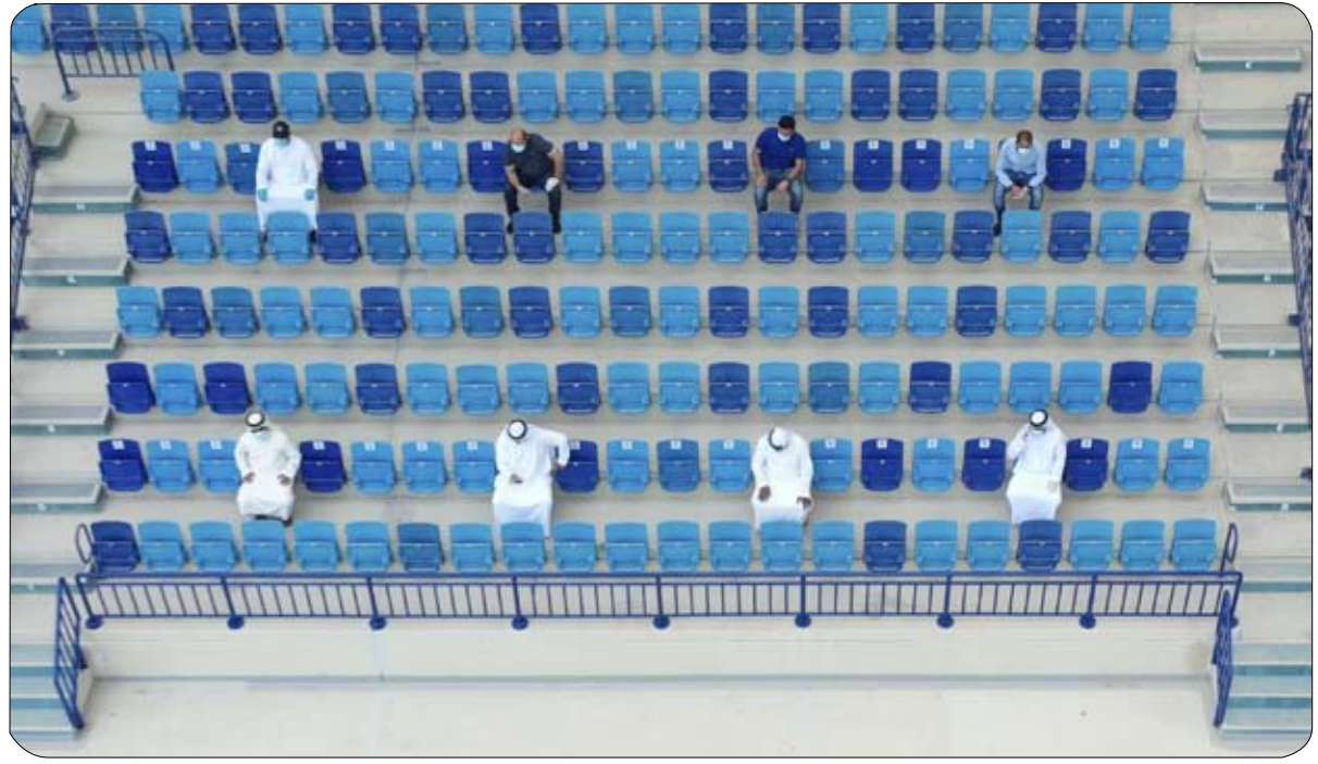
ينظمه مجلس دبي الرياضي بالتعاون مع شرطة دبي