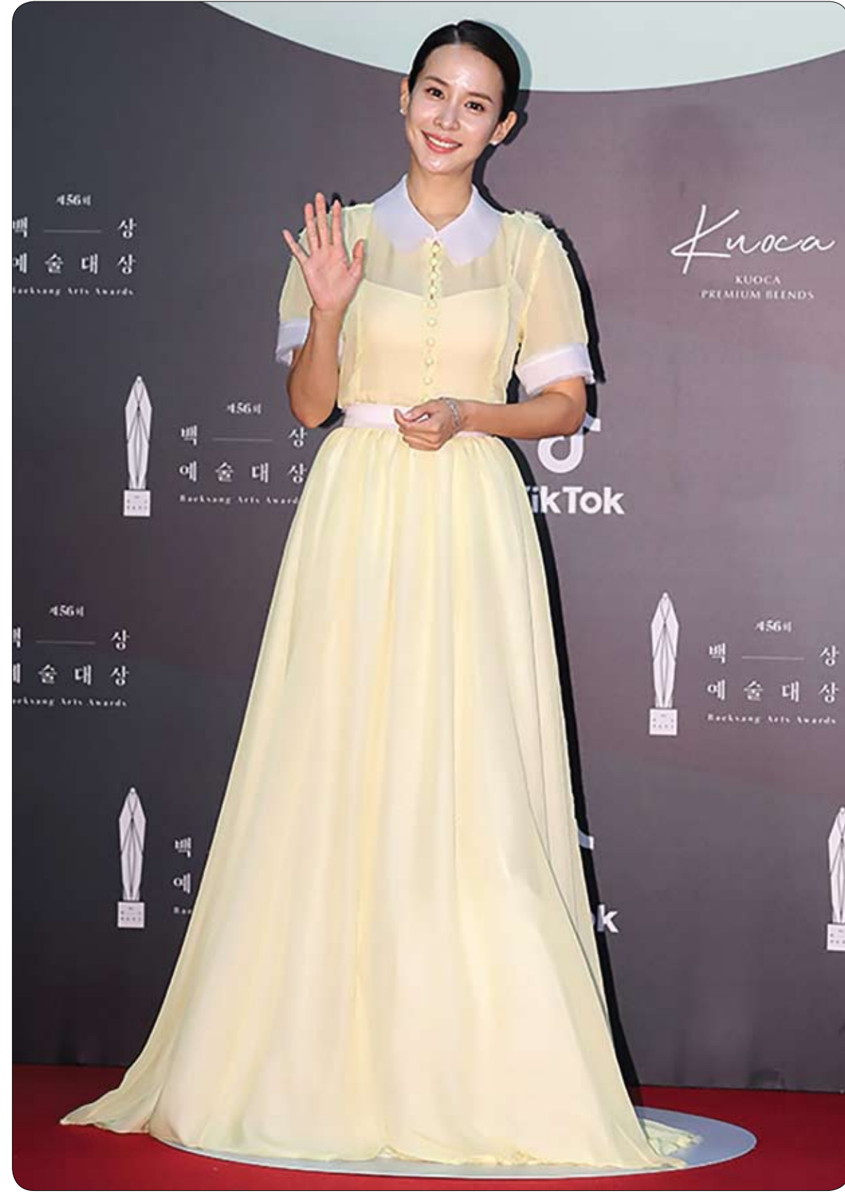
الممثلة الكورية الجنوبية تشو يو جيونغ على السجادة الحمراء خلال حفل توزيع جوائز Baeksang للفنون

يحقق المدعون الأمان في ما إذا كان المشتبه به في قضية فقدان الطفلة البريطانية مادلين ماركان، خلال تمضيها إجازة في البرتغال مع عائلتها قبل 13 عاماً، على صلة أيضاً باختفاء طفلة أخرى في ألمانيا. وبعد مرور عقد من الزمان على لغز اختفاء الطفلة "مادي"، التي كانت تبلغ من العمر 3 سنوات عام 2007، كشفت الشرطة أنها تحقق مع رجل ألماني يبلغ من العمر 43 عاماً بشأن اختفائها من المنتج البرتغالي برايا دا لوز. ووفقاً لموقع "سكاي نيوز" فقد تسلمت الشرطة 400 إبادة بشأن قضية اختفاء الطفلة البريطانية، وذلك هوية المشتبه به يوم الأربعاء الماضي.