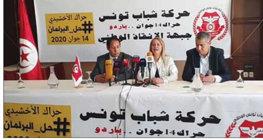
حراك واعتصام جديد

حصل علاج طوره باحثون في دولة الإمارات لعلاج التهابات فيروس كورونا المستجد كوفيد19 - على حماية الملكية الفكرية ما يمهد الطريق أمام مشاركة هذا العلاج على نطاق واسع ليستفيد منه المزيد من المرضى. كان فريق من الأطباء والباحثين في مركز أبوظبي للخلايا الجذعية بقيادة الدكتور يندري فينتورا، المخترع والباحث الرئيسي قد أعلن الشهر الماضي اكتشاف علاج جديد مبتكر. (التفاصيل ص4)