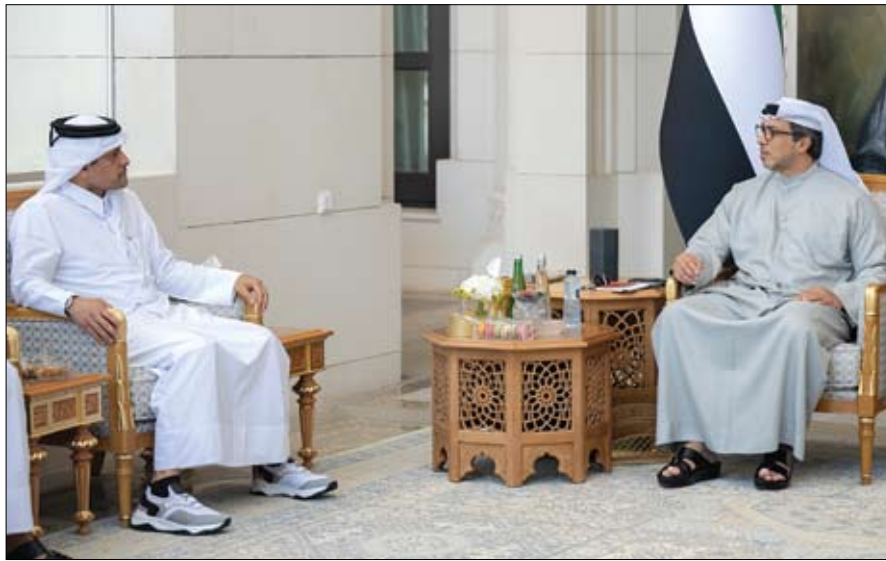
منصور بن زايد خلال استقباله رئيس الديوان الأميري في دولة قطر (وام)

كشف المرشح الجمهوري للرئاسة الأمريكية دونالد ترامب، خطة تعيين المياريدير إيلون ماسك على رأس لجنة معنية بالكفاءة الحكومية، لتحل محل الهدر في الاتفاق، الذي يكلف تريليونات الدولارات. وأفاد ترامب أمام شخصيات من دوائر المال والأعمال في نيويورك، بأن ماسك الذي اقترح الفكرة، سيشرف على مراجعة كاملة للحسابات المالية والأداء للحكومة الفدرالية بكاملها، في إدارته الثانية، حال فوزه في الانتخابات الرئاسية. وقبل نحو شهرين من إجراء الانتخابات الرئاسية الأمريكية، تتوجه أنظار المتابعين للشأن الأمريكي إلى يوم هام، الثلاثاء القادم، حيث تحدث أول مواجهة بين المرشح الجمهوري دونالد ترامب والمرشحة الديمقراطية كامالا هاريس، في مناظرة في فيلادلفيا، وهي واحدة من أكثر اللقاءات المنتظرة في هذه الانتخابات. وستجرى مناظرة بين ترامب وهاريس على قناة (إيه بي سي ABC) في الساعة التاسعة مساء بتوقيت شرق الولايات المتحدة (0100 بتوقيت غرينتش يوم 11 سبتمبر)، في مركز الدستور الوطني في فيلادلفيا انتخابات 2020.