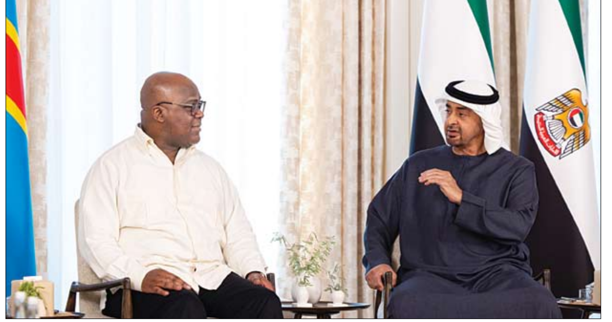
رئيس الدولة خلال استقباله رئيس جمهورية الكونغو الديمقراطية (وام)

بذلت غالي السنين لوطنك دولة الإمارات وإمارتك الغالية عجمان .. تأسيساً وبناءً وقيادة .. ومشاركة مخصصة في الحفاظ على كيان الاتحاد وروح ومبدأه.. رفيقا للمؤسسين .. ومسانداً وعضيداً لمن جاء بعدهم. أخي الشيخ حميد .. نفخر بك علماً خالداً من أعلام دولتنا .. ونفخر بأبنائك الذين يواصلون مسيرتك المباركة .. وندعو الله أن يديم عليك الخير والصحة والتوفيق في مسيرتك المباركة . أخوك الدائم على محبته .. محمد بن راشد .