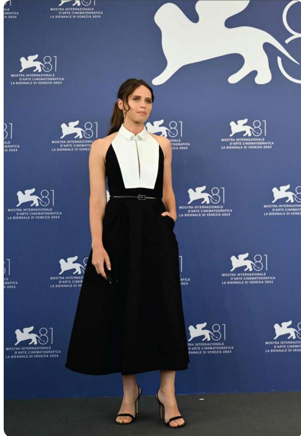
المثلة فيليبيتي جونز لدى حضورها جلسة التصوير الخاصة بفيلم The Brutalist الذي عُرض في مهرجان البندقية السينمائي الدولي في فينيسيا.

الاستشارية في شنغهاي. فمذ الساعة التاسعة من صباح الجمعة، وصلت درجات الحرارة إلى 30 درجة مئوية في الساحة التي تبدو كأنها جبال الألب والتي تستضيف حفلة الافتتاح. ولكن بمجرد دخول المجمع، انخفض الرزقي إلى ما دون درجة التجمد. ووسط حرارة خارجية قاربت 30 درجة عند التاسعة صباحاً، دُشن منتج "ل" «سنو إن دور سكيبينغ ثيم L.SNOW Indoor Skiing Theme عند ساحل لينغان، على مسافة نحو ساعة ونصف ساعة من وسط شنغهاي، وهو على شكل نهر جليدي وتبلغ مساحته حوالي 90 ألف متر مربع.