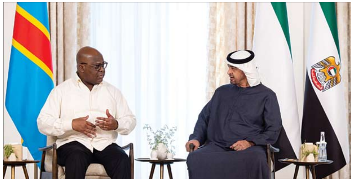
بحث مع رئيس الكونغو الديمقراطية تعزيز العلاقات بين البلدين