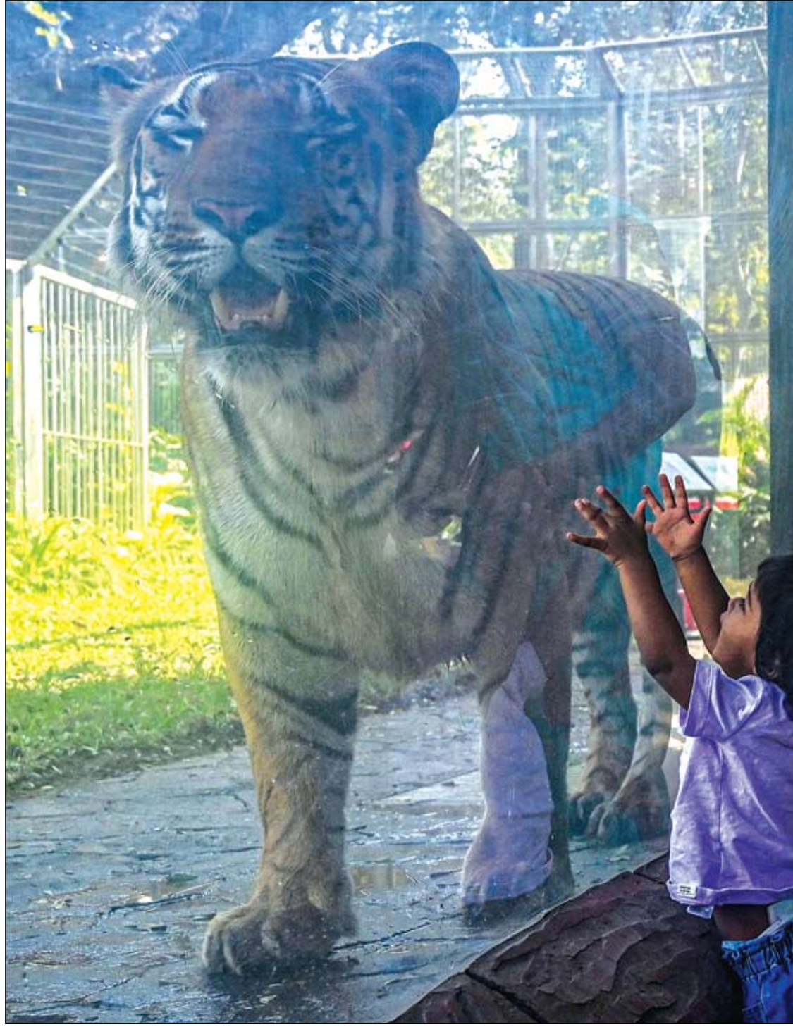
طفل ينظر إلى نمر بنغالي يتجول داخل سياجه في حديقة حيوان مومباي بعد إعادة فتح المرفق للزوار كجزء من تخفيف القيود المفروضة سابقاً للحد من جائحة كورونا.