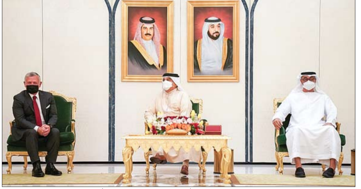
محمد بن زايد وحمد بن عيسى وعبدالله الثاني خلال قمتهم الثلاثية في أبو ظبي

رئيس الدولة ونائبه ومحمد بن زايد يهنئون ملك المغرب بذكرى استقلال بلاده أبو ظبي - وام: بعث صاحب السمو الشيخ خليفة بن زايد آل نهيان رئيس الدولة حفظه الله برقية تهنئة إلى صاحب الجلالة الملك محمد السادس ملك المملكة المغربية الشقيقة وذلك بمناسبة ذكرى استقلال بلاده. كما بعث صاحب السمو الشيخ محمد بن راشد آل مكتوم نائب رئيس الدولة رئيس مجلس الوزراء حاكم دبي رعاه الله وصاحب السمو الشيخ محمد بن زايد آل نهيان ولي عهد أبو ظبي نائب القائد الأعلى للقوات المسلحة برفيقتي تهنئة مماثلتين إلى صاحب الجلالة الملك محمد السادس. أجرت 116.396 فحصاً كشفت عن 1.292 إصابة بالعدوى، تعافى 890 حالة جديدة من كورونا أبو ظبي - وام: تماشياً مع خطة وزارة الصحة ووقاية المجتمع لتوسيع وزيادة نطاق الفحوصات في الدولة بهدف الاكتشاف المبكر وحصر الحالات المصابة بفيروس كورونا المستجد كوفيد - 19 والمخالطين لهم وعزلهم، أعلنت الوزارة عن إجراء 116.396 فحصاً جديداً خلال الساعات الـ 24 الماضية على فئات مختلفة في المجتمع باستخدام أفضل وأحدث تقنيات الفحص الطبي. (التفاصيل ص 2)