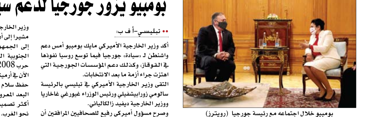
بومبيو خلال اجتماعه مع رئيسة جورجيا

تيليسي - أ ف ب: أكد وزير الخارجية الأمريكي مايك بومبيو أمس دعم واشنطن لـ "سيادة جورجيا فيما توسع روسيا نفوذها في القوقاز، وكذلك دعم المؤسسات الجورجية التي اهتزت جراء أزمة ما بعد الانتخابات. التقى وزير الخارجية الأمريكي في تيليسي بالرئيسة سالومي زورابيشفيلي ورئيس الوزراء غيورغي غاغاريا ووزير الخارجية ديفيد زالكالاني. وصرح مسؤول أمريكي رفيع للصحافيين المرافقين أن