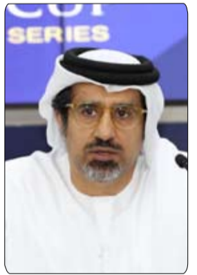
•• دبي - وام:

أكد سعادة فيصل الرحماني رئيس الاتحاد الدولي لسباقات الخيول العربية الأصيلة ، في إقبال، أن مسيرة الخيول العربية الأصيلة تعيش أزهى عصورها حالياً بدعم سمو الشيخ منصور بن زايد آل نهيان نائب رئيس مجلس الوزراء وزير شؤون الرئاسة ، وأن السنوات الثلاث الأخيرة شهدت نقلة نوعية هائلة على كافة المستويات في الاتحاد الدولي، بداية من التنظيم الإداري المؤسسي، ومروراً بزيادة عدد السباقات والأشواط على المستوى العالمي وتأسيس أكبر قاعدة معلومات في تاريخ تلك الرياضة وإعادة الكثير من الاتحادات الوطنية المهمة إلى مظلة الاتحاد الدولي، وانتهاء بفتح الأفق أمام زيادة الاستثمارات والمداخليل لإنعاش خزينة الاتحاد الدولي.