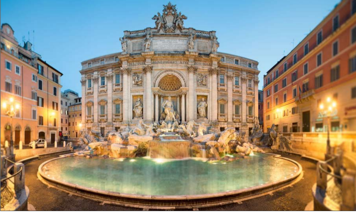
البرلمان الايطالي ساحة حرب سياسية

إيطاليا في أزمة مؤسسية عميقة. بعد رفضه تعيين وزير مالية مناصراً لنهاية اليورو في حكومة تشكك في الاتحاد الأوروبي وشعبوية، سعى الرئيس الإيطالي الى إيجاد حل لجمود استمر عدة أشهر وذلك