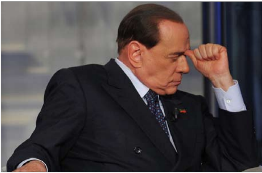
الامبراطور العجوز امام خيارات احلاها مر