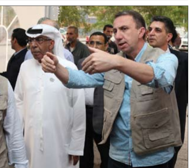
في نهاية شهر رمضان الفضيل. واستقبل دولة طاهر المصري النائب الأول لرئيس مجلس إدارة تكية أم على وسامر بلقر مدير عام التكية - أمس الأول في مقر التكية بمنطقة الحطة وسط العاصمة عمان - سعادة مطر سيف سليمان الشامسي سفير الدولة لدى المملكة الأردنية الهاشمية الذي