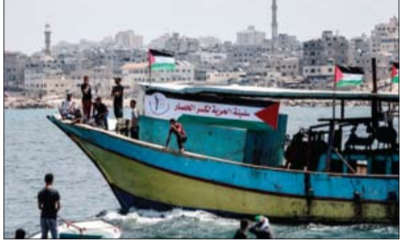
سفينة الحرية الفلسطينية لفك الحصار الاسرائيلي

سيطر عليها على بعد نحو 11 ميل وتم اقتيادها لبناء اسدود ثم فقدان الاتصال بهم قبل نحو نصف ساعة "مسحولا السلطات الإسرائيلية "مسؤولية عن حياة 18 شخصا على متن السفينة.. وهذا هو أول قارب فلسطيني يبحر على متن واحد وعشرون فلسطينياً غالبيتهم من المرضى والمصابين بنيران الجيش الاسرائيلي خلال الاحتجاجات قرب الحدود.