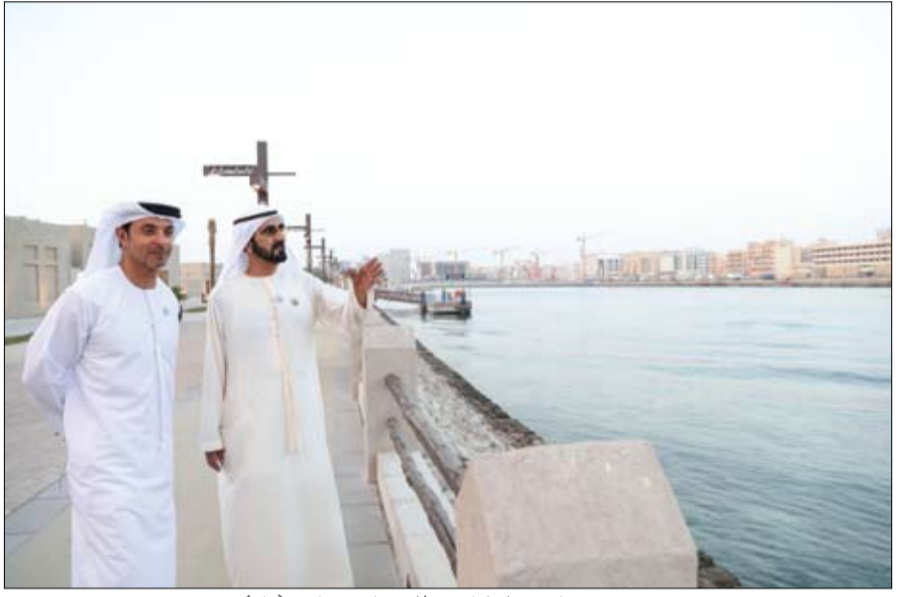
محمد بن راشد خلال استقباله هزاع بن زايد

استقبل صاحب السمو الشيخ محمد بن زايد آل نهيان ولي عهد أبوظبي نائب القائد الأعلى للقوات المسلحة أمس في قصر البطين عدداً من الأيتام الذين تكفلهم هيئة الهلال الأحمر الإماراتي وذلك بحضور سمو الشيخ حمدان بن زايد آل نهيان ممثل الحاكم في منطقة الظفرة رئيس الهيئة. (التفاصيل ص-3 2)