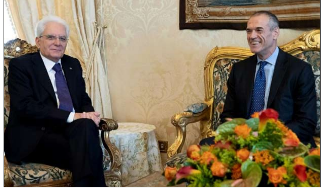
ماتاريلا ورئيس الحكومة المعين اخر الحلول الممكنة

التصويت النسبي قوياً ولم ينجح أي تحالف حزبي في تشكيل أغلبية - وقد تم تشكيل ثلاث كتل: حركة 5 نجوم المناهضة للنظام، والحزب الديمقراطي وهو الوحيد في يسار الوسط، وفورزا إيطاليا الذي حقق نتائج ضعيفة لا تسمح له بمساعدة الرابطة على تجاوز 50 بالمائة.