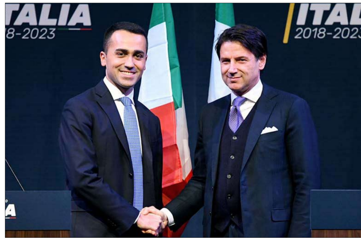
حركة 5 نجوم ترفض وصاية الاوساط المصرفية والمالية