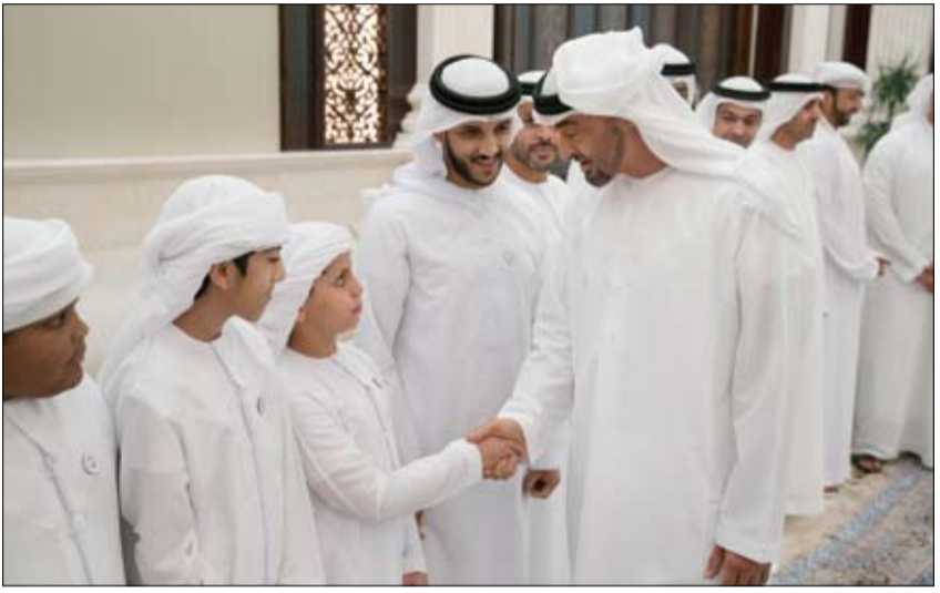
محمد بن زايد خلال استقباله إيام الهلال الأحمر

أعلنت كندا إعفاء مواطني دولة الإمارات من متطلبات تأشيرة الدخول إليها وذلك اعتباراً من تاريخ 5 يونيو 2018. جاء ذلك خلال اللقاء الذي عقده سمو الشيخ عبدالله بن زايد آل نهيان وزير الخارجية والتعاون الدولي مع معالي أحمد حسين وزير الهجرة واللجوء والمواطنة الكندي وذلك في إطار الزيارة الرسمية التي يقوم بها سموه إلى كندا. وأكد سمو الشيخ عبدالله بن زايد آل نهيان على علاقات الصداقة والتعاون المشترك المتميزة التي تجمع بين دولة الإمارات وكندا .. مشيداً سموه بإعلان كندا إعفاء مواطني الدولة من تأشيرة الدخول إليها. (التفاصيل ص4)