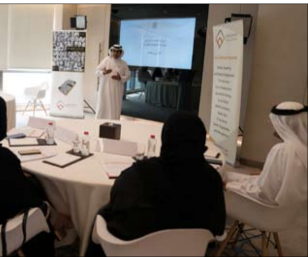
إيماناً بأهمية دورهم في منظومة الاتصال الحكومي والمسؤولية التي تقع على عاتقهم في تمثيل الإمارات وقصة نجاحها

إلى العالم. وأضافت "تعاون مع مكتب الاتصال الحكومي مع أفضل المؤسسات الإعلامية وأهم الخبراء في الاتصال الحكومي لتطوير برامج تدريب متخصصة تستهدف تطوير ممارسات الاتصال الحكومي في حكومة الإمارات وجعلها نموذج مميز إقليمياً وعالمياً". من جانبه أكد المشاركون في الورشة أهميتها في إضراء المعارف واكتساب الخبرات وما تقدمه من ثقافة معرفية وتعامل بين جهود المؤسسات الحكومية كافة وبما يدعم توجهات القيادة الرشيدة وتحقق أهداف الحكومة الاتحادية.