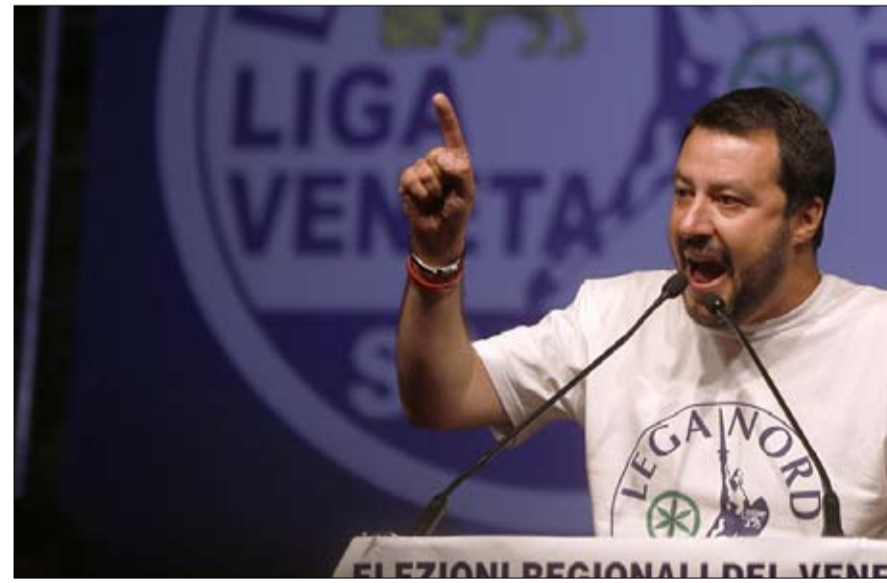
سالفيني والرابطة هل يفرض عقد اليمين