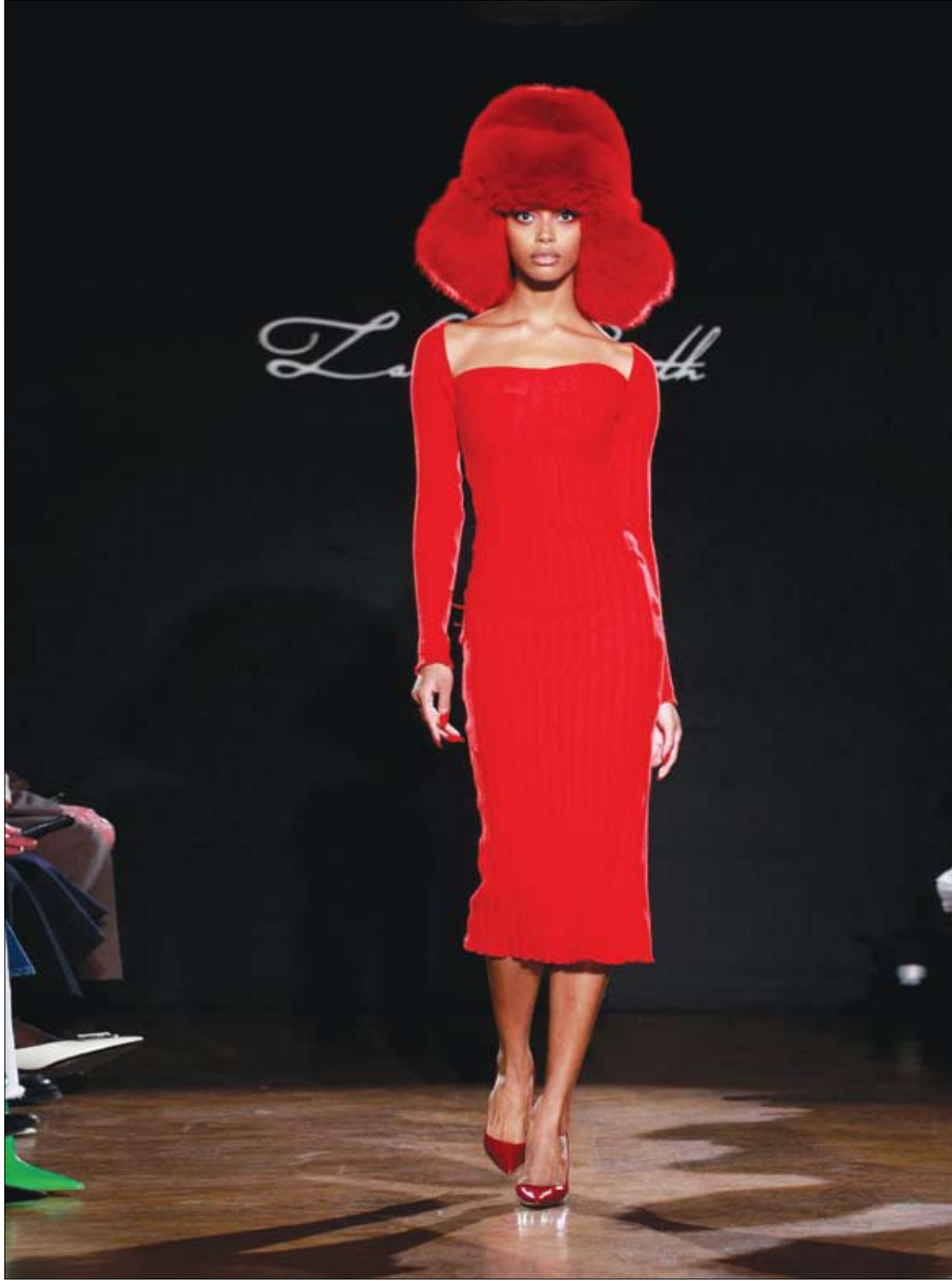
عارضة أزياء تمشي على المدرج خلال أسبوع الموضة في نيويورك.

وتشمل العوامل الأخرى التي تؤثر على حالة المغذيات الدقيقة لدى كبار السن السمعة، واستخدام الأدوية، والتدخين، والثروة، والجنس، والموقع الجغرافي. وتوفر هذه الملاحظات طمأنينة لصانعي السياسات الغذائية بأن تعزيز الأطعمة بزيادة مستويات هذه الفيتامينات يمكن أن يكون له فوائد في الوقاية من هذه الحالة، بحسب الدكتور إيون ليرد، المؤلف الرئيسي للدراسة.