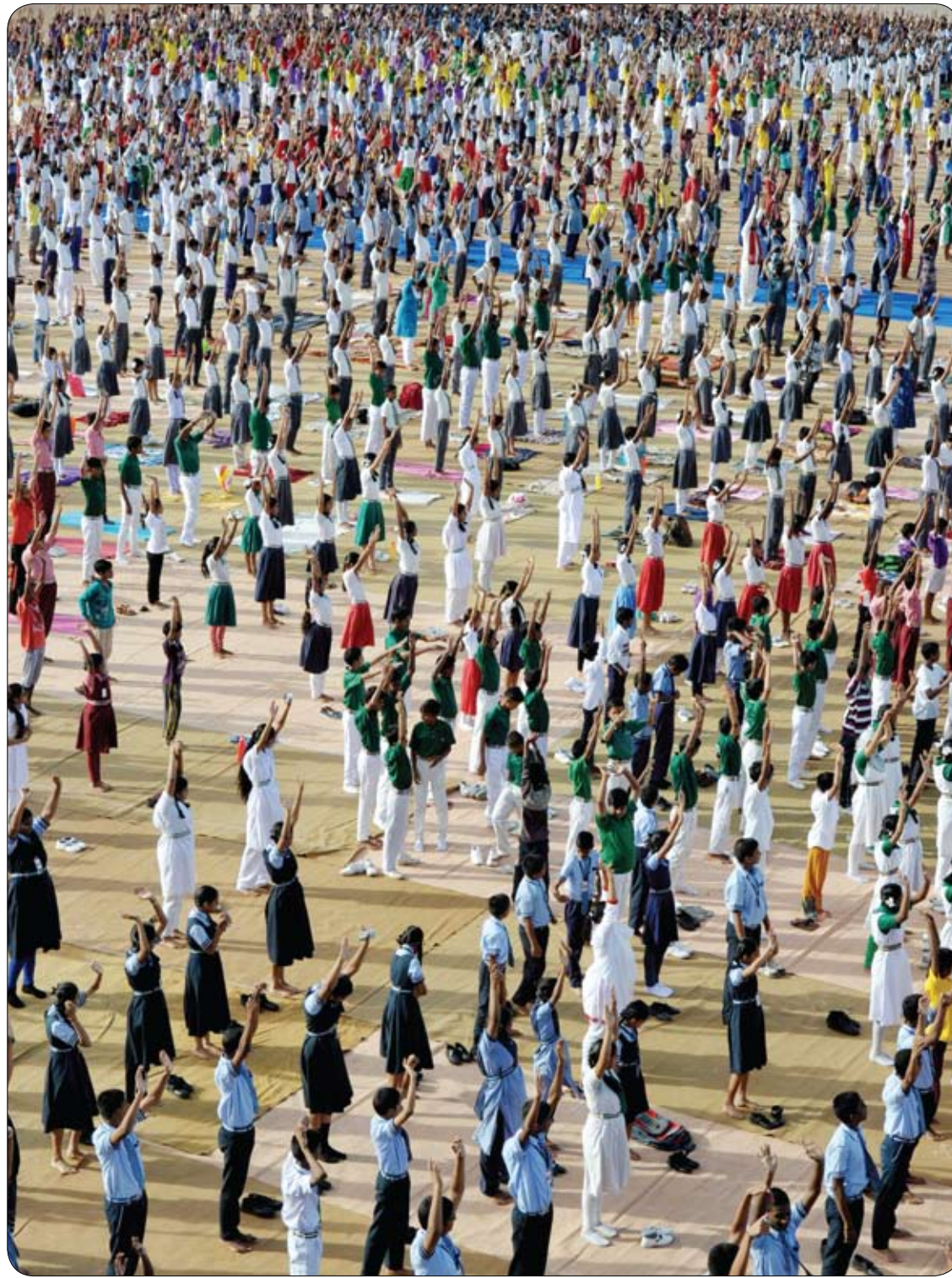
طلاب مدارس هنود يشاركون في معسكر لليوجا في حيدر أباد، عشية يوم اليوجا الدولي.