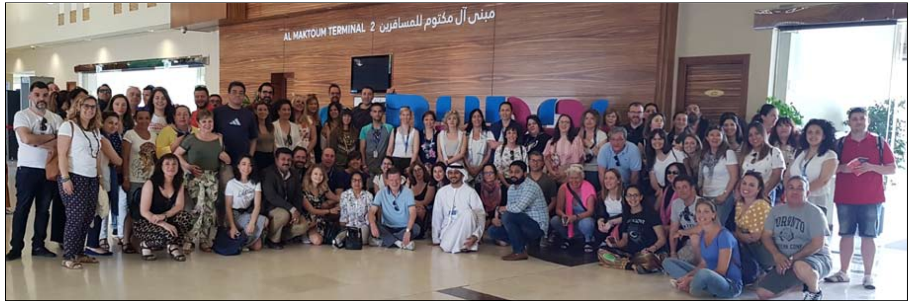
لجنة دبي للسياحة البحرية تستضيف ممثلين عن 100 جهة إعلامية ووكلاء سفر من البرتغال وإسبانيا

•• أبوظب-البحر: أعلنت شركة "مبادلة للبترول"، التابعة لشركة "مبادلة للاستثمار (مبادلة)" عن أنها استكملت صفقة الاستحواذ على حصة شركة "إيني الإيطالية البالغة نسبتها 10% في امتياز حقل "شروق" البحري للغاز في مصر والذي يضم حقل "ظفر" للغاز الطبيعي. وفي أعقاب استكمال الصفقة، ستولى "إيني" عملية تشغيل الحقل وذلك من خلال شركة "أي إي أو سي" التابعة لها، حيث تمتلك "إيني" بموجب الصفقة نسبة 50% من حصة الامتياز، فيما يمتلك الشركاء الآخرون، وهم كل من شركة بي بي البريطانية حصة 30% المئة وشركة روزنت نسبة 30%.