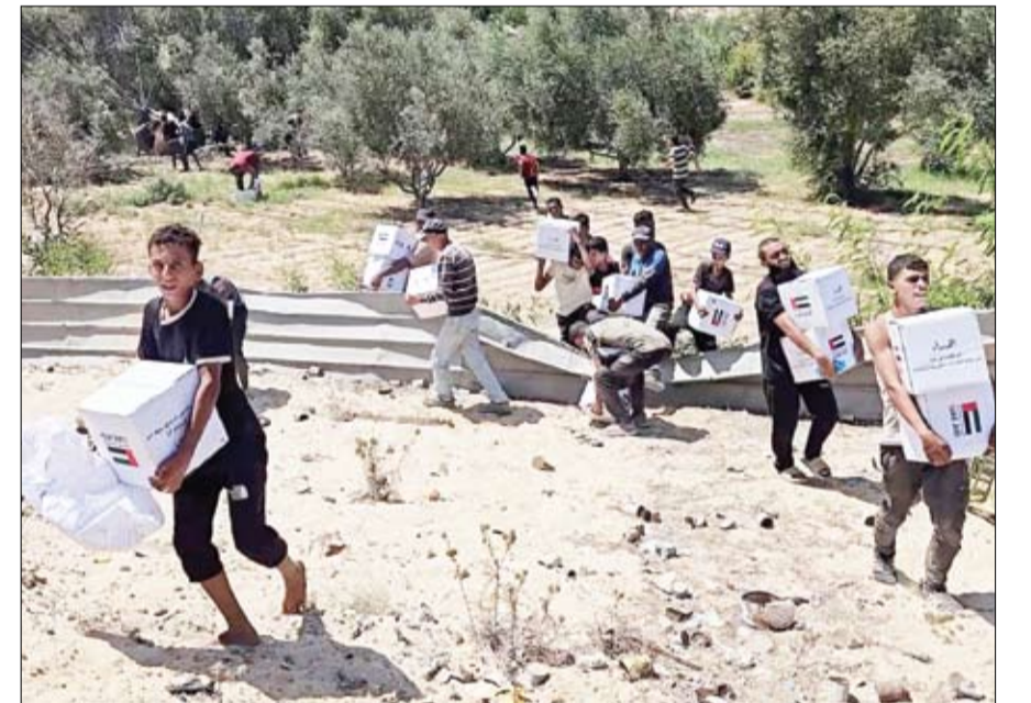
الإمارات تواصل دعمها الإنساني للشعب الفلسطيني في قطاع غزة (وام)

تواصل دولة الإمارات دعمها الإنساني للشعب الفلسطيني في قطاع غزة، حيث نفذت أمس عملية الإنزال الجوي الـ76 للمساعدات ضمن عملية طيور الخير، التابعة لعملية الفارس الشهيم 3، بالتعاون مع المملكة الأردنية الهاشمية الشقيقة، وبمشاركة كل من ألمانيا، فرنسا، هولندا، سنغافورة وإندونيسيا.