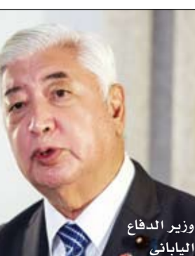
وزير الدفاع الياباني

قال وزير الدفاع الياباني جن ناكاتاني الأربعاء إن اليابان وتركيا ستبدأن محادثات تفصيلية لتعزيز التعاون في مجال التقنيات الدفاعية. وصرح الوزير بذلك بين اجتماعات مع مسؤولين أتراك وروؤساء تنفيذيين لشركات تصنع طائرات مسيرة وأسلحة أخرى. ووردت شركات مدعومة من تركيا طائرات مسيرة مسلحة إلى عدة دول، من بينها أوكرانيا، في حين تستعد اليابان لتوسيع استخدام قواتها البرية والجوية والبحرية للطائرات المسيرة.