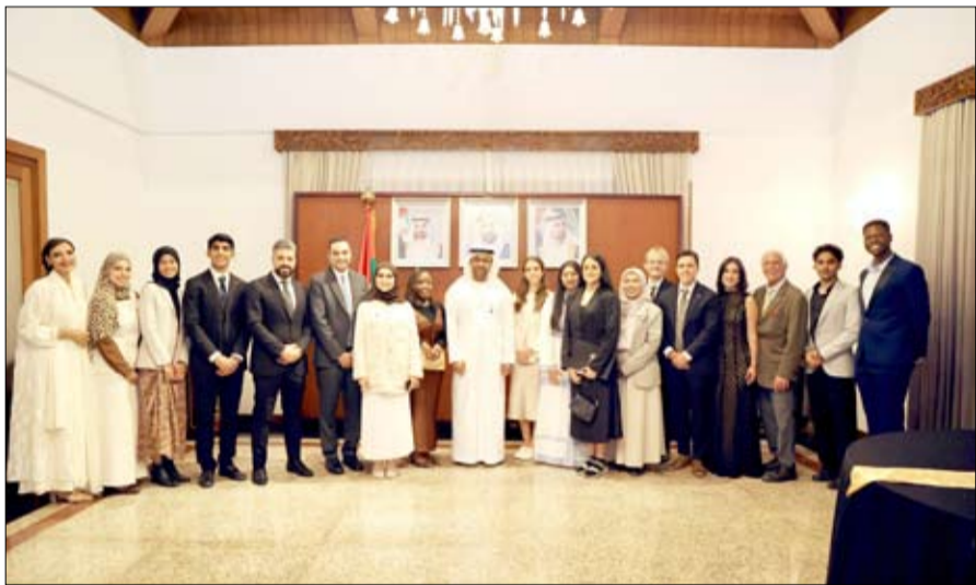
والأخوة الإنسانية على مستوى العالم، جمع الحدث أكثر من 60 ضيفاً من الشخصيات البارزة، بينهم وزراء وسفراء وأكاديميون وشخصيات دينية وقادة مجتمع وشباب من مختلف دول العالم

وحضره كل من: فخامة الدكتور معروف أمين نائب رئيس جمهورية إندونيسيا السابق، ومعالي نصرالدين عمر وزير الشؤون الدينية في إندونيسيا، وفضيلة الدكتور محمد قريش شهاب عضو مجلس حكماء المسلمين، إلى جانب ممثلين عن جمعتي نهضة العلماء والمحمدية، ودبلوماسيين رفيعي المستوى، وطلبة برنامج زمالة الأخوة الإنسانية لعام 2025، وشهد سعادة الظاهري في كلمة ترحيبية على التزام دولة الإمارات العميق والمتجذر بقيم التعايش والتسامح والأخوة الإنسانية، قائلاً إنها "ستظل دائماً موطناً للتعايش والتسامح".