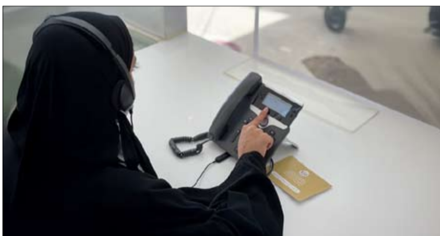
تأتي بهدف الارتقاء بالمستوى المعيشي لسكان الشارقة، من خلال مبادراتها لتحسين المساكن، بدعم مالياً في النصف الأول من العام الجاري 2025، ووزعت على ثمانين أسر من ذوي الدخل المحدود، وحيث استفادت منه 26 أسرة خلال عام 2024. بهدف تهيئة بيئة معيشية أفضل وتعزيز الترابط الأسري لمواطني الشارقة.