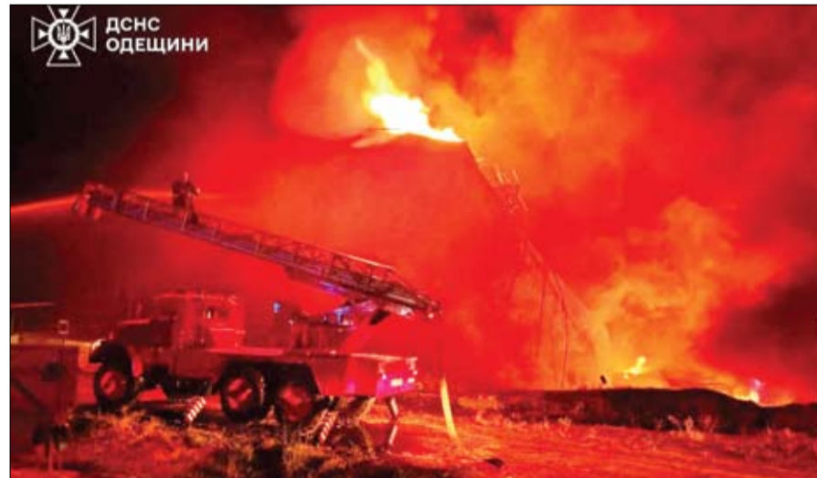
حريق في موقع منشأة تخزين وقود تعرضت لغارة روسية بطائرة بدون طيار، في منطقة أوديسا.

أعلنت وزارة الدفاع الروسية، أمس، عن إسقاط منظومات الدفاع الجوي التابعة لها، 42 طائرة أوكرانية مسيرة، فوق عدة مناطق في البلاد خلال الليل. وقالت الوزارة في بيان لها: خلال ليلة 20 أغسطس، اعترضت منظومات الدفاع الجوي ودمرت 42 طائرة مسيرة أوكرانية. وأوضح في بيانه أنه تم تدمير 14 مسيرة فوق أراضي مقاطعة فورونيج، و8 فوق أراضي مقاطعة تامبوف، و7 فوق أراضي مقاطعة كورسك. وأضافت أنه تم كذلك تدمير 5 فوق أراضي مقاطعة روستوف، و2 فوق أراضي كل من مقاطعات بريانسك وأورول وموليتسك، وواحدة فوق أراضي كل من مقاطعات كراسنودار وليبيتسك.