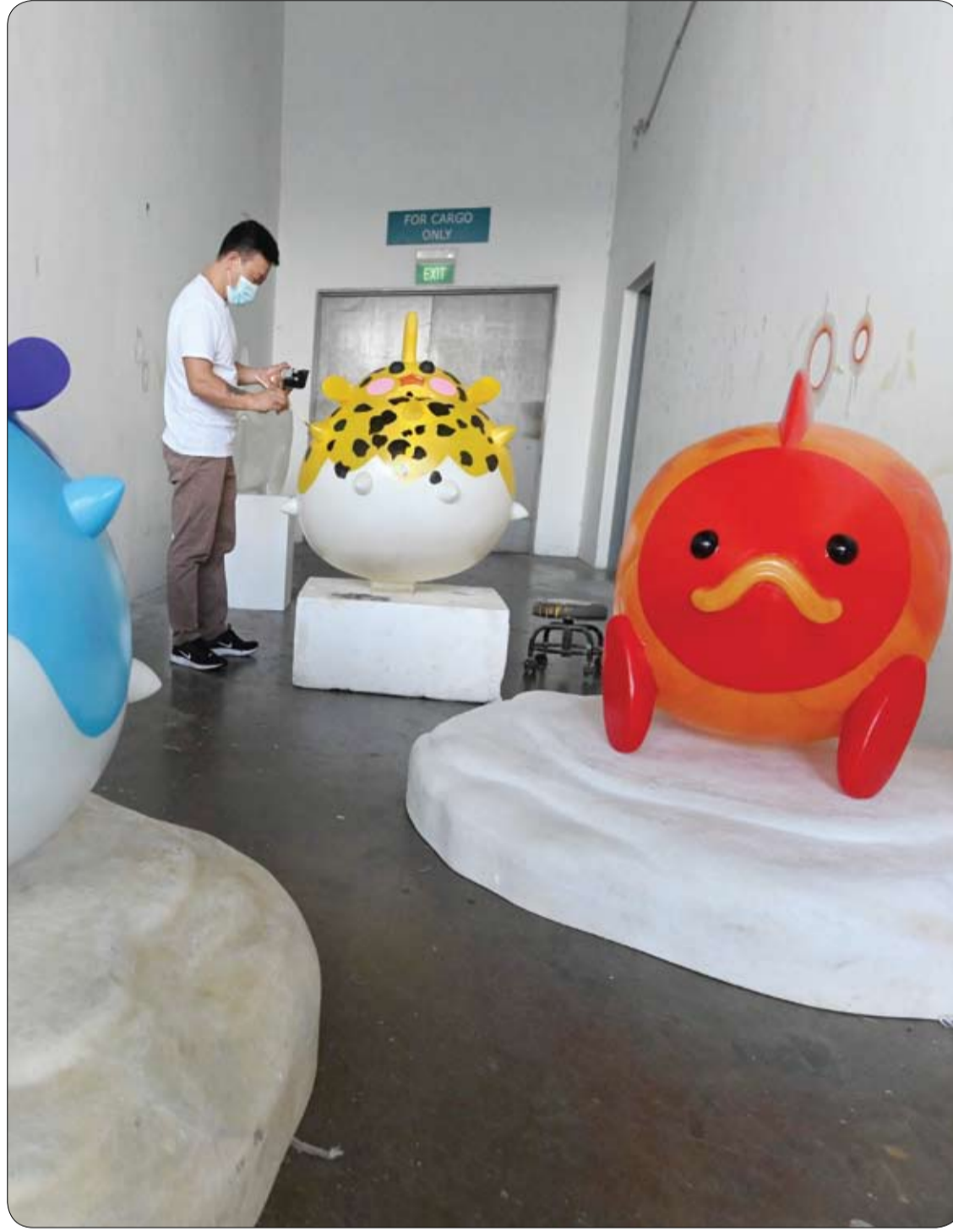
فنان يضع لمسة نهائية لواحدة من أربع فوائيس سمكية من البولي يوريثين لإضاءة مجمع قاعة صن يات سين نانيانغ التذكارية قبل مهرجان منتصف الخريف في سنغافورة.

- الانحناء قليلاً إلى الأمام في وضعية الجلوس، أو الوقوف، مع تجنب الاستلقاء، أو ميل الرأس للخلف؛ لأن ذلك سيُسبب بابتلاع الدم، والقيء. - التقاط الأنف من الجزء الناعم (ليس العظمي) من الناحيتين، مع تجنب الضغط على جانب واحد فقط، حتى لو كان النزيف من جانب واحد فقط. - الضغط على الأنف لمدة خمس دقائق على الأقل للأطفال، ومن 10 إلى 15 دقيقة للبالغين، مع عدم القيام بضغط الأنف؛ لاكتشاف ما إذا كان النزيف قد توقف، إلا بعد مضي الوقت المحدد. - وضع كمادات باردة، أو كيس ثلج على الأنف؛ لمساعدة الأوعية الدموية على الانقباض. - تكرار الخطوات السابقة إذا لم يتوقف النزيف، مع القيام بالضغط على الأنف لمدة لا تقل عن 30 دقيقة، وإذا لم يتوقف النزيف؛ فيجب التوجه إلى الطوارئ على الفور.