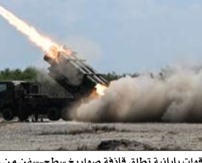
قوات يابانية تطلق قاذفة صواريخ سطح-سفن من طراز 88.

كوريا الشمالية تعاد دستورها لعُدْف الإشارة إلى توحيد شبه الجزيرة الكورية •• سول-رويترز: كشفت مسودة اطلعت عليها رويترز أن كوريا الشمالية عدلت دستورها لتعريف أراضيها على أنها متاخمة لكوريا الجنوبية وإزالة أي إشارة إلى إعادة التوحيد، مما يكسر مساعي الزعيم كيم جونج أون لعامة الكوريتين على أساس أنهما دولتان منفصلتان. وقال لي جونج تشول الأستاذ بجامعة سول الوطنية في كورينا الجنوبية أمس الأربعاء إن التعديل يمثل المرة الأولى التي تضيف فيها كوريا الشمالية بنداً يتعلق بالأرض إلى دستورها. ويعتقد أن اعتماد هذا التعديل تم في مارس آذار خلال اجتماع خمسة بالمئة من الناتج المحلي الإجمالي على الاستثمارات المتعلقة بالدفاع والأمن بحلول عام 2035. هذا وذكر وكالة نوفوستي الروسية، نقلاً عن وثائق صادرة عن وزارة الدفاع الأمريكية البناعون، أن إدارة الرئيس الأمريكي دونالد ترامب طلبت تخصيص أكثر من 30 مليار دولار لتطوير الإنتاج الدفاعي المحلي، في إطار مساع لتقليص الاعتماد على الموردين الأجانب