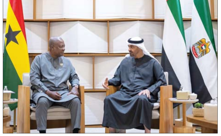
رئيس الدولة خلال لقائه رئيس غانا على هامش فعاليات منصة «اصنع في الإمارات»