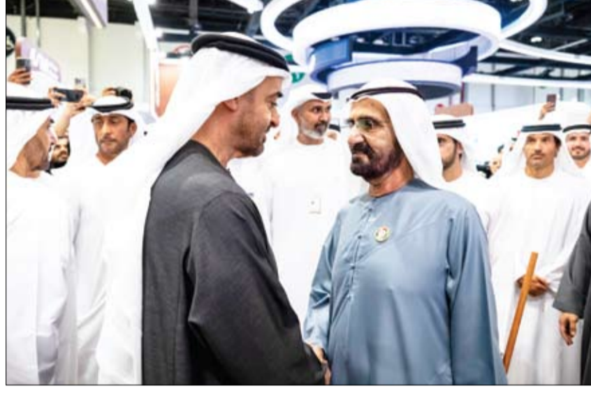
رئيس الدولة خلال لقائه محمد بن راشد لدى زيارته فعاليات منصة «اصنع في الإمارات»

في اليوبيل الذهبي لتوحيد رئيس الدولة ونائباه يعبرون عن فخرهم بقواتنا المسلحة درع الوطن وسنده •• أبوظبي-الفجر: في الذكرى الخمسين لتوحيد قواتنا المسلحة قال صاحب السمو الشيخ محمد بن زايد آل نهيان، رئيس الدولة، حفظه الله، في تدوينة على حساب سموه على منصة (إكس): إنتمو علم يعتز فيكم حاكم إنتمو على سبع الإمارات حراس من جانبه قال صاحب السمو الشيخ محمد بن راشد آل مكتوم، نائب رئيس الدولة رئيس مجلس الوزراء حاكم دبي، رعاه الله، في تدوينة على حساب سموه على منصة (إكس): في الذكرى الخمسين لتوحيد قواتنا المسلحة نحتفي بجنودنا .. نحتفي بشهادتنا .. نحتفي بقيادة هذه القوات وعلى رأسهم القائد الأعلى لقواتنا المسلحة رئيس الدولة حفظه الله. هم درع الوطن .. وسيفه .. وحصنه .. وسيادته وأمنه. فخورين بقواتنا .. فخورين برئيسنا .. فخورين بالإمارات. كما قال سمو الشيخ منصور بن زايد آل نهيان، نائب رئيس الدولة نائب رئيس مجلس الوزراء رئيس ديوان الرئاسة، في تدوينة على حساب سموه على منصة (إكس): خمسون عاماً من العز والخصر... قواتنا المسلحة كانت ولا تزال درع الوطن وسنده، برجائها الذين نذروا أنفسهم لحماية راية الإمارات. في يوبيلها الذهبي، نحتفي بتاريخ من الشجاعة ونمضي بثقة نحو مستقبل أكثر قوة واعتزازاً.