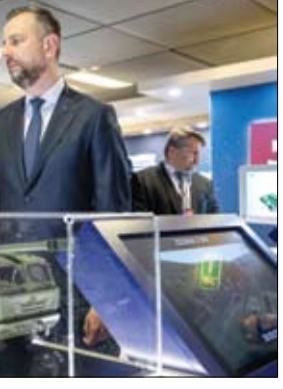
وزيرا دفاع بولندا وسلوفاكيا خلال زيارتهما مؤتمر، أيام الدفاع 24، في

غارات إسرائيلية على أهداف في لبنان •• بيروت-وكالات: أعلن الجيش الإسرائيلي، الأربعاء، عن شن غارات على أهداف تابعة للمليشيا حزب الله في أنحاء عدة من لبنان، رغم الهدنة التي جرى الإعلان عنها قبل نحو ثلاثة أسابيع، بحسب فرانس برس. وقال الجيش في بيان مقتضب بدأ الجيش الإسرائيلي باستهداف مواقع بنية تحتية تابعة للمليشيا حزب الله في عدة مناطق داخل لبنان. وبحسب الوكالة الوطنية للإعلام اللبنانية الرسمية، أغار الطيران الإسرائيلي على دفتين مستهدفاً منزلاً يقع بين بلدي قليا وزلايا في البقاع الغربي، ما أدى إلى تدميره بالكامل. وفي وقت سابق وجه الجيش الإسرائيلي إنداراً بإحلاله 12 بلدة وقرية في جنوب لبنان.