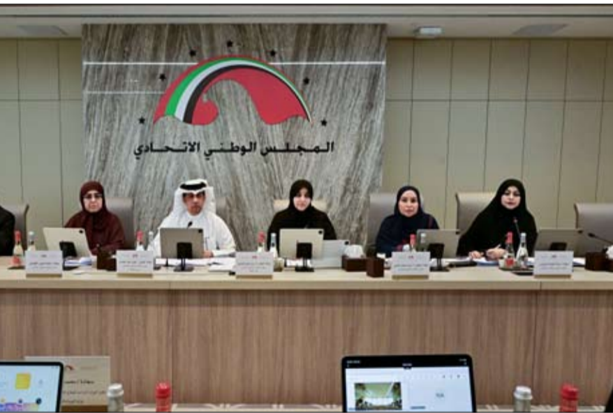
أصحاب الهمم مع متطلبات المواطنين في القطاع الحكومي، وسياسات الدمج المهني وتعزيز جودة الحياة الوظيفية، ودعم التكيف والاندماج الاجتماعي في بيئة العمل.

واصلت لجنة شؤون التعليم والثقافة والشباب والرياضة والإعلام في المجلس الوطني الاتحادي، خلال اجتماعها الذي عقده أمس الأربعاء في مقر الأمانة العامة للمجلس بدي، برئاسة سعادة الدكتور عدنان حمد الحمادي رئيس اللجنة، دراسة موضوع سياسة الحكومة بشأن جودة حياة أصحاب الهمم، ودمجهم في التعليم والعمل، بحضور ممثلي وزارة الأسرة، ووزارة التربية والتعليم، ووزارة التعليم العالي والبحث العلمي،