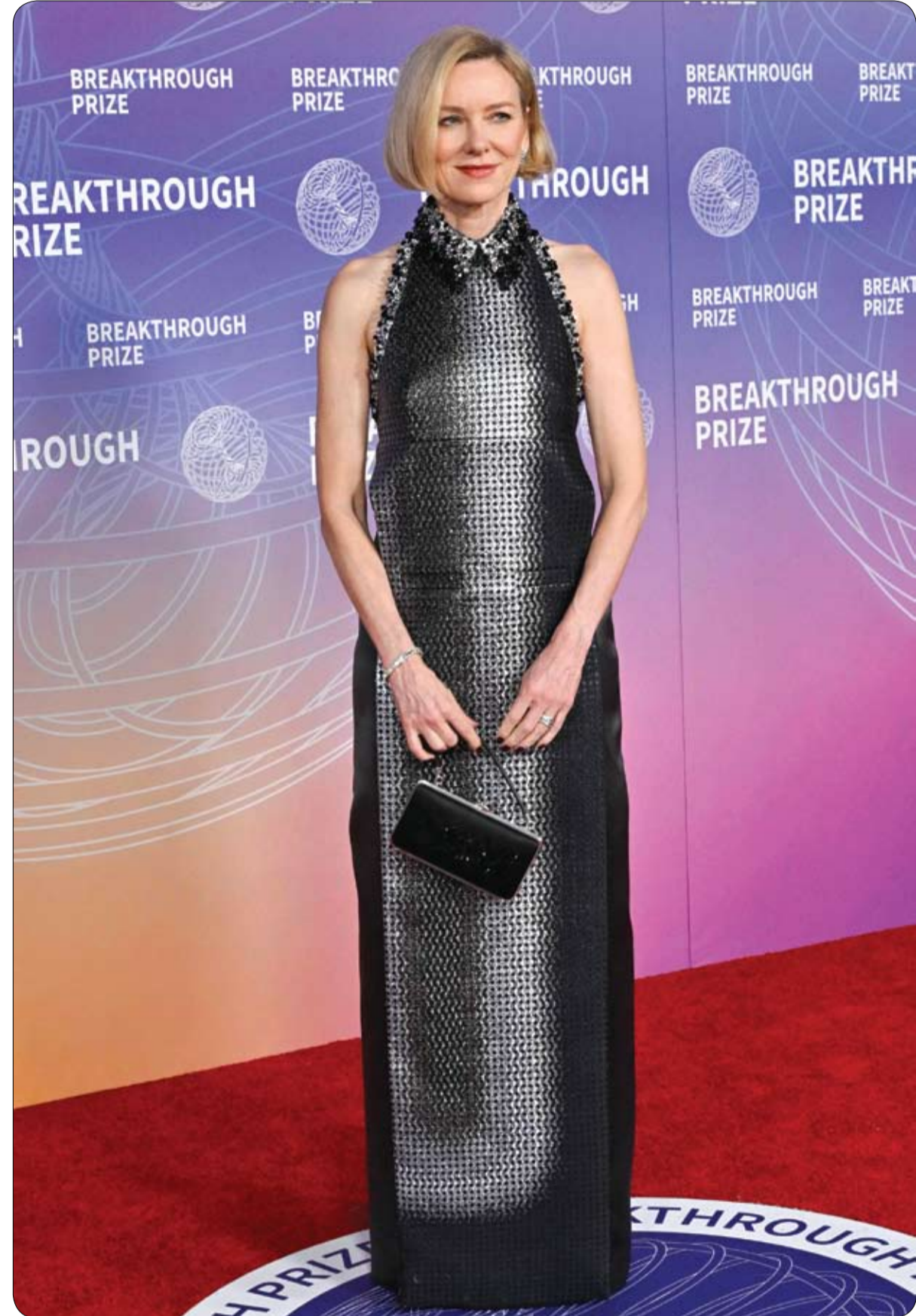
الممثلة البريطانية نعومي واتس لدى حضورها حفل توزيع جوائز بريكترو الثاني عشر في بارك هانغار في سانتا مونيكا، كاليفورنيا. ا ف ب

يعرض الملياردير الأمريكي جيف بيزوس بشكل غير معلن، بيعته الفاخر "كور" للبيع، والذي تُقدر قيمته بنحو 500 مليون دولار، في خطوة يُرجح أنها تعود إلى ضخامته وتكاليف تشغيله المرتفعة. وبحسب موقع "بيج 6"، يُعد "كور" من أكبر البيخوت الشراعية في العالم بطول يصل إلى 127 متراً، ما يجعله ثاني أكبر يخت عالمياً بعد "رايزينغ صن" للمصمم فيفيد جيفن. ويرافق اليخت سفينة "أوبونا" تُقدر قيمتها بنحو 75 مليون دولار، فيما تشير التقارير إلى أن تكلفة تشغيل السفينتين معاً تصل إلى نحو 30 مليون دولار سنوياً، دون تأكيد ما إذا كانت سفينة الدعم مشمولة في أي صفقة بيع محتملة.