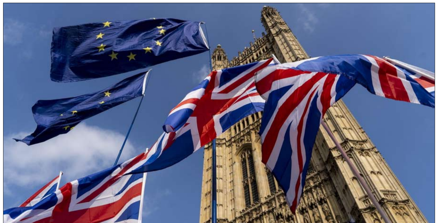
بريطانيا ما بعد البريكسيت خيرة كبيرة