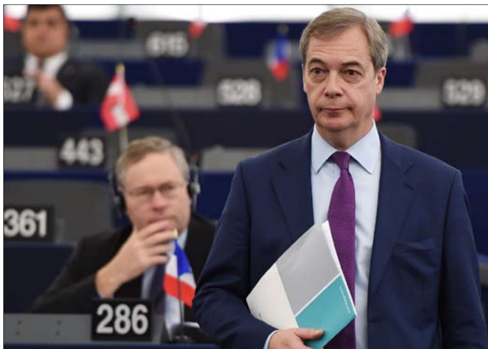
تيم كين التركيز على ما يهيم الناس