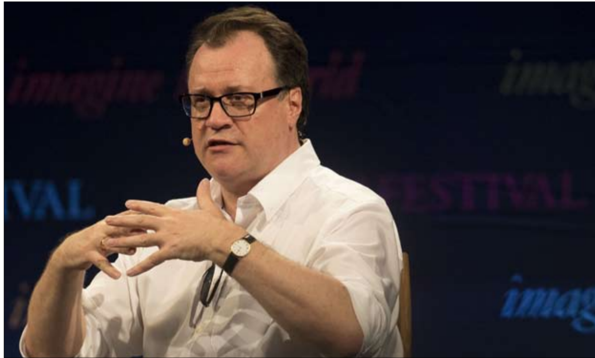
المؤلف روسيل تي ديفيز

ومع تنامي الاجتماعات، لم يتوقف بورييس جوسون، الزعيم الثاني للحركة، والرئيس المحتمل للحكومة القادمة، عن وضع الهجرة والجريمة واستغلال المساعدات الاجتماعية، في السلة نفسها. الفكرة الأساس للمسلسل وكان في قمة الهداء، ذاك المصق الذي وزَّعه نايجل فاراج في جميع أنحاء البلاد، ويظهر الآلاف من الشباب المهاجرين ملتحين وقدرين ومتهددين يسرون