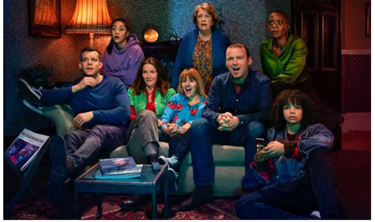
رؤية كابوسية وقاطعة للمستقبل