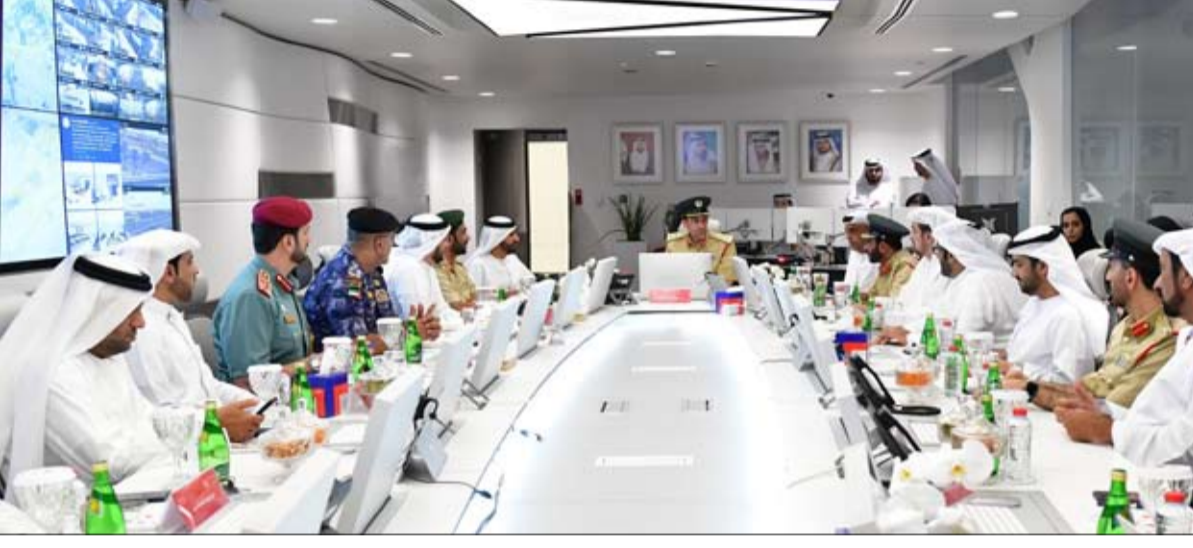
والجاهزية لإدارة الطوارئ واللواء المري، إدارة مركز التحكم الموحد في هيئة الطرق والمواصلات والأزمات والكوارث، كما شكر سعادة

وهيئة كهرباء ومياه دبي، وهيئة الطرق والمواصلات، وبلدية دبي، وهيئة الطيران المدني، ومؤسسة الاتصالات المتخصصة، والإدارة العامة للإقامة وشؤون الأجانب بدبي، والمكتب الإعلامي لحكومة دبي. واستعرض المجتمعون قرارات الاجتماع السابق وما تم تنفيذه منها، بالإضافة إلى عدد من المواضيع المدرجة في جدول الأعمال، ومن ضمنها سجل المخاطر، واستعدادات وخطط وإمكانيات