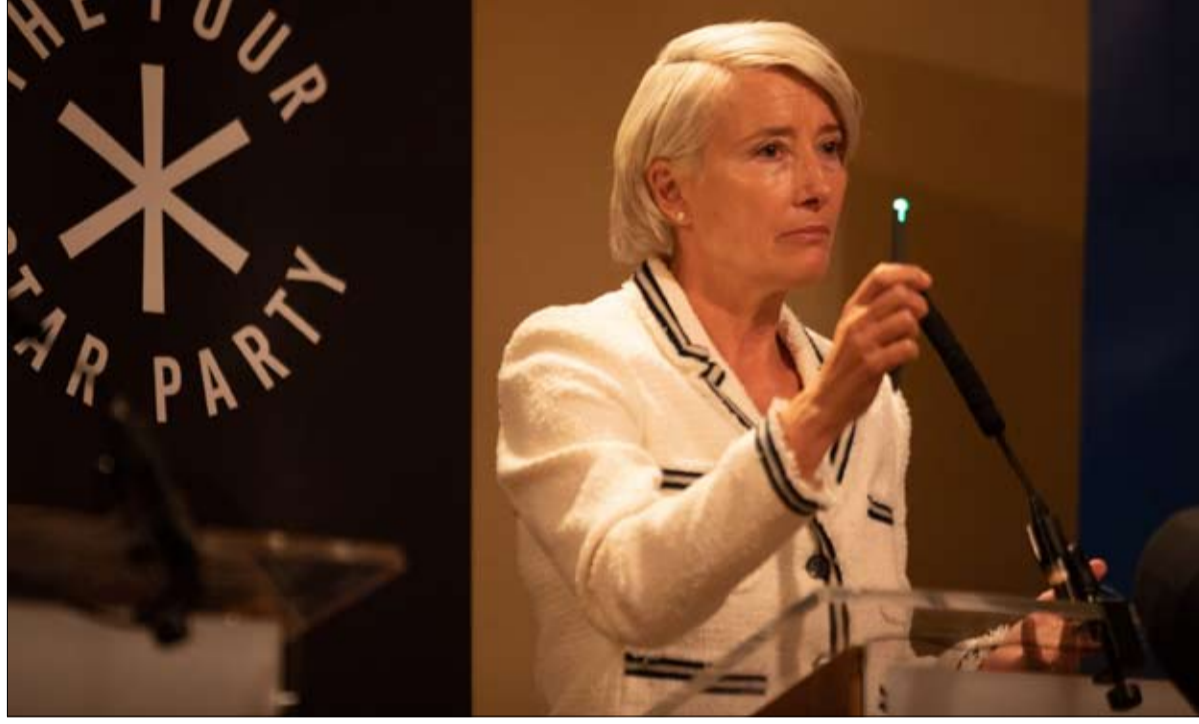
إيما طومسون النسخة النسائية للسياسي القومي نايجل فاراج

أعلن الرئيس التركي رجب طيب إردوغان أمس أنه يُفترض أن تبدأ في مطلع تموز يوليو عملية تسلّم صواريخ أس-400 الروسية المضادة للطائرات التي أثارَت صفقة شرائها من جانب تركيا توتراً شديداً مع الولايات المتحدة. وصرّح إردوغان لقناة "سي إن إن ترك" الأحد "اعتقد أن (صواريخ) إس-400) ستبدأ بالوصول في النصف الأول من تموز يوليو. وأشارت عملية شراء صواريخ روسية من جانب عضو في حلف شمال الأطلسي، غضب واشنطن التي أمهلت في السابيع من حزيران يونيو تركيا حتى نهاية تموز يوليو للعدول عن شراء هذا النظام الصاروخي