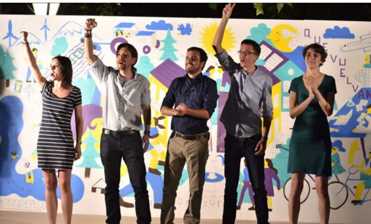
بوديموس.. تراجع يلد آخر