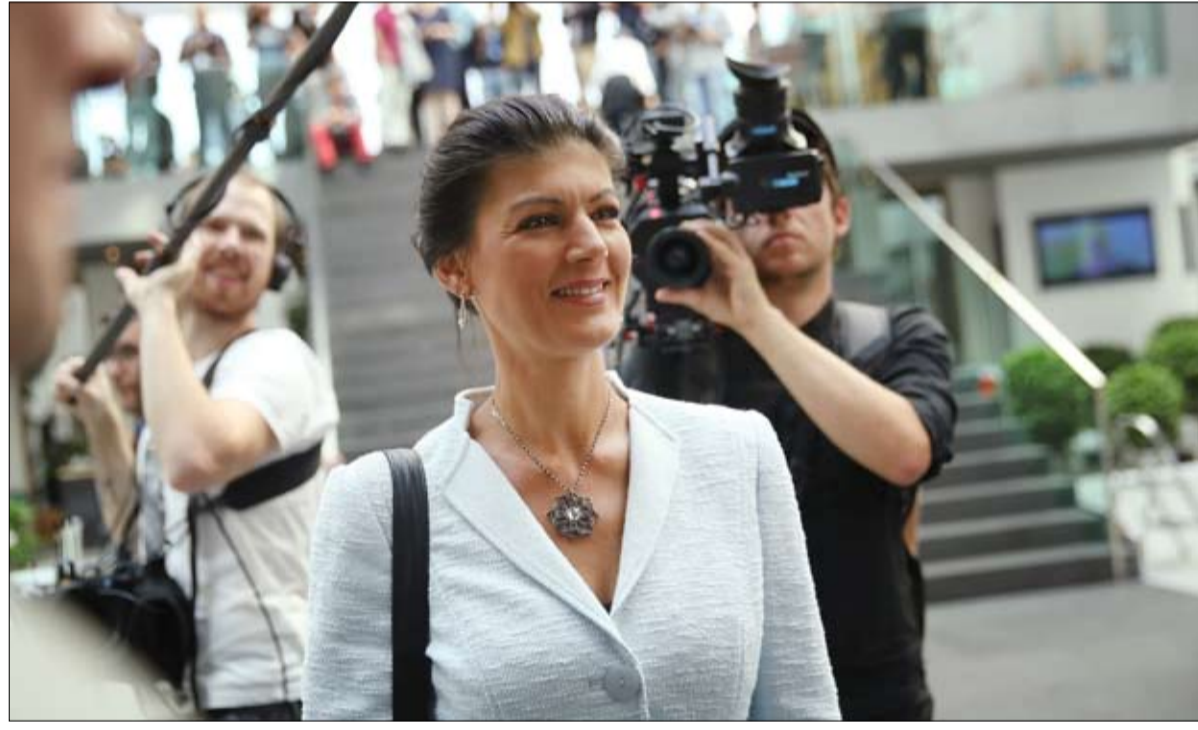
دي لينك.. لم يستمد من أزمة الاشتراكي الديمقراطي

ستكون مجموعة أقصى اليسار في البرلمان الأوروبي هي الأصغر على الإطلاق