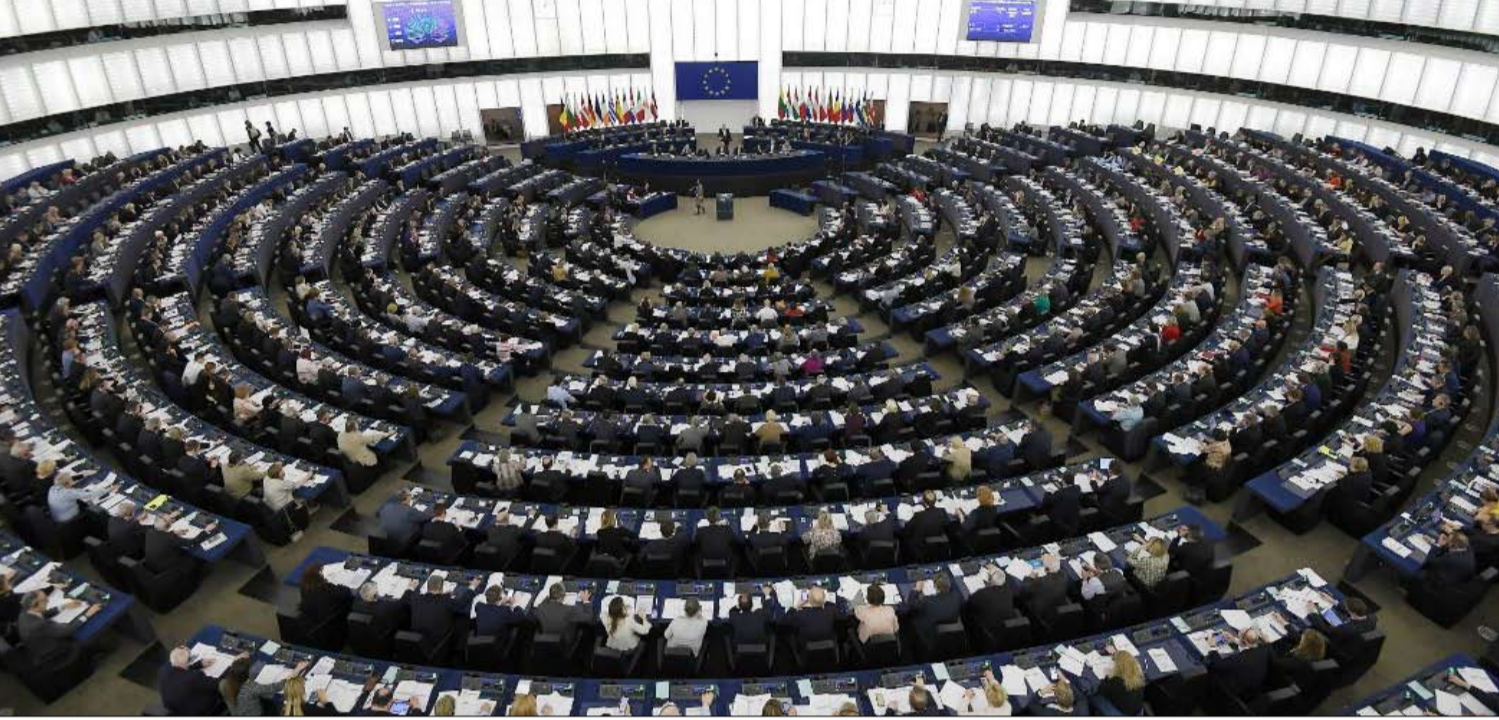
أقصى اليسار سيكون اصغر كتلة في البرلمان