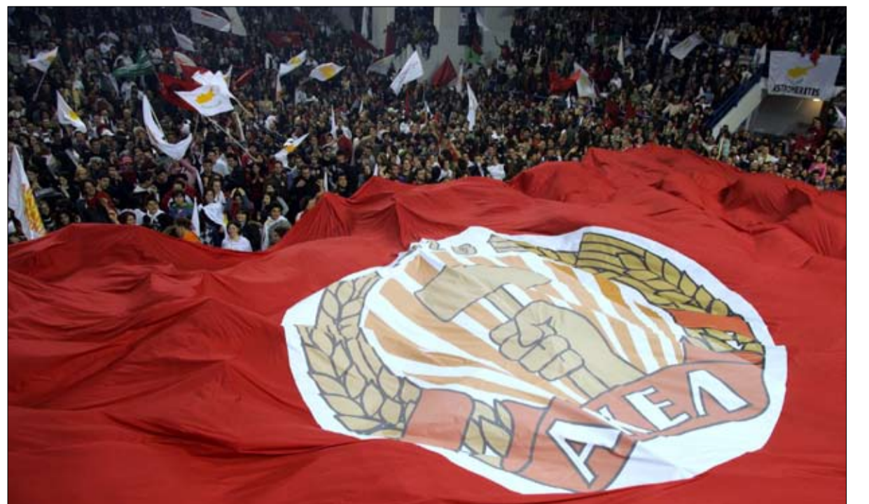
الحزب الشيوعي القبرصي يصنع الحدث يسارا

حققه الحزب اليساري قبل خمس سنوات، لكن بما يكفي لانتخاب ستة نواب أوروبيين.