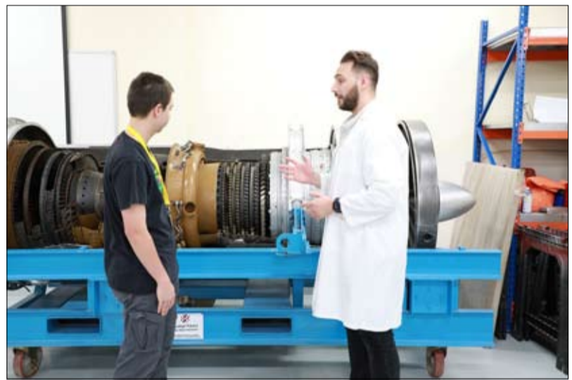
بمرفاق مطورة في جميع كلياتها