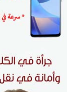
جراًة فيه الكلمة وأمانة فيه نقل الخبر

أعلنت البحرية الأميركية أن إحدى سفنها الحربية أبحرت أمس عبر ممر ماني حاس يفصل تايوان عن الصين، لتظهر وفقاً لها التزام واشنطن بالحفاظ على حرية الملاحة.