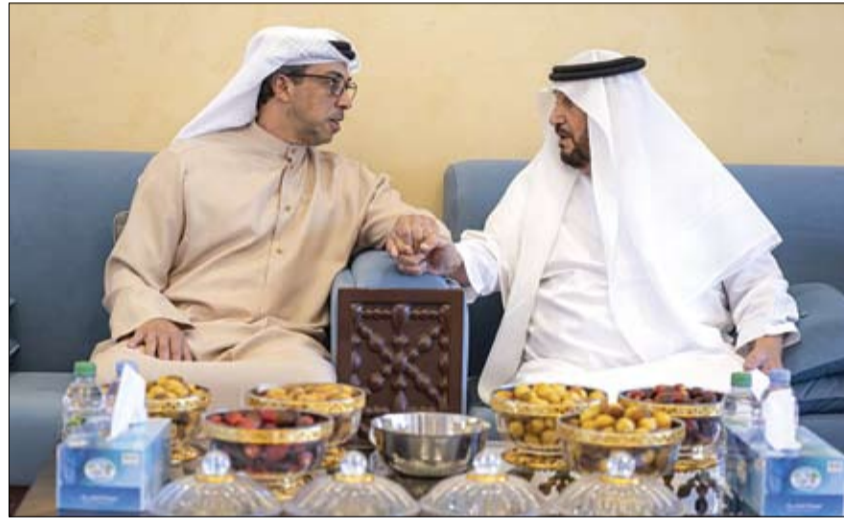
منصور بن زايد خلال زيارته محمد بن بطي آل حامد في منزله بمدينة أبوظبي (وام)

على صحته. وتبادل سموه والحضور الأحاديث الودية التي تعبر عن القيم الاجتماعية الأصيلة التي يتميز بها مجتمع الإمارات ويحرص على تعزيزها صاحب السمو الشيخ محمد بن زايد آل نهيان رئيس الدولة حفظه الله وقيادة الدولة الحكيمه. حضر اللقاء .. معالي الشيخ عبد الله بن محمد بن بطي آل حامد رئيس المكتب الوطني للإعلام ومعالى حميد سعيد عامر حمد الشياخي مدير مكتب رئيس ديوان الرئاسة وعدد من المسؤولين.