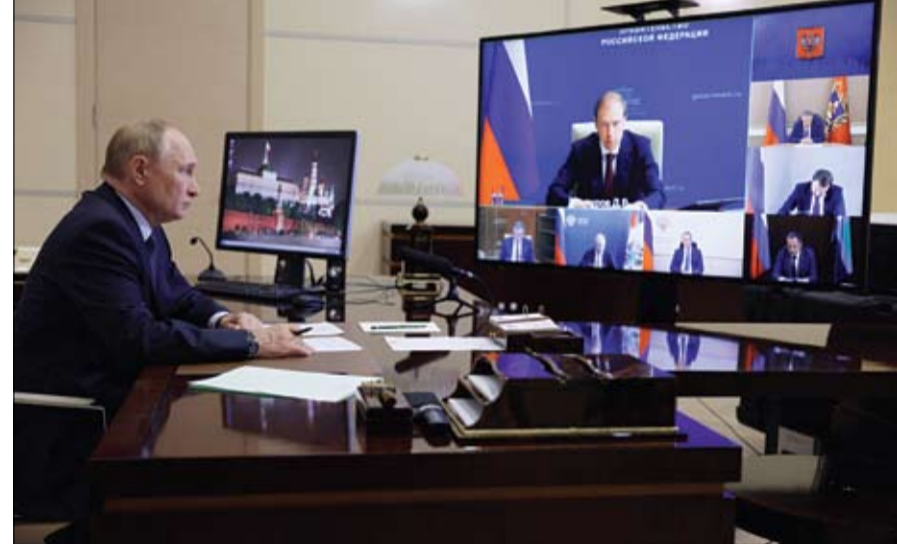
بوتن يترأس اجتماعاً بشأن الوضع في مناطق بيلغورود وكورسك وبريانسك، عبر رابط فيديو. (ا ف ب)

بوتن يترأس اجتماعاً بشأن الوضع في مناطق بيلغورود وكورسك وبريانسك، عبر رابط فيديو. (ا ف ب) سكان منطقة كورسك الحدودية، ويقي نحو 20 ألف شخص. وبين سميرونوف، خلال اجتماع عبر الفيديو مع الرئيس الروسي، فلاديمير بوتين، حول الوضع في المناطق الحدودية للبلاد أن 8 مناطق في مقاطعة كورسك حيث يعيش 152566 نسمة ضمن عمليات الإجماع، وحتى اليوم غادر 133190 شخصاً، وبقي هناك 19376 في الأثناء، أعلنت روسيا أمس الخميس إحباط هجمات أوكرانية بمسيرات وصواريخ في غرب البلاد، تحديداً في منطقة