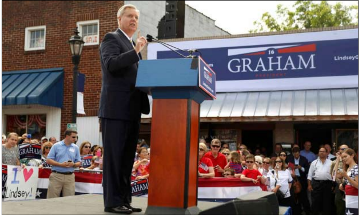
لينديسي غراهام... لا مناص من المعاناة

سعيد لسوء أحوال حلفائه، بالنسبة لترامب، كل هزيمة لبلد آخر هي انتصار للولايات المتحدة