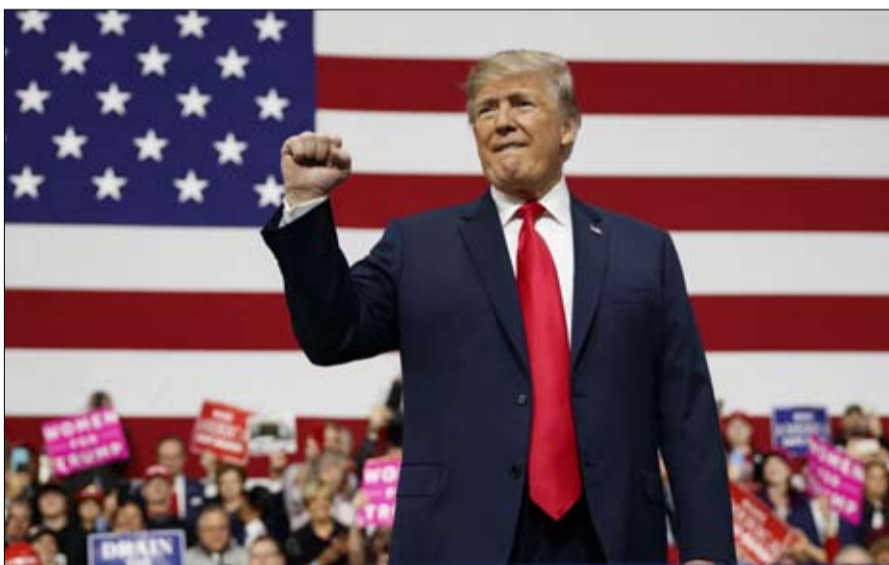
ترامب يلبس جلد بوش