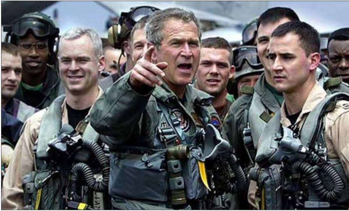
بوش... تفریط التضحيات اعاد انتخابه