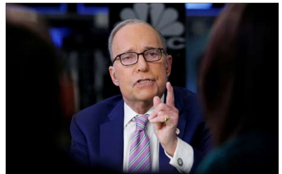
لاري كودلو... كان لا بد ان يدافع

من أغسطس. برنامج كودلو، استنسخه حرفياً، السناتور لينديسي غراهام، مستعيداً حججه لصالح الحرب على العراق، وحث الأمريكيين على شدّ الأحزمة. وقد توجه غراهام للجمهور بهذه الكلمات، "نحن في مرحلة حرب تجارية حيث تشعرون بارتفاع الأسعار في السوبر ماركت، ولكن علينا في وجه الصين". وعلى المدى الطويل، أضاف غراهام، "إذا ثابر ترامب"، ستخرج أمريكا منتصرة لأننا نملك "ذخيرة أكثر مما يملكون". في الواقع، يبدو أن ترامب يريد التصعيد. في 15 أغسطس، هدد الصين ب"باقصي أشكال الانتقام... لسنا سوى في البداية". في 26 أغسطس، نجح الرئيس الأمريكي ضمناً إلى أنه قد ينقطع، ببساطة، العلاقات التجارية بين البلدين، وحث من أنه إذا لم تتمثل الصين لشروطه، "فلن تكون هناك مبيعات تجارية بينهما بعد الآن"، كما هدد ترامب الاتحاد الأوروبي، وهو يجلس على نفس الطاولة مع الزعماء الأوروبيين. في 23 أغسطس، وقبل السفر إلى فرنسا للمشاركة في اجتماع مجموعة السبع، حذر الحكومة الفرنسية من أنه إذا لم تخفف ضرائبها على الشركات الأمريكية، فإنه "سيضرب ضرائب على التبيذ الفرنسي كما لم يحدث من قبل". ان عدوانية ترامب المستمرة هي تحذير، تماماً مثل إعادة احياء تكتيكات بوش الخطابية. هذه الاستراتيجية - المتمثلة في تمجيد التضحية، وتمجيد الوطنية، وتصوير المعارضين على أنهم جبناء - كانت ورقة رابحة لبوش. فقد أعيد انتخابه، وتم ترهيب منتقديه، واستمرت الحرب سبع سنوات أخرى. فشكراً لك إذا لم تسقط مرة أخرى في الفخ.