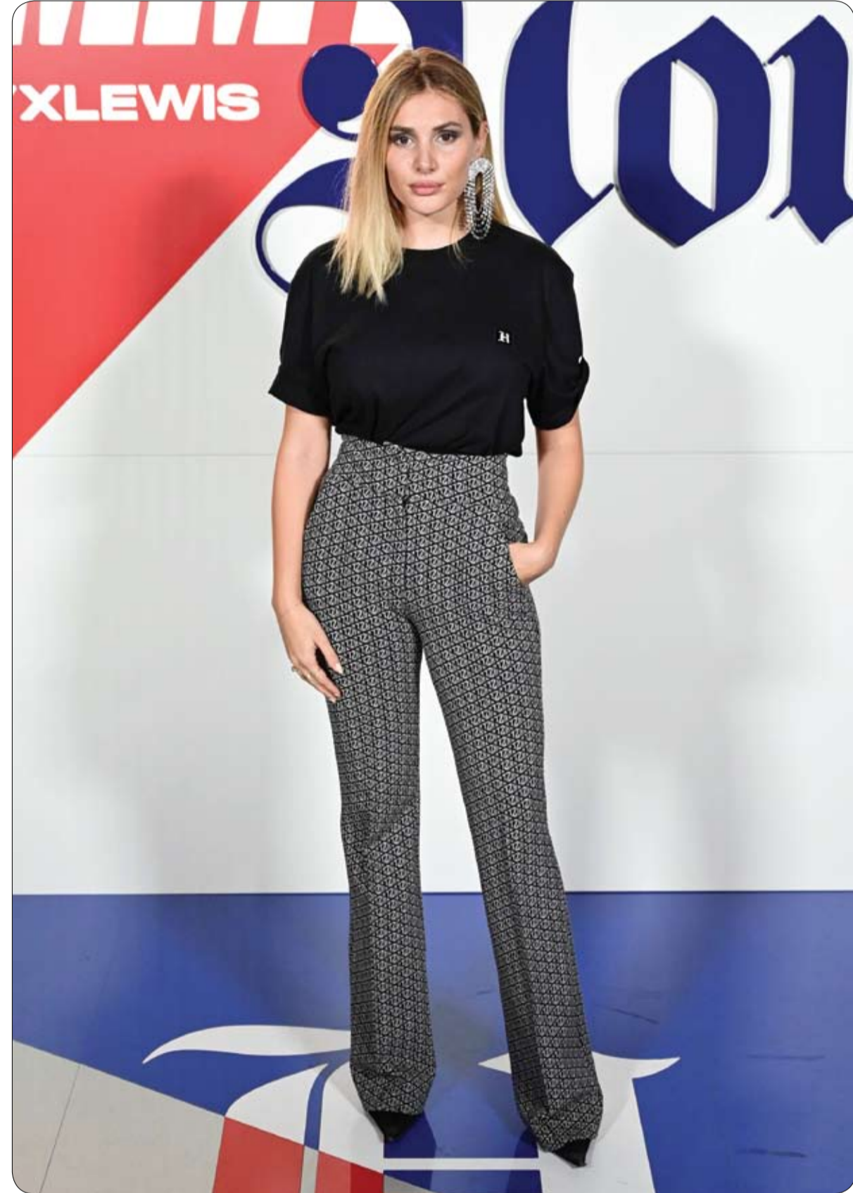
كريستينا موسكيو من صناع الأزياء الإيطالية خلال حضورها عرض مجموعة «تومي إكس لويس» ضمن أسبوع الموضة في ميلانو لربيع - صيف 2020.

وأمر القاضي بترميم الجدران التي تداعت خلال أعمال البناء، حتى لو كانت "الأضرار التي لحقت بها لا تقدر بثمن"، بحسب ما قال كارلوس سوموكورسيو رئيس اللجنة الفنية في المجلس الإقليمي لكوزكو الذي أذى على القيميين على هذا المشروع. وكان الفندق الممتد على 7 طوابق قد شيد في منطقة حيث لا يتخطى عادة علو المباني فيها طابقين. وكانت وزارة الثقافة قد فرضت غرامة بقيمة 2.2 مليون دولار على الشركة المعنية.