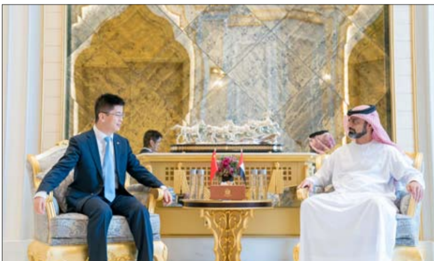
حضر اللقاء سعادة يوسف محمد النعيمي مدير عام التشرقيات والضيافة وعدد من كبار المسؤولين. المختلفة مشيداً بالنهضة الشاملة وبالطور الحضاري الذي تشهده دولة الإمارات عامة وعجمان خاصة في الميادين كافة. لما فيه مصلحة الشعبين الصديقين. وأكد سعادة القنصل الصيني أهمية التعاون المشترك في المجالات

استقبل سمو الشيخ عمار بن حميد النعيمي ولي عهد عجمان بديوان الحاكم امس سعادة لي شيوي هانغ القنصل العام لجمهورية الصين الذي قدم للسلام على سموه بمناسبة تسلمه مهام عمله الجديد لدى الدولة. ورحب سمو ولي العهد بالقنصل العام الصيني .. متمنياً له طيب الإقامة والتوفيق والنجاح في مهام عمله .. مؤكداً أنه سيدعم من المسؤولين كل تعاون لأداء مهامه في تعزيز أواصر التعاون المشترك بين البلدين الصديقين على مختلف المستويات. وبحث الجانبان خلال اللقاء علاقات التعاون الثنائية القائمة بين البلدين وسبل تطويرها