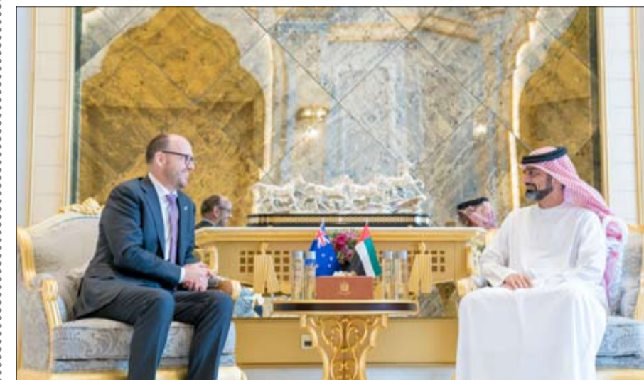
حضر اللقاء سعادة يوسف محمد النعيمي مدير عام التشرقيات والضيافة وعدد من كبار المسؤولين. وبالنهضة الحضارية الشاملة التي تشهدها دولة الإمارات عامة وعجمان خاصة في مختلف القطاعات والميادين.

استقبل سمو الشيخ عمار بن حميد النعيمي ولي عهد عجمان - في ديوان الحاكم - سعادة ماثيو هوكينز سفير نيوزيلندا الذي قدم للسلام على سموه بمناسبة تسلمه مهام عمله لدى الدولة. ورحب سموه بالسفير النيوزيلندي .. متمنياً له طيب الإقامة والتوفيق والنجاح في مهام عمله .. مؤكداً أنه سيدعم من المسؤولين كل تعاون لأداء مهامه. وجرى خلال اللقاء استعراض علاقات التعاون الثنائية القائمة بين الجانبين وتبادل الأحاديث التي من شأنها أن تعزز تلك العلاقة في العديد من المجالات وسبل توطيدها لما فيه مصلحة الشعبين الصديقين. وأعرب السفير عن سعادته بلقاء سمو ولي عهد عجمان .. مشيداً بمكانة وعمق العلاقات الثنائية