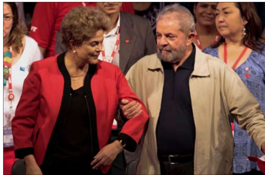
لولا وديلما جذر المشكلة