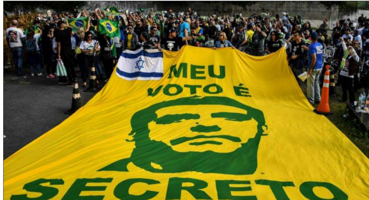
بولسونارو وانصاره لن يعترفوا بنتيجة أخرى غير الانتصار