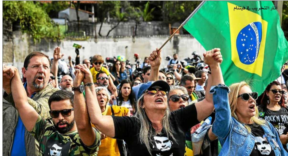
اليمن المتطرف يزحف في البرازيل