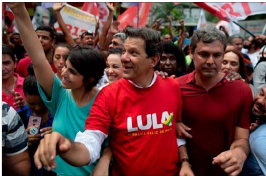
لولا الحاضر الغائب