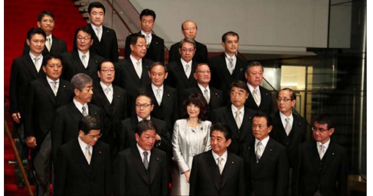
امرأة فقط في الحكومة اليابانية الجديدة