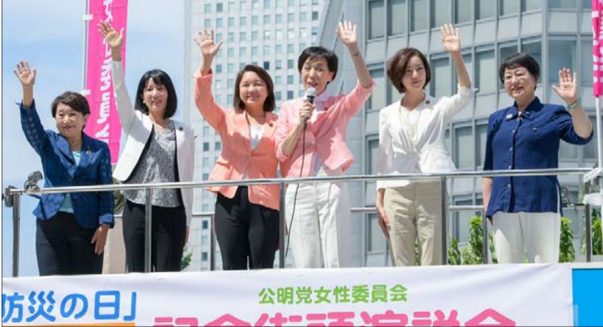
مشاركة ضعيفة للنساء في الحياة السياسية اليابانية

وقال بنس في كلمة في معهد هدسون المحافظ في واشنطن: "أقولها صراحة: إن رئاسة الرئيس دونالد ترامب ناجحة. الصين تريد رئيساً أميركياً غيره.. وأضاف: "لا يمكن أن يكون هناك شك في أن الصين تتدخل في الديمقراطية الأمريكية.." ويأتي هجوم الإدارة الأمريكية على الصين، بينما يجري تحقيق في ما إذا كانت حملة ترامب توافقات مع روسيا لترجيح كفة انتخابات الرئاسة لصالحه في 2016. وجاء في تقرير جديد لوزارة الدفاع الأمريكية البنتاغون أن الصين تشكل خطراً كبيراً ومتزايداً "على إمدادات ضرورية بالنسبة للجيش الأمريكي.