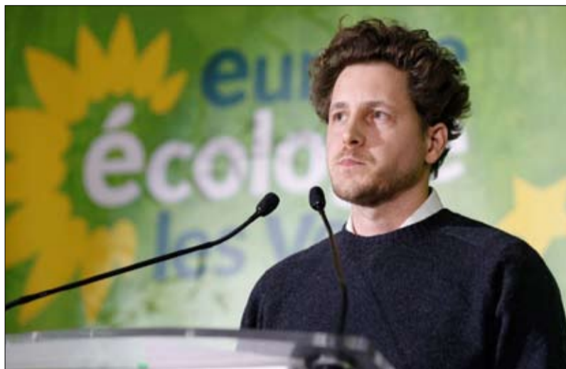
جوليان بايو... الخضر يواجهون أزمة مالية