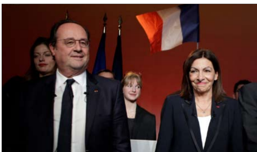
هل يعود فرنسوا هولند لإنقاذ الاشتراكي