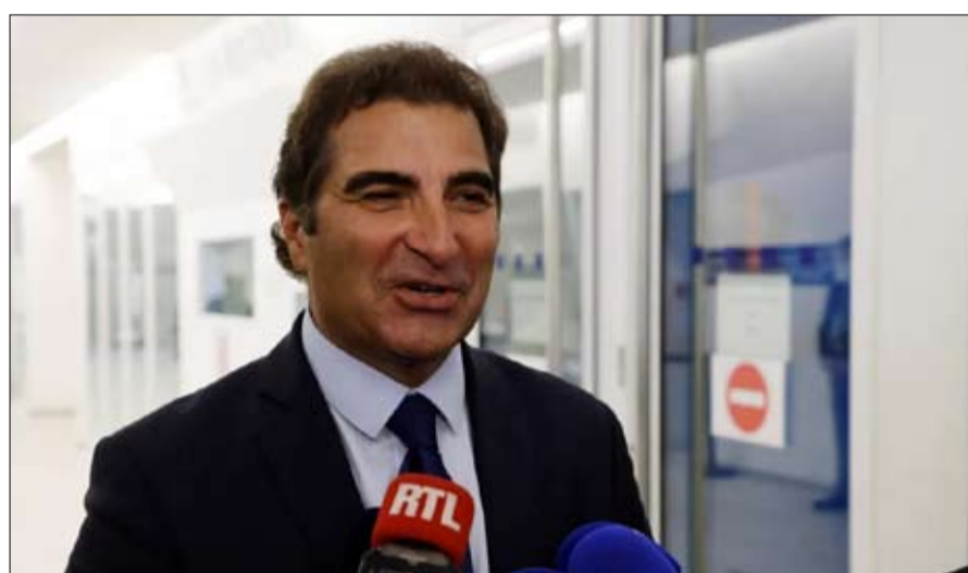
كريستيان جاكوب... إنقاذ الجمهوريين