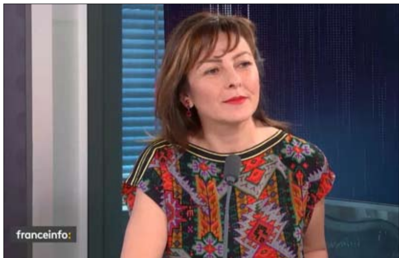
كارول ديغا أمل الحزب الاشتراكي