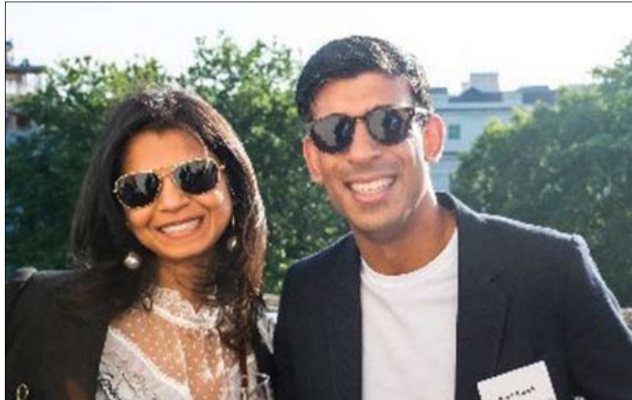
سوناك... كان صرحا فهوى

قد فرضت غرامة على المستشار لحضوره أحد هذه الحفلات غير القانونية. سلسلة من الزلات ولئن كانت جميع المؤشرات خضراء قبل بضعة أشهر، فرمما يكون ريشي سوناك قد أضعف فرصته. في مارس، أثار غضب بعض البريطانيين بعد الزيادة الكبيرة في الضرائب، و"القليل من المساعدة المقدمة للذين تضروا بشدة من تفشي التضخم". خصوصاً، انه إلى جانب إدارته