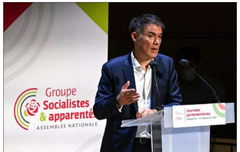
السكرتير الأول للاشتراكي أوليفيه فور والنداء المستحيل