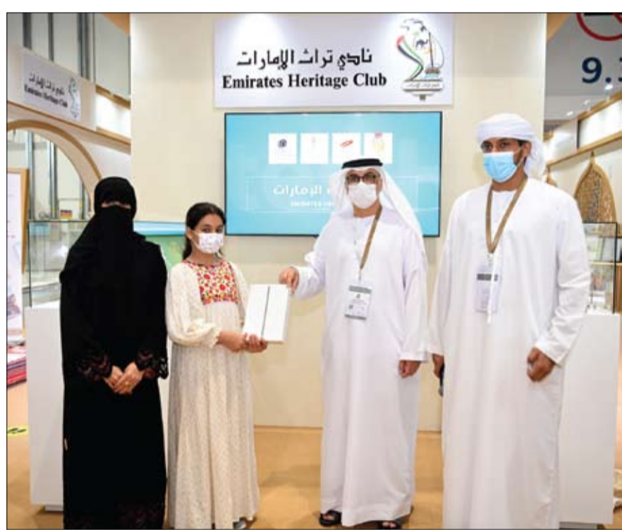
ورحلات الصيد ويعرض نماذج للؤلؤ والأدوات التي كان يستخدمها الفواص، بالإضافة إلى عروض حية ومتطلباته. ويضم جناح النادي هذا العام عدة أركان هي ركن التراث البحري للتعريف بمهنة الطواش

للسناعات البحرية، وركن الحرفيات الذي يتضمن ورشاً حية وتعليمية في الحرف اليدوية النسائية مثل التلي والسدو وصناعة البرقع وغيرها، بالإضافة لعرض المنتجات اليدوية ويضم الجناح أيضاً ركن البرزة الذي يتضمن ورشاً تعليمية للزوار عن عتاد الخيل والهجن، والمقهى الشعبي الذي يختص بإعداد الأكلات الشعبية الإماراتية وتقديمها للزوار، والرسم الحر وهو ركن ترفيهي للأطفال لتعليمهم المفردات التراثية من خلال الرسم والتلوين وعرض اللوحات الفنية. كما ينظم النادي خلال مشاركته في المعرض سلسلة من الندوات والمحاضرات والجلسات الحوارية والأسبقيات الشعرية، بالإضافة للمسابقات التراثية، وعروض الألعاب الشعبية وركوب الهجن.