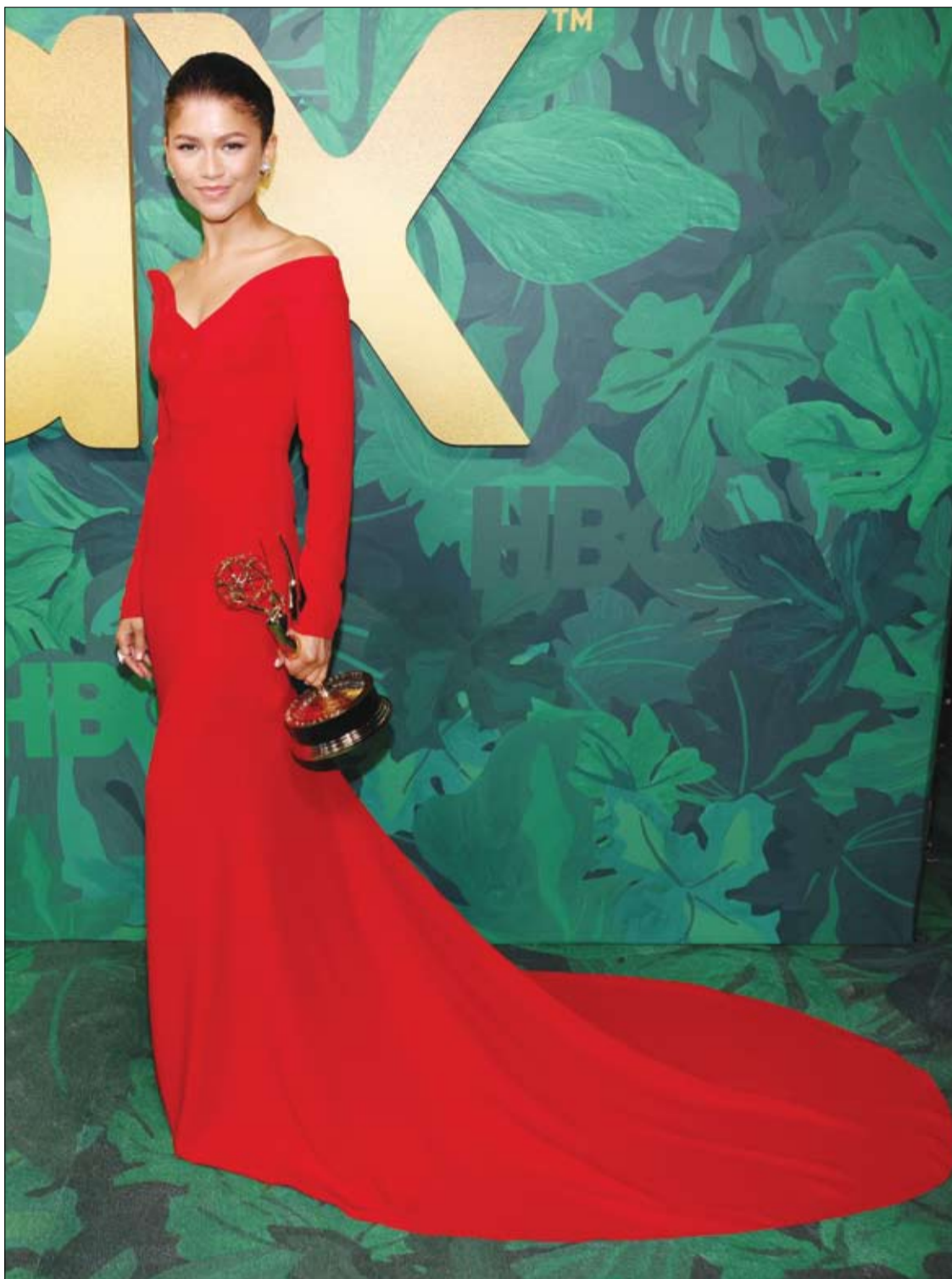
زيندايا خلال حضورها حفل HBO Emmy's 2022 في ويست هوليوود، كاليفورنيا.

وقد تعلم علماء الأعصاب من دراسات التصوير كيف يستحوذ الإدمان على مركز المكافأة في الدماغ، ويختلف مسارات الدوبامين ويسلب الناس القدرة على الاستمتاع بالمتعة البسيطة. قال عالم النفس ستيفن هيجينز من جامعة فيرمونت، رائد الطريقة في عام 1991: "إنها تستخدم إلى حد كبير نفس نظام مكافأة الدوبامين الذي هو أساس الإدمان لتعزيز التغيير الصحي للسوك"، وأظهر بحثه الأخير أنه يساعد النساء الحوامل على الإقلاع عن التدخين و يحسن صحة الأطفال حديثي الولادة.