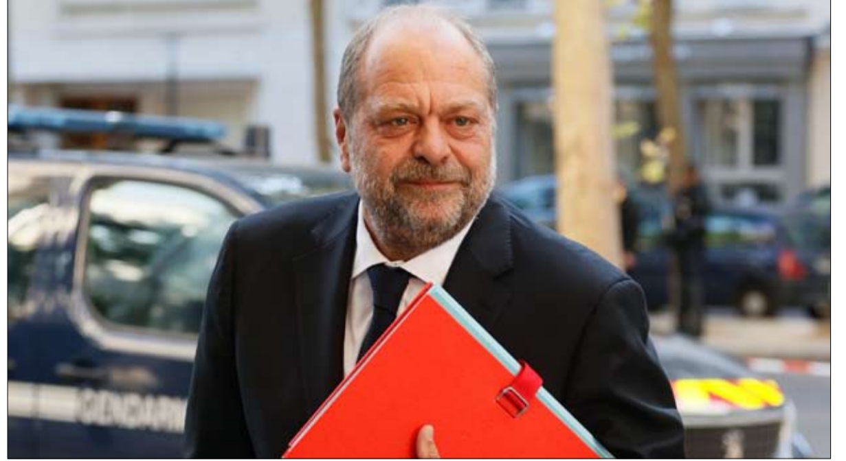
إريك دوبون موريتي هزيمة ماكرون