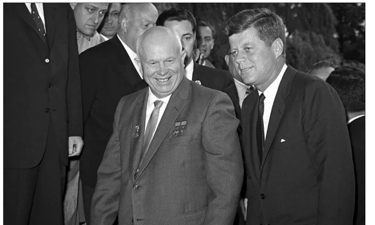
غورباتشوف... روسيا الرخوة