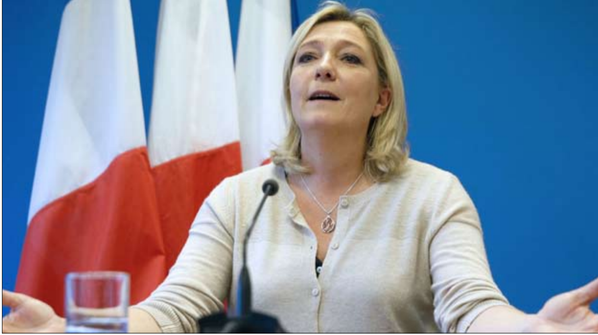
التجمع الوطني لنتيجة غير ما قالت استطلاعات الرأي