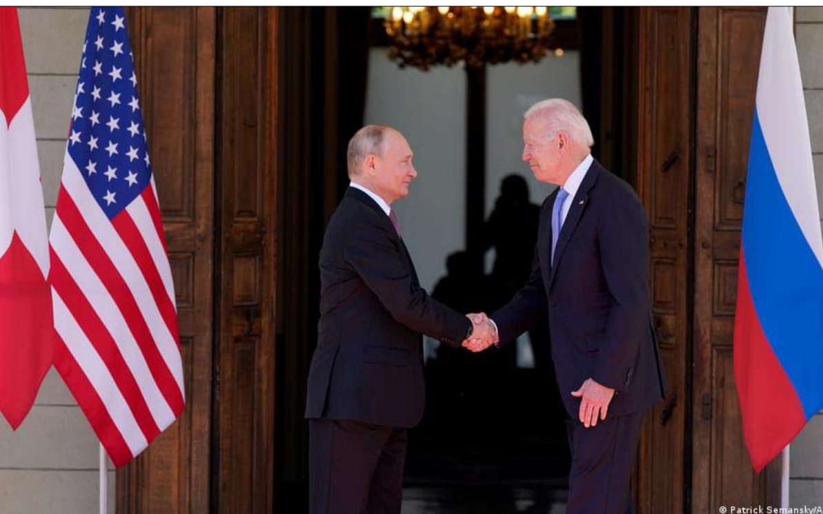
فلاديمير ليس ستالين

قبل ستين عاماً، في يونيو 1961 في فيينا، مرة أخرى على أرض محايدة، عقد الاجتماع