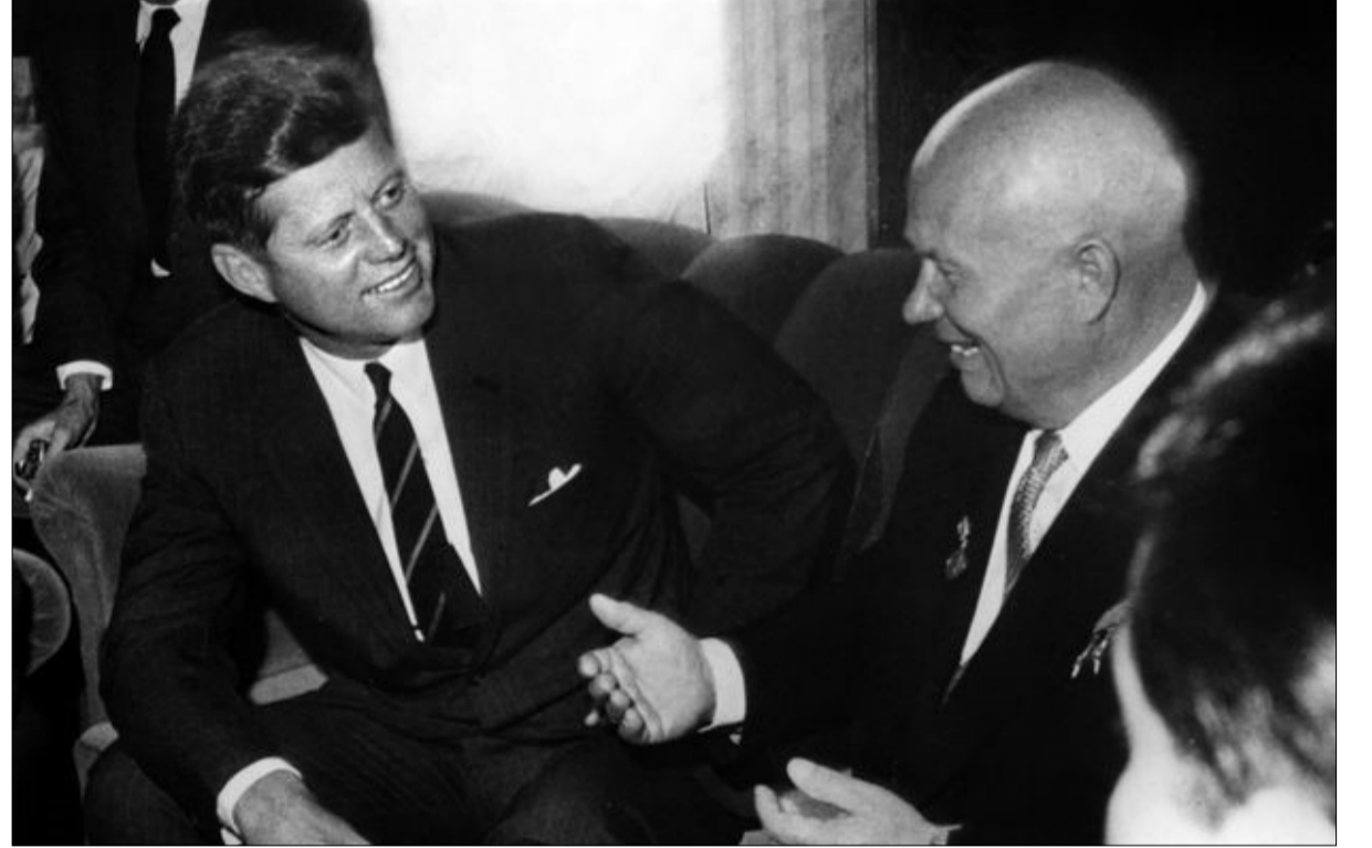
الرئيس الأمريكي جون كينيدي والزعيم السوفياتي نيكيتا خروتشوف عندما التقيا في فيينا عام 1961