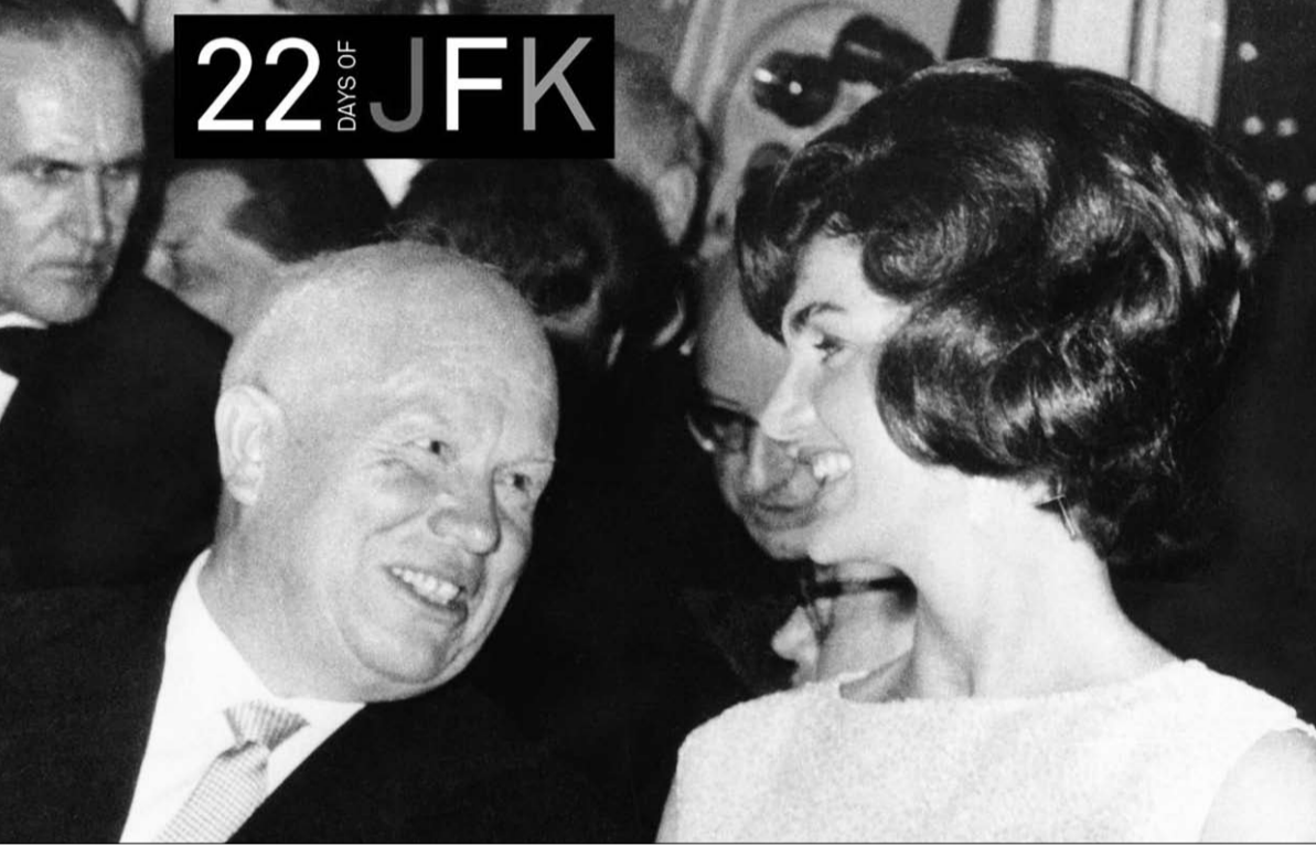
جاكي كينيدي وخروتشوف