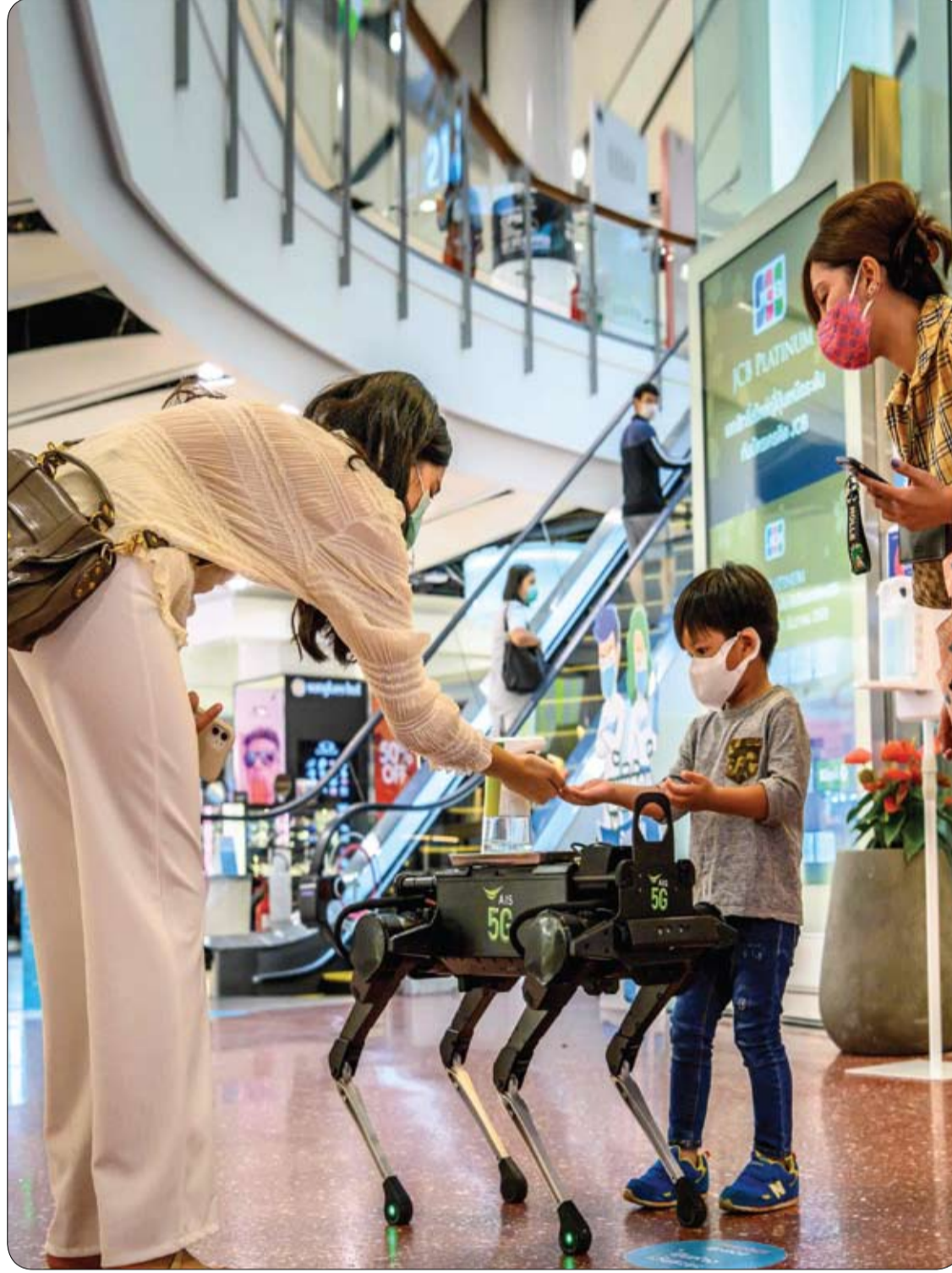
«روبوت» يوزع مطهراً يدوياً للزوار بأحد مراكز التسوق في باتوكوك، مع إعادة فتح قطاعات الاقتصاد في تايلاند.

يُسكب الماء المغلي على جزء من الأرضية المراد إزالة الغراء عنها، مع تركه لدقيقتين حصراً، فالاستعانة بسكين (مجحف) لكشط الغراء اللين عن الأرض، مع مراعاة مسح المجحف بقطعة قماش نظيفة بين الحين والآخر. الكي يخلص من البقع الصغيرة المتبقية من غراء الموكيت، وذلك عبر تحديد مكان وجود بقع الغراء الصغيرة، ثم، تغطى منطقة البقع بطبقة رقيقة من الجرانول، مع التأكد من أن الأوراق مستقيمة، وخالية من القيوب، أو التجاعيد. وتستخدم الكوة الساخنة في كي ورق الجرانول، بحركات مستقيمة، مع مراعاة تجنب الضغط الشديد بالكوة على الورق كي لا يحترق، والاستمرار في الكي حتى يسخن الورق بشكل يصعب لمسه. يزال ورق الجرانول من بقع الغراء، وتستخدم مكشطة طويلة لإزالة بقايا البقع، مع ضرورة توجيه الحافة الداخلية للمكشطة نحو الغراء ودفعها بقوة.