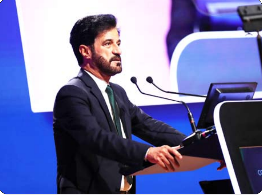
عضواً في الفئات المختلفة، كما يتولى وضع وتطبيق اللوائح المنظمة لرياضة السيارات، بما في ذلك بطولاته العالمية، بما يضمن أعلى معايير السلامة والنزاهة في المنافسات.

أعلنت جائزة فاطمة بنت مبارك لرياضة المرأة عن استحداث فئة جديدة تحت مسمى "أفضل رياضية للألعاب غير الأولمبية" ضمن فئات الجائزة في دورتها العاشرة، التي تم الإعلان عنها مؤخراً، والتي تقام برعاية سمو الشقيقة فاطمة بنت مبارك، "أم الإمارات" رئيسة الاتحاد النسائي العام، رئيسة المجلس الأعلى للأمومة والطفولة، والرئيسة الأعلى لمؤسسة التنمية الأسرية، وبدعم وتوجيهات ومتابعة الشقيقة فاطمة بنت هزاع بن زايد آل نهيان، رئيسة مجلس إدارة أكاديمية فاطمة