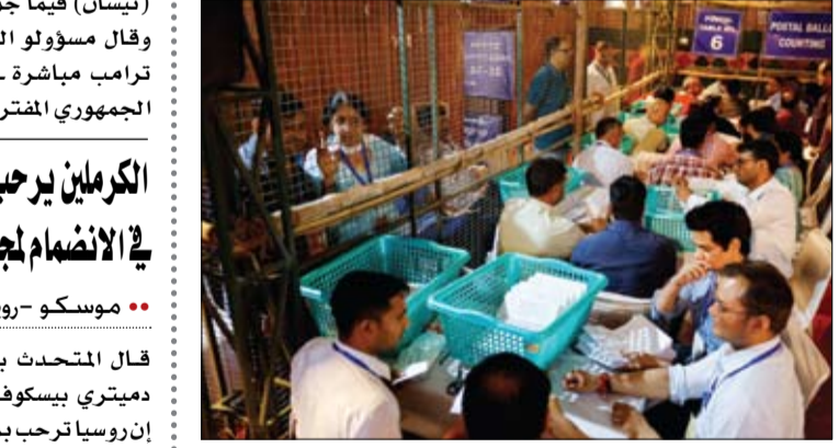
مسؤولو الانتخابات يفرزون بطاقات الاقتراع البريدية، في نيودلهي