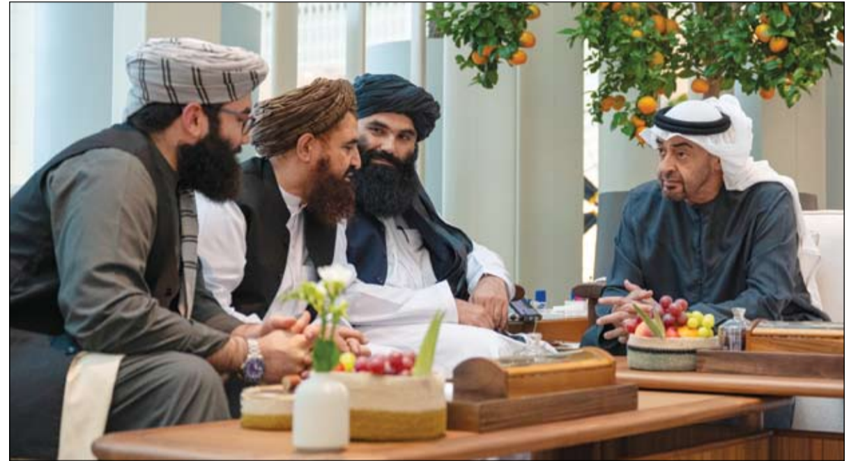
رئيس الدولة خلال استقباله الوفد الأفغاني برئاسة وزير الداخلية (وام)

أنجزت مؤسسة زايد العليا لأصحاب الهمم، بالتعاون مع مدينة الإمارات الإنسانية، المرحلة الثانية من تقديم الرعاية والتأهيل لأصحاب الهمم والمصابين الفلسطينيين الذين تم نقلهم إلى دولة الإمارات لتلقي العلاج والرعاية، تنفيذاً لتوجيهات صاحب السمو الشيخ محمد بن زايد آل نهيان رئيس الدولة حفظه الله، بعلاج 1000 طفل فلسطيني من الجرحى و1000 من المصابين بأمراض السرطان من قطاع غزة في مستشفيات الدولة. وتشمل الخدمات التي نفذتها المؤسسة، تقديم الرعاية والتأهيل وجلسات التقييم والجلسات العلاجية المتنوعة.