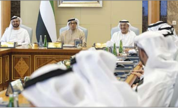
منصور بن زايد خلال ترؤسه اجتماع المجلس الوزاري للتنمية (وام)