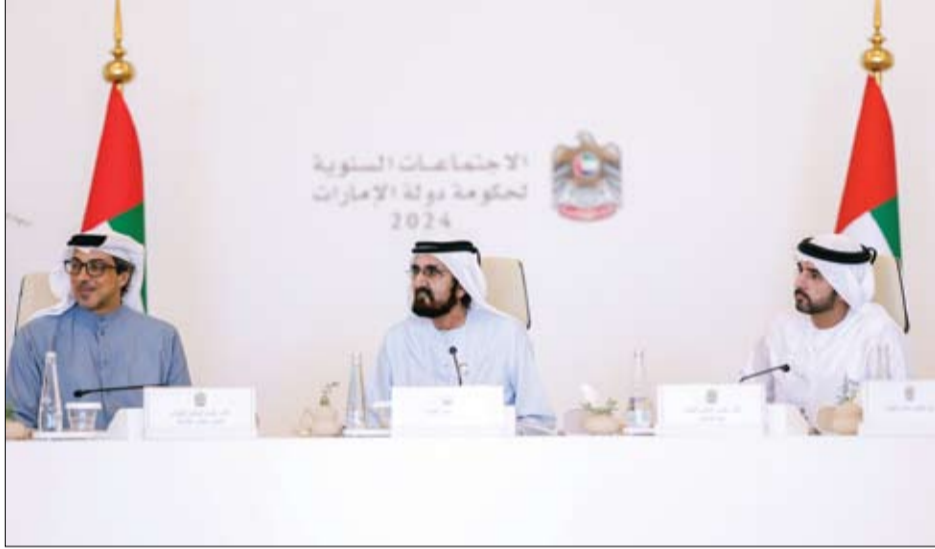
محمد بن راشد خلال ترؤسه الاجتماعات السنوية للحكومة بحضور منصور بن زايد وحمدان بن محمد (وام)

الإمارات تخطط لاستثمار 200 مليار درهم لتلبية الطلب المتنام على الطاقة في السنوات الست المقبلة .. أبو ظبي- وام: قال معالي سهيل بن محمد فرج فارس المزروعى، وزير الطاقة والبنية التحتية إن دولة الإمارات تخطط لاستثمار ما يصل إلى 200 مليار درهم لتلبية الطلب المتنام على الطاقة في السنوات الست المقبلة بهدف إزالة الكربون من اقتصادنا والوصول إلى صافي انبعاثات صفرية بحلول عام 2050. وأضاف معاليه في تصريحات معرّض ومؤتمر أبو ظبي الدولي للبتترول أديبيك 2024 أن جهودنا في تنوع مزيج الطاقة وزيادة الاعتماد على مصادر الطاقة النظيفة تتماشى جنباً إلى جنب مع جهودنا الرامية إلى خفض كثافة الكربون في عمليات النفط والغاز لدينا بنسبة 25٪ إضافية على مدى العقد المقبل. (التفاصيل ص 7)