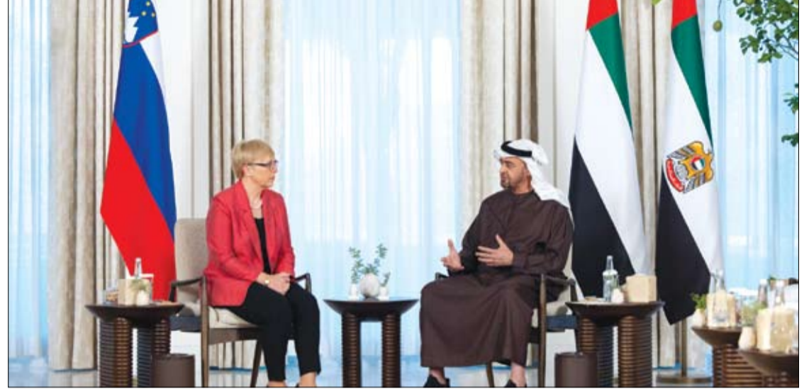
رئيس الدولة خلال استقباله رئيسة جمهورية سلوفينيا (وام)

.. أبو ظبي- وام: الدولة نائب رئيس مجلس الوزراء رئيس ديوان الرئاسة، وسمو الشيخ حمدان بن محمد بن راشد آل مكتوم، ولي عهد دبي نائب رئيس مجلس الوزراء وزير الدفاع، وسمو الشيخ مكتوم بن محمد بن راشد آل مكتوم، النائب الأول لحاكم دبي نائب رئيس مجلس الوزراء وزير المالية، والفريق سمو الشيخ سيف بن زايد آل نهيان، نائب رئيس مجلس الوزراء وزير الداخلية. (التفاصيل ص 3-5)