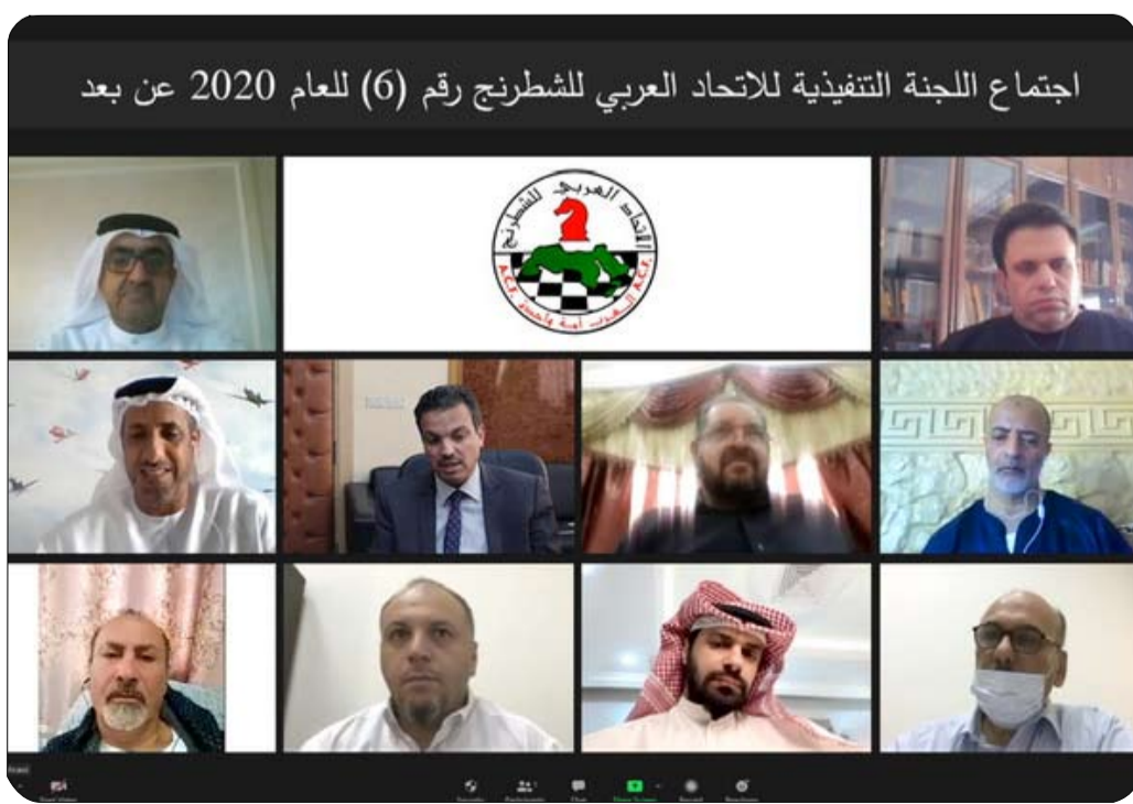
اجتماع اللجنة التنفيذية للاتحاد العربي للشطرنج رقم (6) لعام 2020 عن بعد

الاجتماع على الألقاب الدولية - واطلمت اللجنة التنفيذية على مخاطبات رئيس الاتحاد العربي