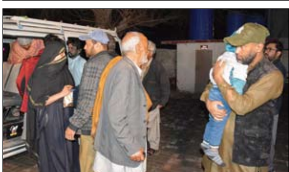
ركاب أنقذوا من القطار بعد تعرضه لهجوم من مسلحين

قال الجيش الباكستاني إن قوات الأمن اقتحمت أمس الأربعة قطارا خطفه مسلحون انفصاليون واحتجزوا فيه رهائن في مواجهة استمرت يوما كاملا وانتهت بمقتل جميع الخاطفين وعددهم 33. وقال مصدر أمني إن مسلحين انفصاليين من إقليم بلوشستان فجروا أمس الثلاثاء خطا للسكة الحديد وألقوا صواريخ على قطار جعفر اكسبريس بينما كان