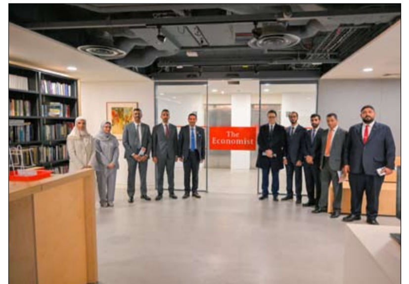
ضمن جولته البحثية في العاصمة البريطانية