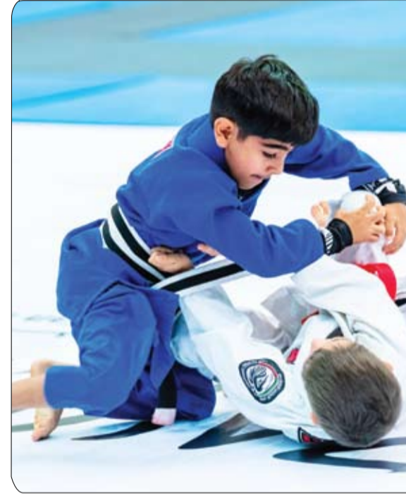
ضمن تحدي حفيت الرياضي محطة مهمة في سلسلة بطولات