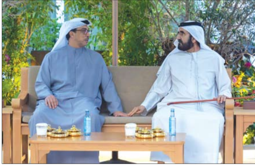
محمد بن راشد خلال استقباله منصور بن زايد

رحبت دولة الإمارات بتوقيع الاتفاق الذي يهدف إلى دمج جميع المؤسسات المدنية والعسكرية في شمال شرق سوريا ضمن إدارة الدولة السورية، معربة عن أملها في أن يحقق الاتفاق الاستقرار والسلام في المنطقة، ويعزز من جهود تحقيق الوحدة الوطنية والتعايش في سوريا. وجددت وزارة الخارجية في بيان لها التأكيد على موقف دولة الإمارات الثابت تجاه دعم استقرار سوريا وسيادتها على كامل أراضيها ووقوفها إلى جانب الشعب السوري الشقيق، ودعمها المساعي كافة التي تهدف إلى تحقيق تطلعاتها إلى الأمن والسلام والتعايش والاستقرار والحياة الكريمة.