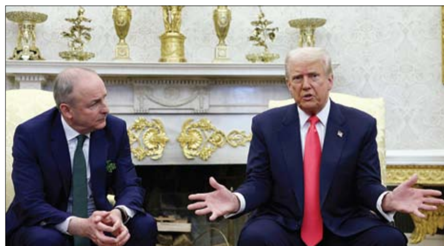
الرئيس الأمريكي يتحدث للصحفيين خلال اجتماع مع رئيس الوزراء الأيرلندي في البيت الأبيض. (رويترز)

إلى ذلك، صرح وزير الخارجية الروسي سيرغي لافروف، أمس، أن الوفد الأمريكي خلال المفاوضات مع الجانب الروسي في العاصمة السعودية الرياض، أكد أن الولايات المتحدة ترغب بعلاقات طبيعية مع روسيا ومستعدة لمفاوضات جادة، معتبرا أن وجود قوات الناتو تحت أي صفة على أراضي أوكرانيا يشكل تهديدا لروسيا. وأشار لافروف إلى أن الأمريكيين في الوقت نفسه يفهمون أن الدول الأخرى لديها مصالحها الوطنية الخاصة، وهم مستعدون لإجراء مفاوضات جادة مع هذه الدول التي لديها مصالحها الوطنية الخاصة ولا تريد أن تحذو حذو الآخرين.