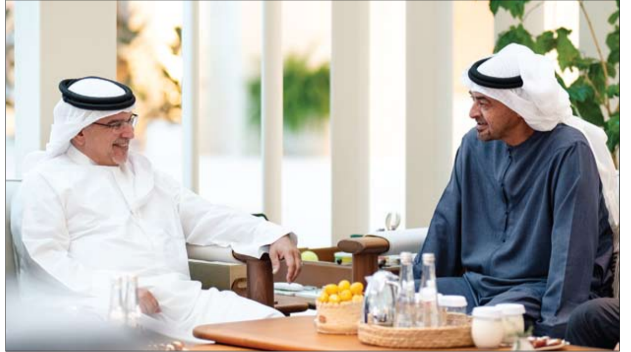
رئيس الدولة خلال استقباله ولي عهد البحرين (وام)

استقبل صاحب السمو الشيخ محمد بن راشد آل مكتوم نائب رئيس الدولة رئيس مجلس الوزراء حاكم دبي "رعاه الله"، أمس سمو الشيخ منصور بن زايد آل نهيان، نائب رئيس الدولة، نائب رئيس مجلس الوزراء، رئيس ديوان الرئاسة، وذلك في استراحة سموه في المرموم بدبي. وتوجه سموهما بالدعاء إلى الله العليّ القدير أن يعيد