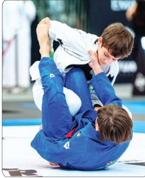
على أهمية ممارسة الرياضة خلال الشهر الفضيل وتعزيز قيم