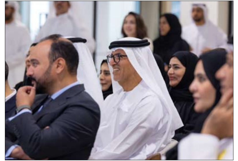
بمشاركة واسعة من أفراد المجتمع