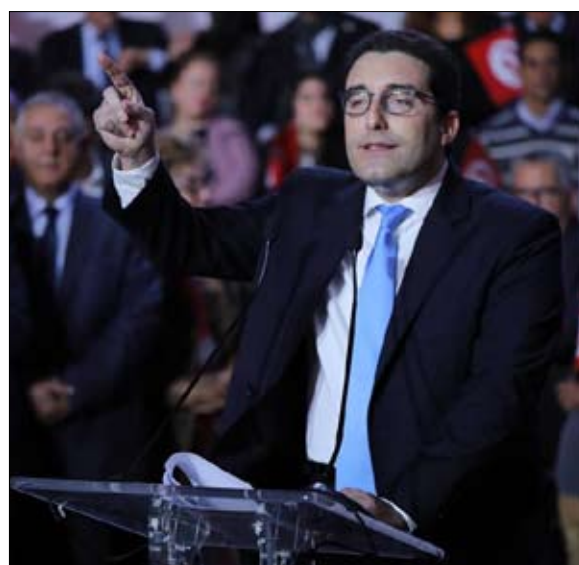
تحيا تونس... المطلوب مصلحة البلاد

أعلنت حركة شباب تونس الوطني أمس الاثنين، عن "انسحابها كليا من دعم المترشح للرئاسة قيس سعيد في الدورة الثانية وذلك على ضوء النتائج الأولية للانتخابات التشريعية.. واتهمت الحركة في بيان صادر عنها قيس سعيد بـ "التسبب في ضرب مصداقية الحركة التي كانت لحملة تشكيل" كما قبل الدور الأول وتسبب في غلق صفحاتها وتعرضها لحملة تشكيك " كما اتهمته أيضا بـ "التنكر لدور الشباب المطوع الذي عمل طيلة 8 أشهر من أجل نجاح حملته الرئاسية.. ودعت الحركة "أعضاء سعيد إلى ان يتحولوا إلى أعدائه " وحثت ما أسمته بـ "الجيش الأحمر الإلكتروني إلى فضح قيس سعيد وقلب الموازين وخوض حرب الدور الثاني.. وحركة شباب تونس يقودها الأمنى العزول ثامر بديدة، وتقدم نفسها كمساند لقيس سعيد وسبب نجاحه في السباق الرئاسي بما اعتبره متابعون للشأن السياسي ومقربون من سعيد، توظيفا فجا وركوبا على الحدث ومحاولة لاستئثار شعبيته للفوز بمقاعد في البرلمان.. وكانت الحركة قد اتهمت ائتلاف الكرامة بالركوب على مجوهدوا في الحملة الانتخابية للمترشح قيس سعيد.