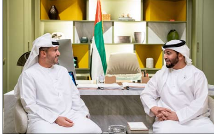
ويخطوات مدروسة تعزز مكانتها العالمية الرائدة من خلال المضي قدما في إنجاز المشروع النووي السلمي وفق أعلى معايير السلامة والجودة والشفافية الأمر الذي جعل من هذا المشروع نموذجا يحتذى به من قبل كافة المشاريع النووية السلمية على

وقال سموه إن توجيهات القيادة الرشيدة بالتركيز على تطوير الكادر البشري الإماراتي قد حققت نتائجها المرجوة عبر إشراك الكوادر الإماراتية الشابة المؤهلة في إدارة العديد من