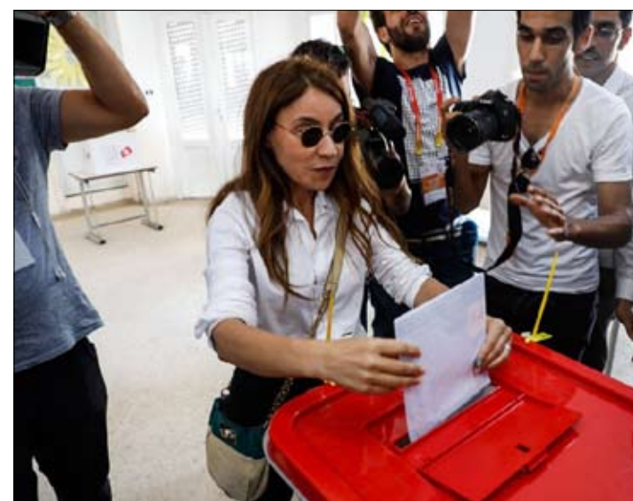
قلب تونس يرفض التحالف مع النهضة

أعلن التيار الديمقراطي يختار المعارضة ويقترح حكومة إنقاذ وطني غير متحزبة