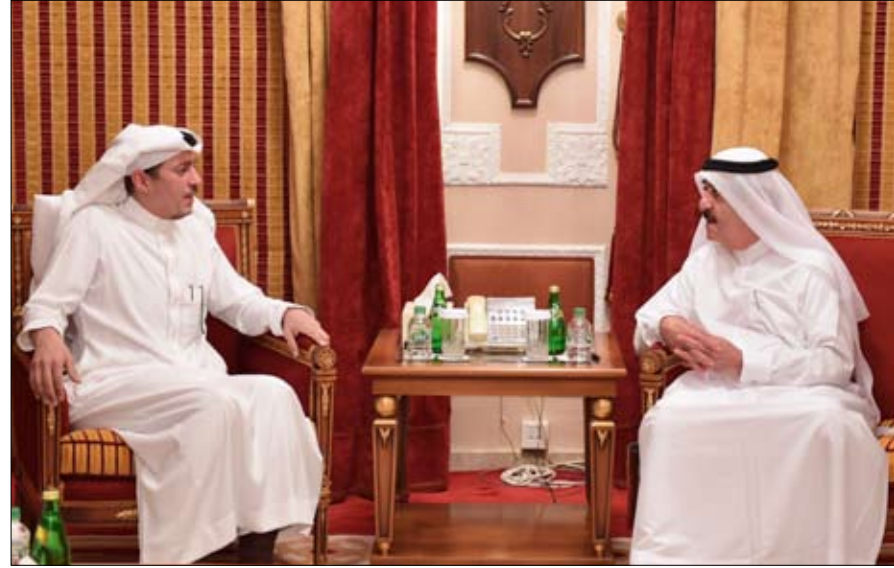
فيه مصلحة الشعبين وسعيًا نحو بين البلدين. ونقل سعادة السفير السعودي تعميق أواصر العلاقات الأخوية الملك سلمان بن عبد العزيز

ورحب صاحب السمو حاكم أم القيوين بالسفير السعودي.. متمنيا له التوفيق والنجاح في أداء مهام عمله، بما يعزز علاقات التعاون بين دولة الإمارات العربية المتحدة والمملكة العربية السعودية الشقيقة والعمل على تطويرها