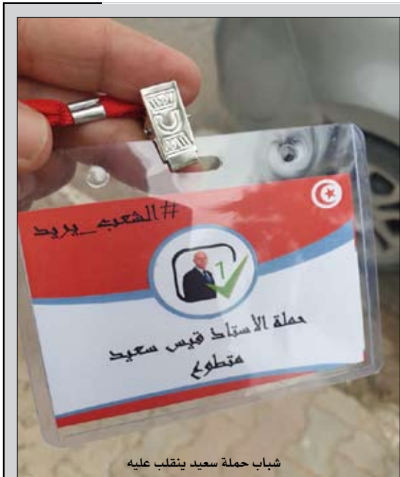
شباب حملة سعيد ينقلب عليه