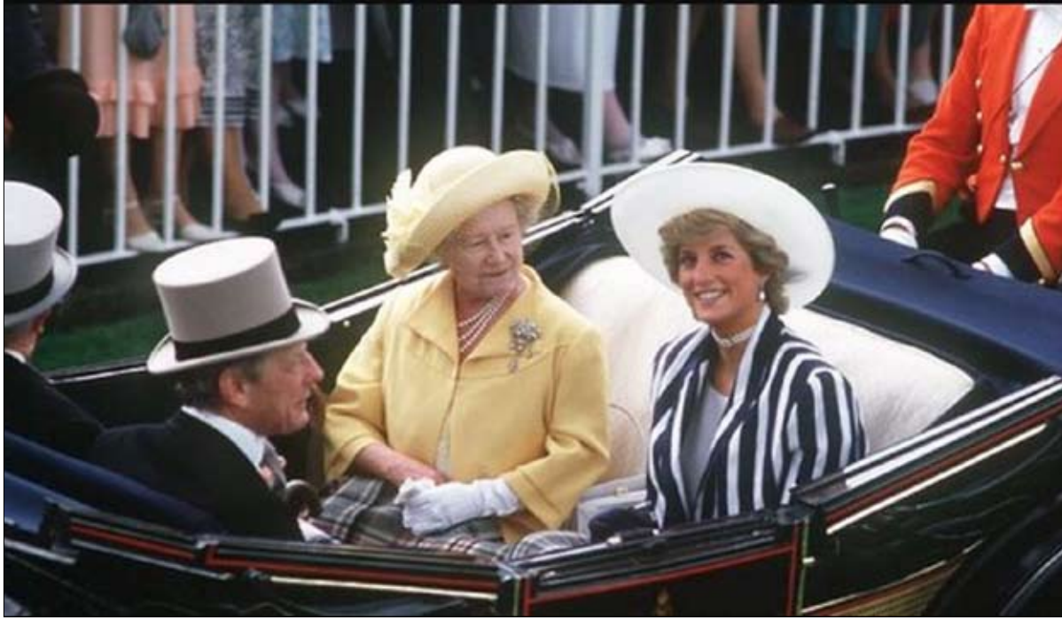
حتى لا يعيد التاريخ نفسه