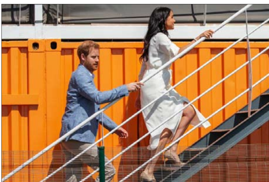
هل هو الصعود إلى الهاوية

هل هذا يعني أن هاري يقلد تكتيك ترامب، الذي يهاجم بلا كلل الأخبار الزائفة؟ رغم أن هذه الخطوة هي نقطة بداية لحرب مفتوحة ضد الصحافة، إلا أنها ستكون مختلفة تماماً عن تلك التي يخوضها ترامب ضد وسائل الإعلام. الصحف البريطانية لديها معايير وممارسات صحفية مختلفة للغاية. والمرجح ألا يتم استهداف الصحف