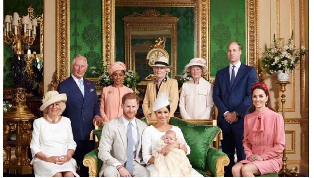
الأسرة المالكة في مواجهة الصحافة