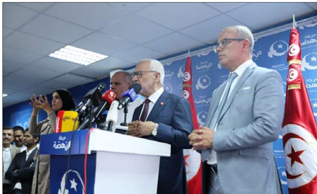
النهضة تحتاج إلى شركاء

كما ان فرضية إمكانية إعادة الانتخابات التشريعية في صورة عدم التوصل إلى تشكيل حكومة في الأجل الدستورية بسبب التشتت الحاصل في البرلمان الجديد، قائمة، ولكن إعادة الانتخابات التشريعية لن تحدث تغييرا في المشهد ولن تحل الأزمة.