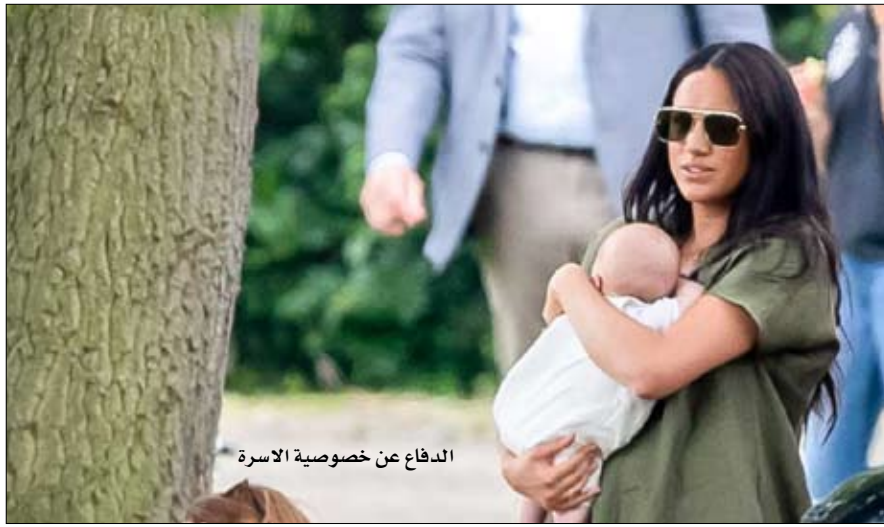
الدفاع عن خصوصية الأسرة