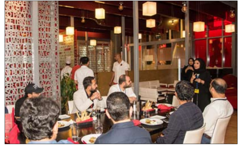
الشركاء يكتشفون أبو ظبي كما لم يرونها من قبل