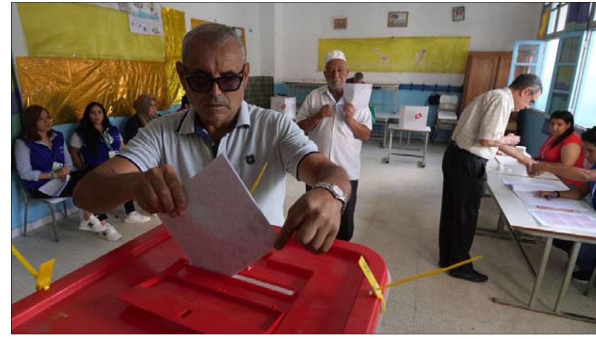
نسبة مشاركة ضعيفة

أعلنت حركة شباب تونس الوطني أمس الاثنين، عن "انسحابها كليا من دعم المترشح للرئاسة قيس سعيد في الدورة الثانية وذلك على ضوء النتائج الأولية للانتخابات التشريعية.. واتهمت الحركة في بيان صادر عنها قيس سعيد بـ "التسبب في ضرب مصداقية الحركة التي كانت لحملة تشكيل" كما قبل الدور الأول وتسبب في غلق صفحاتها وتعرضها لحملة تشكيك " كما اتهمته أيضا بـ "التنكر لدور الشباب المطوع الذي عمل طيلة 8 أشهر من أجل نجاح حملته الرئاسية.. ودعت الحركة "أعضاء سعيد إلى ان يتحولوا إلى أعدائه " وحثت ما أسمته بـ "الجيش الأحمر الإلكتروني إلى فضح قيس سعيد وقلب الموازين وخوض حرب الدور الثاني.. وحركة شباب تونس يقودها الأمنى العزول ثامر بديدة، وتقدم نفسها كمساند لقيس سعيد وسبب نجاحه في السباق الرئاسي بما اعتبره متابعون للشأن السياسي ومقربون من سعيد، توظيفا فجا وركوبا على الحدث ومحاولة لاستئثار شعبيته للفوز بمقاعد في البرلمان.. وكانت الحركة قد اتهمت ائتلاف الكرامة بالركوب على مجوهدوا في الحملة الانتخابية للمترشح قيس سعيد.