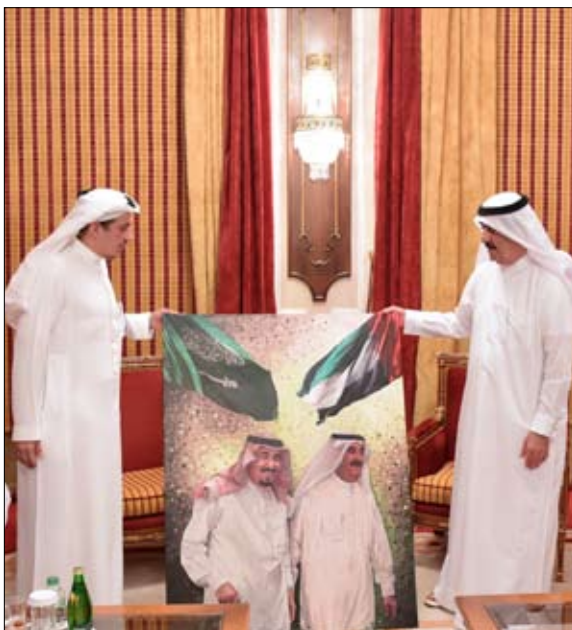
بن سعود بن راشد المعلا نائب رئيس المجلس التنفيذي لإمارة أم القيوين والشيخ عبدالله بن سعود بن راشد المعلا رئيس دائرة المالية وسعادة ناصر سعيد التلاي مدير الديوان الأميري وسعادة راشد محمد أحمد مدير الشريفيات بالديوان الأميري.

آل سعود ملك المملكة العربية السعودية وصاحب السمو الملكي الأمير محمد بن سلمان بن عبد العزيز آل سعود ولي العهد نائب رئيس مجلس الوزراء وزير الدفاع السعودي إلى صاحب السمو حاكم أم القيوين. كما حمل صاحب السمو حاكم أم القيوين السفير السعودي تحياته إلى خادم الحرمين الشريفين وصاحب السمو الملكي الأمير محمد بن سلمان.. متمنيا لهما دوام الصحة والعافية وللشعب السعودي التقدم والازدهار. كما جرى خلال اللقاء استعراض العلاقات الأخوية المتينة بين البلدين وسبل تعزيز التعاون البناء على المستويات كافة بما يحقق طموحات الشعبين