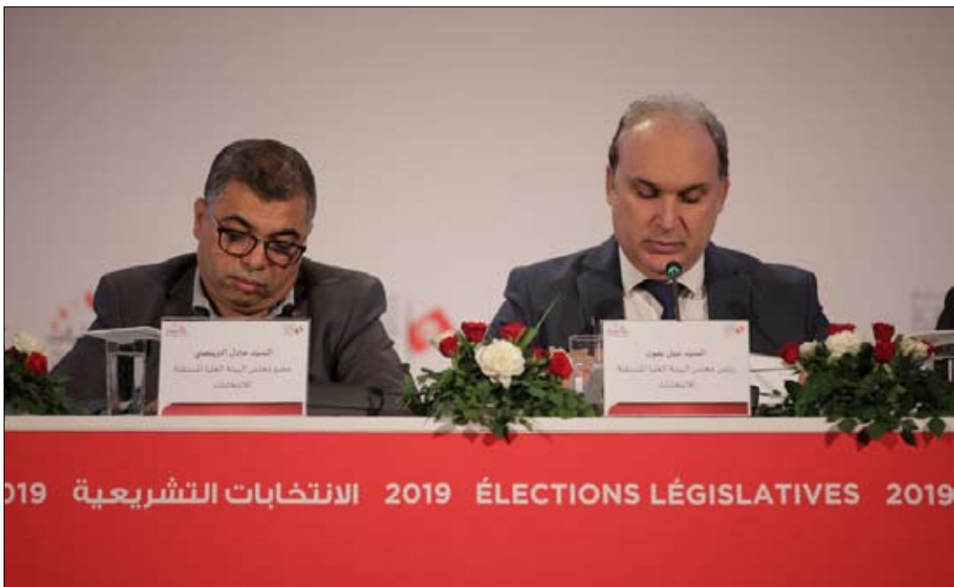
النتائج الرسمية في التاسع من أكتوبر الجاري

لقد أعلنت شركة سيفيغا كونساي مساء الأحد، أن النتائج التقديرية للانتخابات التشريعية قدمت حركة النهضة في المرتبة الأولى بنسبة 17 فاصل 5 بالمئة، تليها حزب قلب تونس بـ 15 فاصل 6 بالمئة، فيما كادت الأحزاب الجداوية والتقدمية أن تتلاشى.