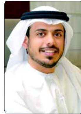
•• العين - الفجر

دائرة الثقافة والسياحة بأبوظبي وهيئة أبوظبي للسياحة ومجموعة الصحراء والدار العقارية ومؤسسة الإمارات للمواصلات. ونقل العميد ثاني المطروشي ممثل شرطة أبوظبي تحيات وتقدير اللواء طيار فارس المزروعى قائد عام شرطة أبوظبي للحضور مؤكداً ان شرطة أبوظبي كانت ولا زالت تدعم مختلف الاحداث رياضية كانت ام غيرها انطلاقاً من توجيهات قيادتنا الرشيدة وترجمة لواجبنا المجتمعي. وأضاف: "من واقع تجاربنا السابقة خاصة مع نادي العين لدينا ثقة كاملة على قدرة كوادرنا الوطنية على إنجاح البطولة مجدداً الشكر للجميع وتمنينا للمشاركين التوفيق".