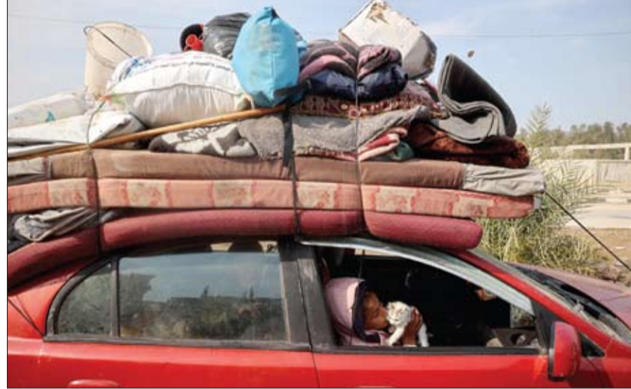
طفلة فلسطينية نازحة تلعب مع قطعتها وهي سعيدة بعودتها إلى شمال غزة.

قال القيادي في حركة حماس، سامي أبو زهري إن الوسطاء بدأوا عملية جسس النضج للطرفين للبدء في المرحلة الثانية من اتفاق غزة. وأكد أبو زهري أن مستقبل القطاع شأن فلسطيني بحث ولا خيار أمام رئيس الوزراء الإسرائيلي بنيامين نتنياهو إلا المضي في هذا الاتفاق حتى النهاية، وأوضح القيادي في حركة حماس أن القطاع لا يعاني فراغاً إدارياً، بل يرحبون بتشكيل حكومة يتوافق عليها الفلسطينيون. هذا وأجبرت القوات الإسرائيلية،