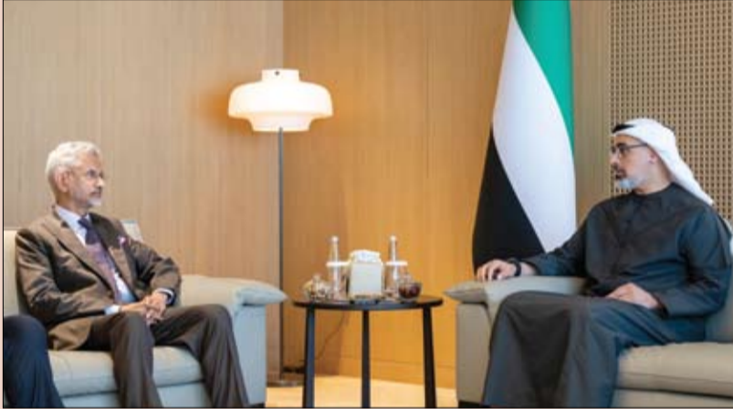
ولي عهد أبوظبي خلال لقائه وزير الشؤون الخارجية في الهند

التقى سمو الشيخ خالد بن محمد بن زايد آل نهيان ولي عهد أبوظبي رئيس المجلس التنفيذي لإمارة أبوظبي، أمس، معالي الدكتور سوبرامانيام جايشانكار وزير الشؤون الخارجية في جمهورية الهند. وأثناء اللقاء، بحثت العلاقات الصداقة التي تربط بين البلدين والشعبين الصديقين. من جهة أخرى التقى سمو الشيخ خالد بن محمد بن زايد آل نهيان، ولي عهد أبوظبي رئيس المجلس التنفيذي لإمارة أبوظبي، أمس، أندرو جاسي، الرئيس والمدير التنفيذي لشركة أمازون.