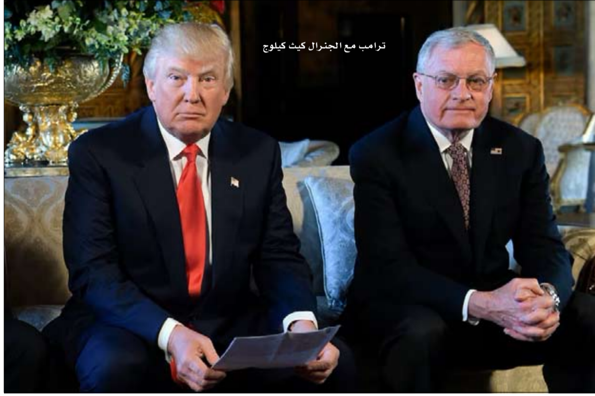
ترامب مع الجنرال كيث كيلوج