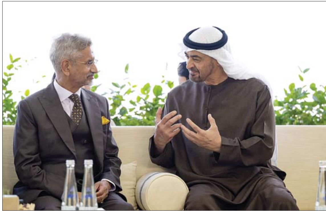
رئيس الدولة خلال استقباله وزير الشؤون الخارجية الهندي (وام)