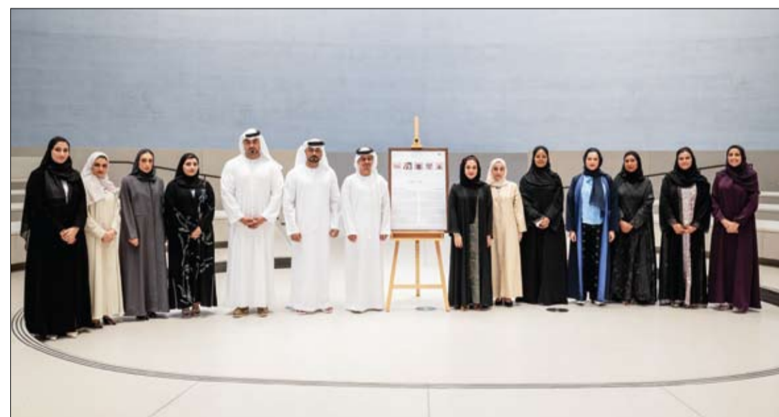
ورقة بريدية، وتضم كل ورقة خمسة طوابع بريدية خاصة الأجيال القادمة، وشمل الإصدار المحدود 15 ألف

بمتحف زايد الوطني تستعرض قطعاً أثرية ذات أهمية تاريخية وصوراً أرضيفية توثق قصة دولة الإمارات العربية المتحدة من أبرزها صورة يقفون للشيخ زايد التقطها المصور الصحفي الفرنسي الشهير جاك بورلو عام 1974، وخنجر يرمز إلى الهوية الإماراتية والتقاليد. وترتكز الطوابع التذكارية أيضاً على مجموعة من القطع الأثرية تضم كوباً منقوشاً عليه شكل الفلج اكتُشف في مدفن هيلي بمنطقة العين، وطبلة (قلادة) تعود إلى ثلاثينيات القرن العشرين ومبخرة من الخزف عشر عليها في موقع بدع بنت سعود الأثرية. وتجسد هذه القطع الأثرية معاً آلاف السنين من التاريخ