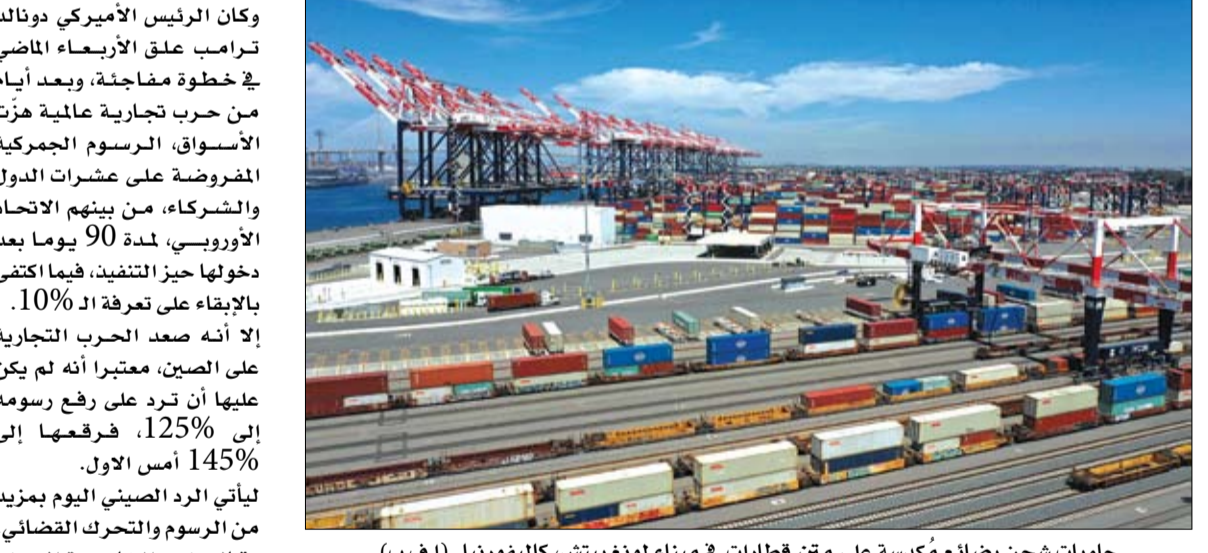
حاويات شحن بضائع مكدسة على متن قطارات في ميناء لونغ بيتش، كاليفورنيا.

قالت بكين الجمعة إن قرار دونالد ترامب تعليق الرسوم الجمركية على سائر الدول جاء جزئياً بعد سقوط من الصين عقب إعلان جولة أخيرة من التعريفات على البضائع الأميركية.