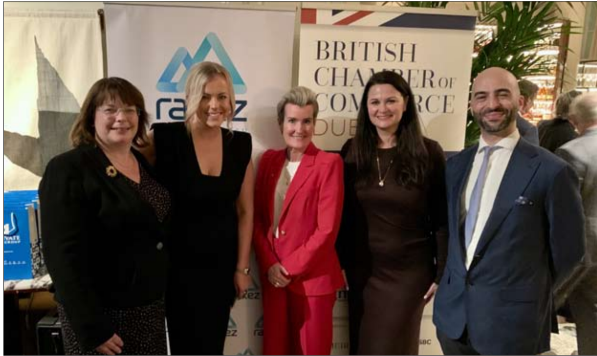
جانب شركات صناعية أخرى روابط فعالة وتيسيل الضوء على المزايا التنافسية لممارسة الأعمال في إمارة رأس الخيمة من قبل مانشستر بيرير ياجز، وجهه آر إل للتصنيع، ومن خلال بناء

لغرفة منذ عام 2016، ومع تزايد اهتمام أعضائنا بإمكانات العالمية، وأضاف جلاد: «مثل هذه الضعاليات تمثل منصة مثالية لتعزيز الحوار وبناء علاقات مثمرة تفتح آفاقاً جديدة للشركاء». وتواصل راكمز، من خلال مشاركتها الفعالة في مثل هذه الفعاليات الدولية التي تنظمها غرفة التجارة البريطانية في المملكة المتحدة، ترسيخ مكانتها كشريك استراتيجي في مسيرة توسع الأعمال الدولية وتعزيز التعاون الاقتصادي عبر الحدود. وتضم المنطقة الاقتصادية خبة من الشركات البريطانية البارزة من مختلف القطاعات، مثل شاي أحمد الرائدة في إنتاج الشاي، وإيه توسي الرائدة في إعادة تصنيع أجهزة الحاسب الآلي المحمولة، وسيشال كومبوسايت المتخصصة في تصنيع معدات التدريب على الطيران، إلى