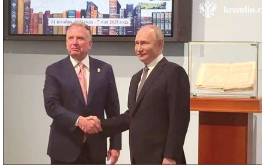
بوتين يصافح مبعوث الرئيس الأمريكي ستيف ويتكوف، خلال اجتماع في سانت بطرسبرغ.

اعتبر الرئيس الأمريكي دونالد ترامب الجمعة أن الحرب في أوكرانيا عبثية، داعياً موسكو لأن تتحرك نحو إبرام تسوية، في موقف تزامن مع زيارة يقوم بها مبعوثه ستيف ويتكوف إلى روسيا حيث سيلتقي الرئيس فلاديمير بوتين. وكتب ترامب على منصفته تروث سوشال، على روسيا أن تتحرك، مشيراً إلى أن الحرب التي أطلقتها روسيا عبر غزو أراضي أوكرانيا مطلع العام 2022 عبثية وكان يجب ألا تقع. وقد وصل المبعوث الأمريكي ستيف ويتكوف الجمعة إلى روسيا حيث التقى مسؤولين معنيين بالشأن الاقتصادي، في ضوء التقارب الروسي الأمريكي والمحادثات الدبلوماسية لإنهاء الحرب بين موسكو وكيبف. وبدأ الجمعة في موسكو لقاء بين الرئيس الروسي فلاديمير بوتين وستيف ويتكوف ومبعوث دونالد