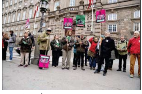
دنماركيون يحتجون على اعتماد قانون يسمح بقواعد أميركية في الدنمارك الأطلسي.

وأظهرت استطلاعات الرأي الأخيرة معارضة كبيرة بين الدنمركيين للاتفاقية التي تسري لعشر سنوات والتي، في حال التصديق عليها، ستمنح الجيش الأمريكي قدرة كبيرة على تمركز القوات وتخزين المعدات على الأراضي الدنمركية. وأدى إصرار الرئيس الأمريكي دونالد ترامب على أن تتولى الولايات المتحدة السيطرة على جرينلاند، وهي منطقة دنمركية تتمتع بحكم ذاتي، لأسباب أمنية، إلى توتر العلاقات بين الحليفين المضربين تقليدياً في حلف شمال