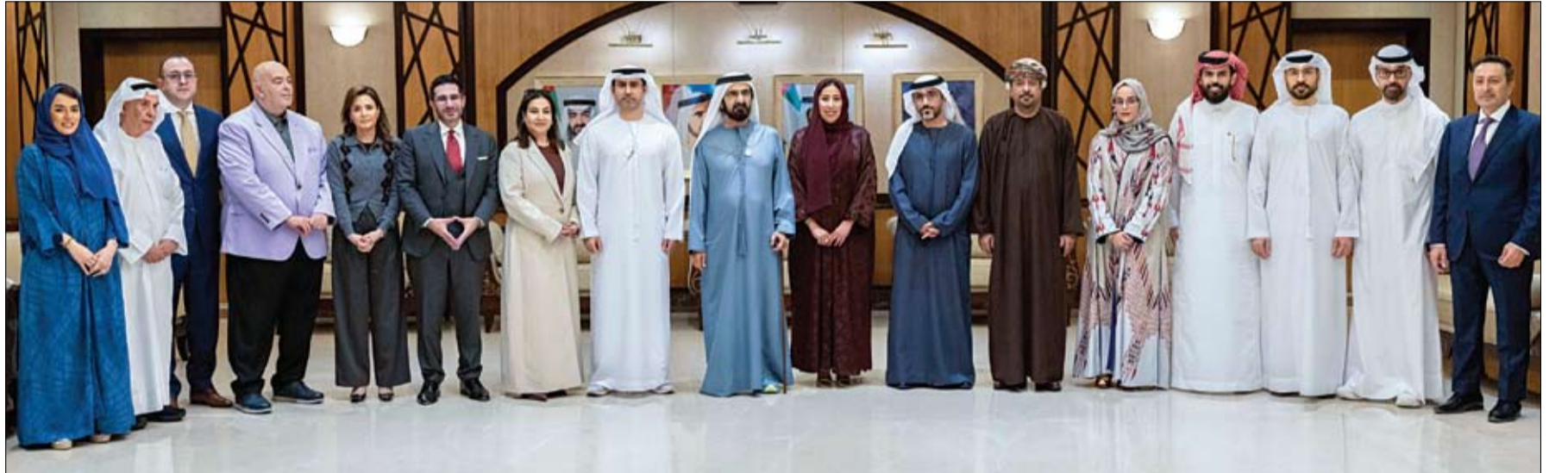
محمد بن راشد خلال لقائه أعضاء مجلس إدارة جائزة الإعلام العربي خلال انعقاد أول اجتماع للمجلس

نظم مجلس شباب "تريندز" للبحث العلمي، على هامش مشاركة المركز في معرض القاهرة الدولي للكتاب 2025، حلقة نقاشية مع معالي الدكتور أشرف صبحي، وزير الشباب والرياضة المصري، تناولت أهمية تمكين الشباب والارتقاء بقدراتهم وتنمية مهاراتهم في المجالات البحثية والعلمية والمعرفية، فضلاً عن تحصينهم فكرياً من الأفكار الهدامة والغلوطة. وتطرقت الحلقة إلى أهمية توفير برامج تدريبية وتطويرية للشباب في مجالات القيادة والبحث العلمي، إلى جانب تحسين سبل التواصل بين الشباب في القطاع العام والخاص، والتعاون بين الجهات المعنية لخلق بيئة تواصل فعال تشجع على المبادرة والابتكار. (التفاصيل ص3)