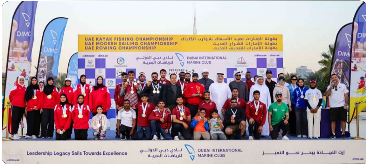
نظمه (دبي البحري) بمشاركة 6 أندية

والتعاقد مع جالينو ودامس، بات الأهلي يمتلك 12 لاعبا أجنبيا، هم السنغالي إدوارد ميندي، التركي مريخ ديميرال، البرازيليون روجير إيانيز، وروبرتو فيرمينو، ألكسندر غوميز، الإيفواري فرانك كيسي، الجزائري رياض محرز، الإسباني غابري فيغا، الإنجليزي إيفان توني، والمقدوني إزجان أليوسكي.