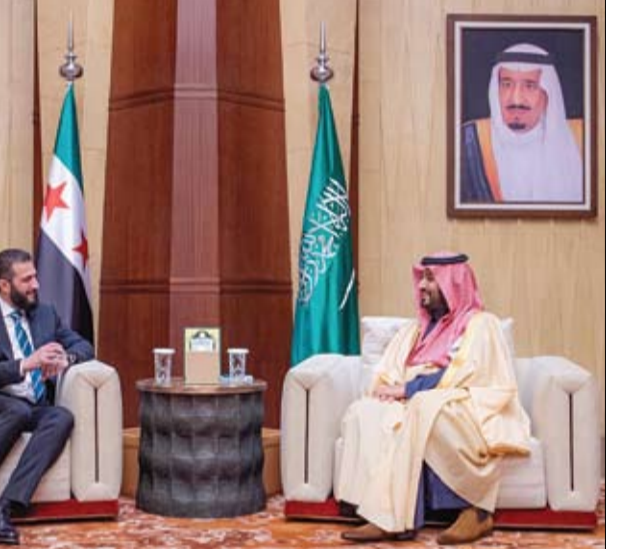
ولي العهد السعودي خلال استقباله الرئيس السوري

استقبل صاحب السمو الملكي الأمير محمد بن سلمان بن عبدالعزيز آل سعود ولي العهد رئيس مجلس الوزراء في مكتبه بالرياض أمس فخامة الرئيس أحمد الشرع رئيس الجمهورية العربية السورية. وفي بداية الاستقبال عبر سمو ولي العهد عن التهنئة لخضامته بمناسبة توليه رئاسة الجمهورية العربية السورية، متمنياً له التوفيق والسداد في تحقيق آمال وطموحات الشعب السوري الشقيق. من جانبه أعرب فخامته عن شكره وتقديره لسمو ولي العهد على مشاعره الصادقة، وعلى مواقف الملكة تجاه الجمهورية العربية السورية والشعب السوري.