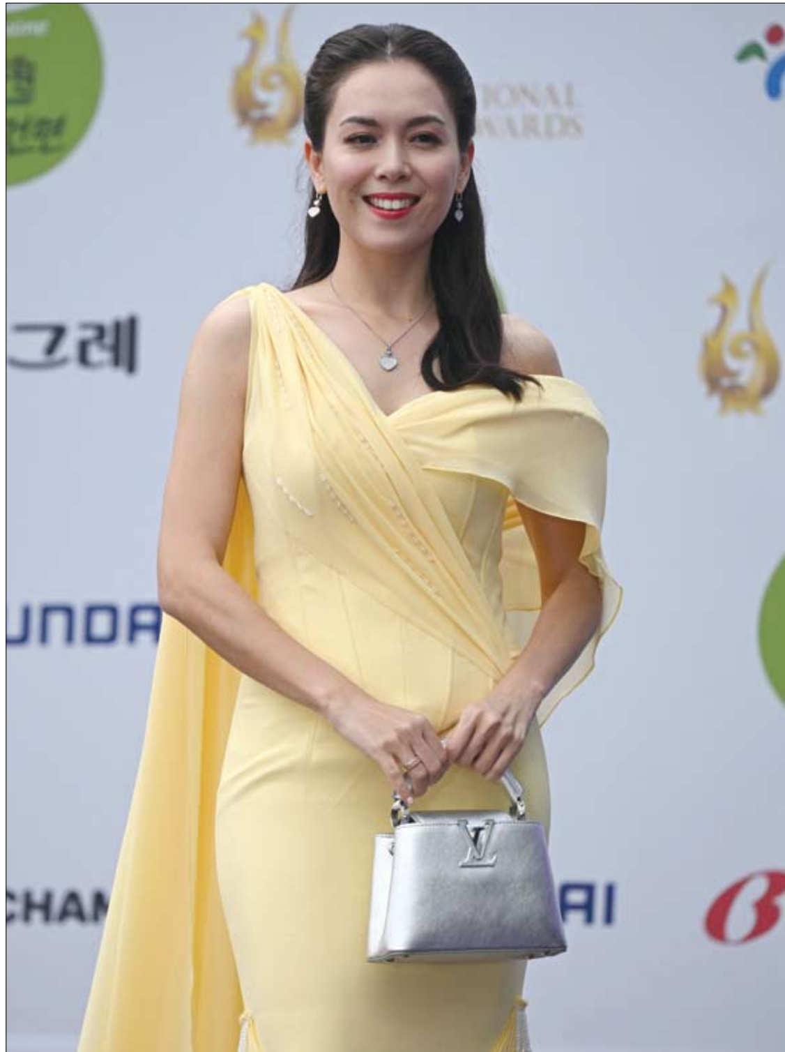
المثلة والعارضة الماليزية سبتي صالحه لدى وصولها إلى حفل توزيع جوائز سيول الدولية للدراما في سيول.

كما تم ربط صحة الأسنان السيئة بمشاكل صحية أخرى، بما في ذلك سرطان الفم وأنواع السرطان الأخرى، بالإضافة إلى أمراض القلب والأوعية الدموية والسكري.