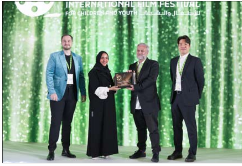
المهرجان يتوج الفائزين بجوائز مسابقتها