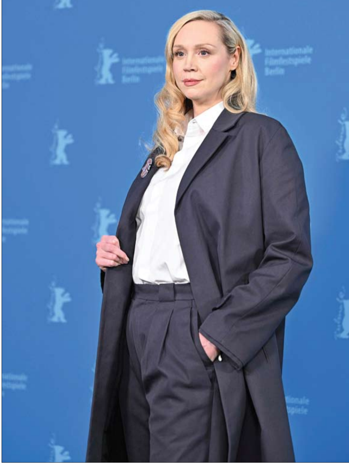
المثلة البريطانية جويندولين كريستي لدى حضورها جلسة تصوير لفيلم "بعد هذا الموت"، المعرض بهرجان برلين السينمائي الدولي.

والمثير للدهشة أن العلاج بالخلايا الجذعية يمكنه استعادة النشاط الطبيعي للدماغ حتى بعد شهر من السكتة الدماغية. ومع ذلك، هناك حاجة إلى مزيد من الأبحاث للإثبات أن تقليل فرط النشاط باستخدام الخلايا الجذعية سيؤدي في نهاية المطاف إلى تخفيف الأعراض لدى البشر.