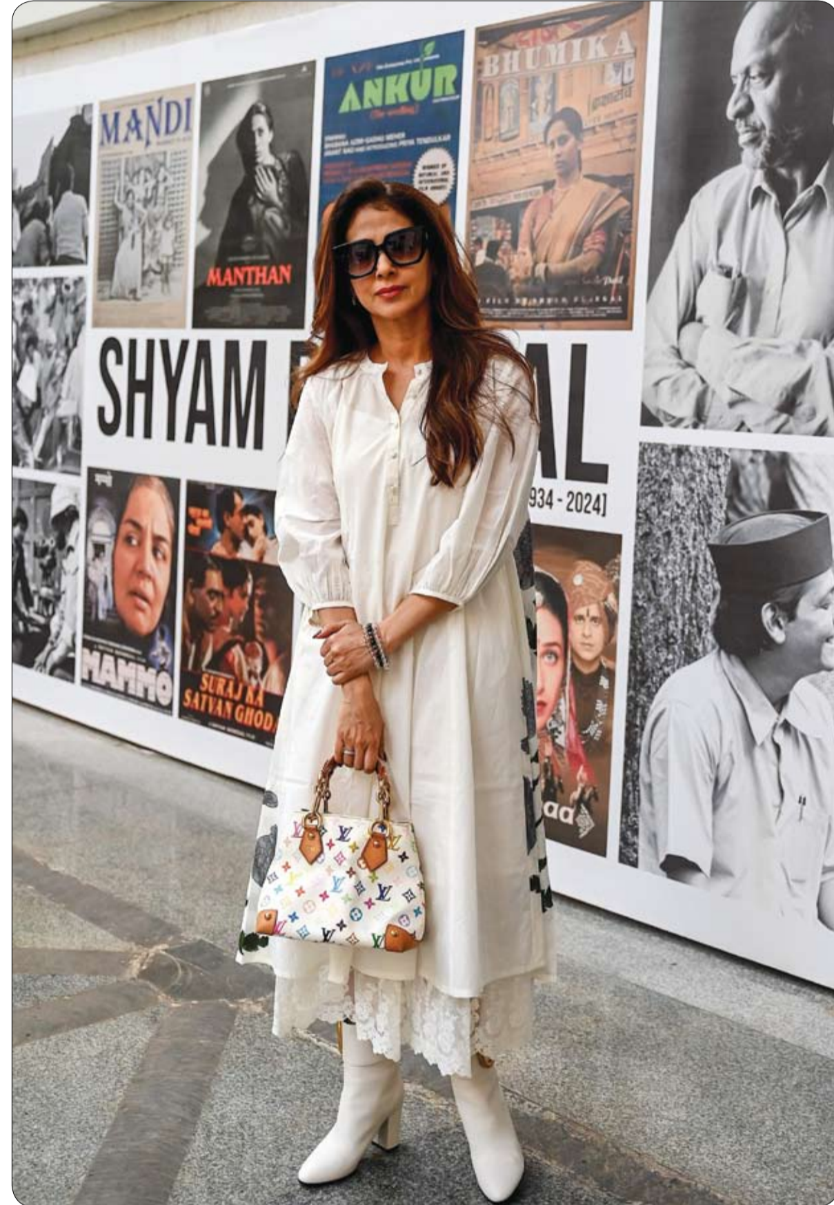
الممثلة الهندية أورميلا ماتوندكار لدى حضورها اجتماعاً للمخرج السينمائي وكاتب السيناريو الراحل شيام بينينجال في مومباي. (أ ف ب)

ووفقاً لعيادة كليفلاند، ينتشر هذا السرطان النادر عن طريق إفراز المخاط، وهو أحد مكونات المخاط، داخل بطن الشخص، مما يتسبب في امتلأته بمادة تشبه الهلام. ويعد السرطان، قتل للمرأة إن لديها "فرصة 0%" للحمل، وأثناء سعيها للحصول على أم بديلة، تلقت مفاجأة، وفق موقع "بيبول". وتقول لويز، وهي عارضة أزياء سابقة وموجهة رحلات في مطار جاتويك بلندن، إن الخلايا السرطانية انتشرت في جميع أنحاء جسدها، مما اضطرها إلى استئصال 8 من أعضائها: الزائدة الدودية، والمبيضين، والرحم، والطحال، والمرارة، وقناتي فالوب، والسررة، والفتق الكبير والصغير..