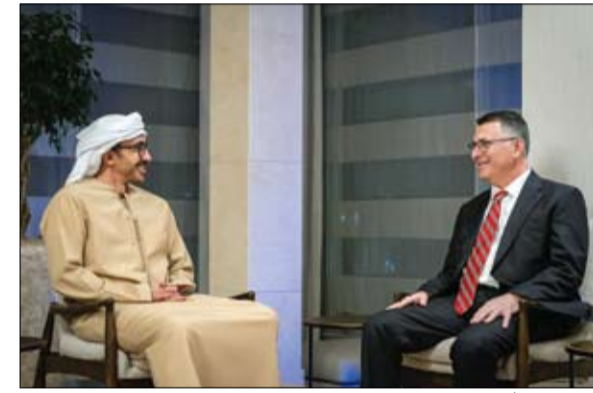
عبدالله بن زايد خلال استقبله وزير خارجية إسرائيل (وام)

وتحقيق الأمن المستدام في المنطقة وإنهاء العنف التصاعد الذي تشهده. وشدد سموه على أهمية العمل من أجل التوصل إلى وقف دائم لإطلاق النار وتجنب اتساع رقعة الصراع في المنطقة، مشيراً إلى أن الأولوية هي إنهاء التوتر والعنف وحماية أرواح المدنيين وببذل كافة الجهود لتسهيل تدفق المساعدات الإنسانية الملحة.