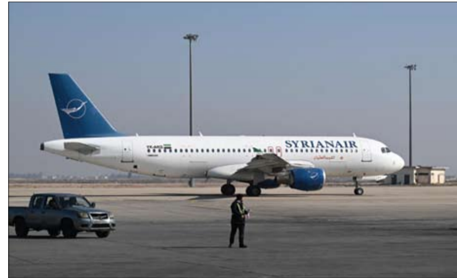
طائرة للخطوط الجوية السورية في مطار دمشق حيث استؤنفت الرحلات الجوية الدولية.