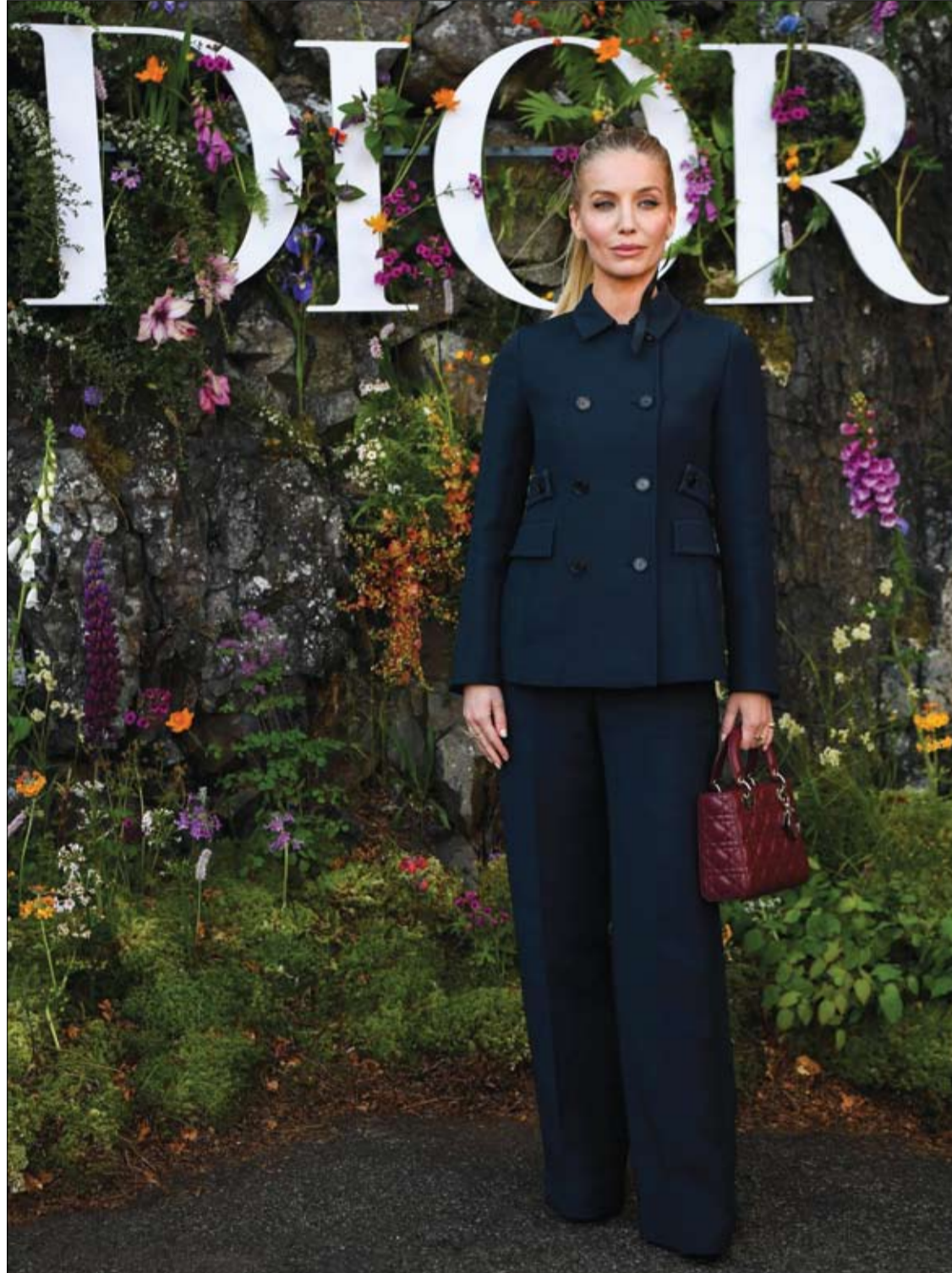
الممثلة البريطانية أنابيل واليس تقف خلال جلسة تصوير قبل عرض أزياء (Dior Croisiere) في قلعة دروموند، في اسكتلندا.

وينصح الأخصائي في حالة ظهور مثل هذه الأعراض استشارة طبيب العيون لتحديد السبب وإذا تطلب الأمر إجراء فحوصات ومن ثم وصف العلاج اللازم.