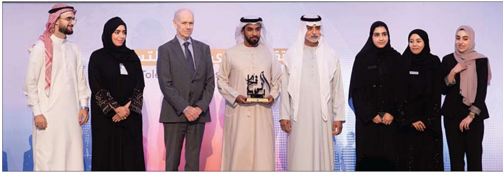
وسط حضور طلاب وأساتذة وإدارات الجامعات الإماراتية