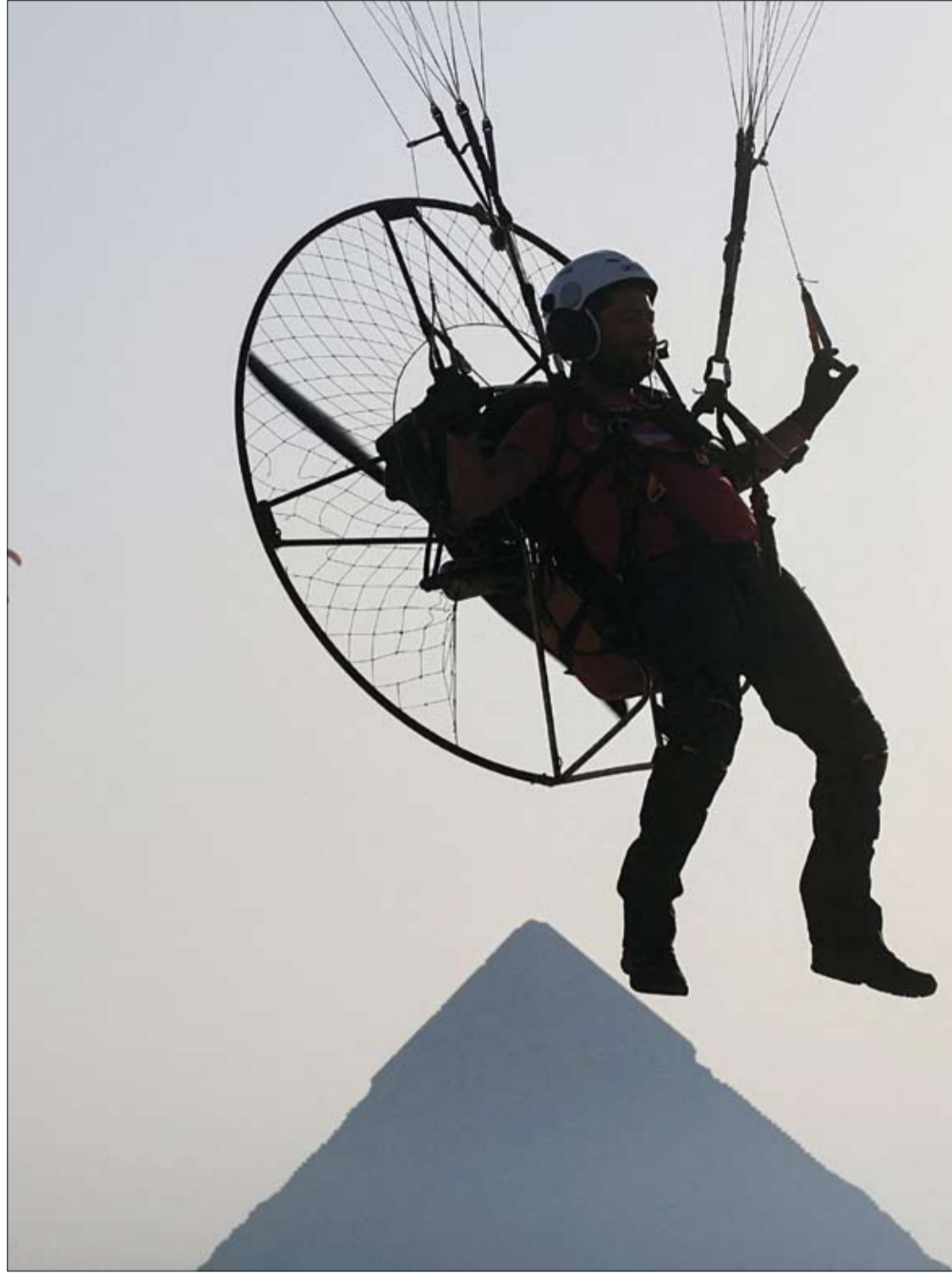
رجل يهبط على باراموتور بالقرب من الأهرامات، في الجيزة، على مشارف القاهرة.