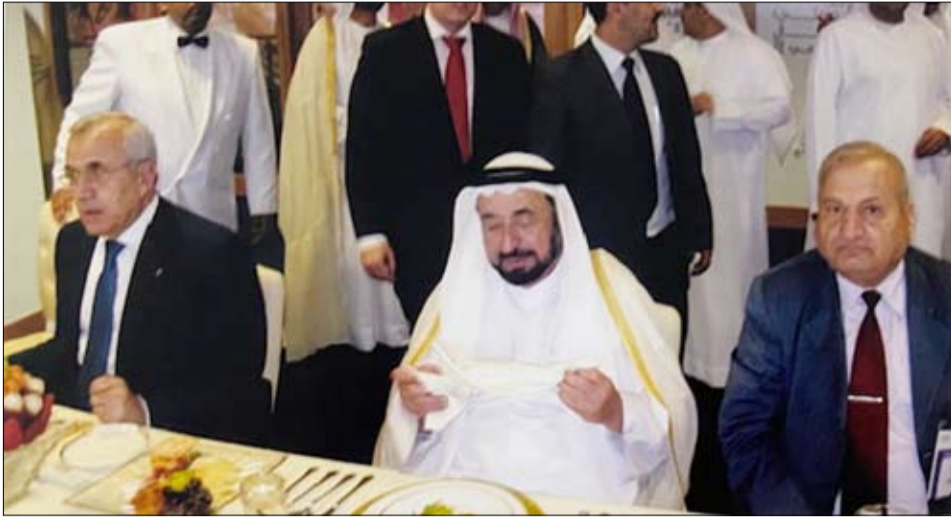
صاحب السمو الشيخ الدكتور سلطان بن محمد القاسمي يتوسط الرئيس ميشال سلمان، والزميل الدكتور محمود علياء في افتتاح المنتدى الإعلامي

تتوالى إصدارات صاحب السمو الشيخ الدكتور سلطان بن محمد القاسمي عضو المجلس الأعلى للاتحاد حاكم الشارقة عاماً بعد عام شاملة للأدب والتاريخ، والسياسة والاجتماع، والفلسفة والدين، والحياة والناس عامة.