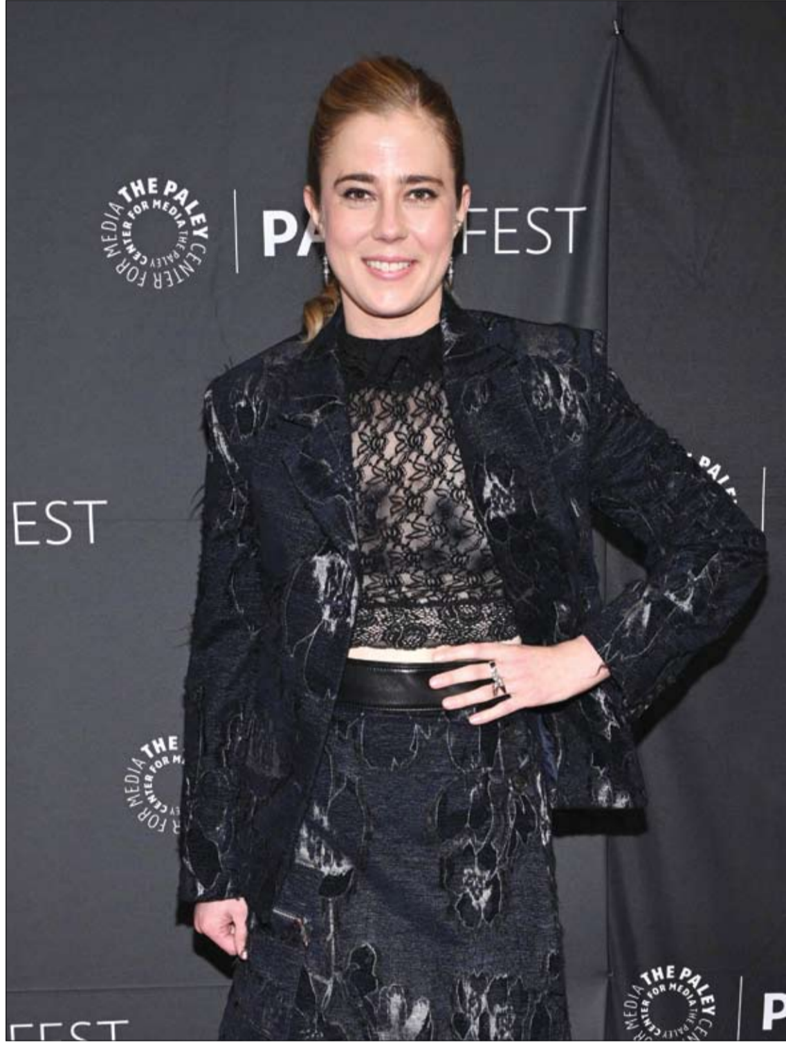
الممثلة الأمريكية تايلور ديردن لدى حضورها عرض فيلم «ذا بيت»، من إنتاج HBO في مهرجان بالي فست لوس أنجلوس.