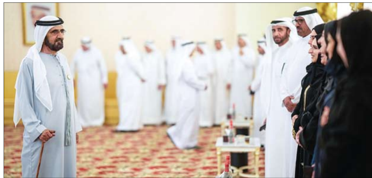
بقوله: مسيرتنا تتقدم بخطى سريعة في شتى مجالات التنمية،

وقال سموه: مضافة الجهود ضرورية لإعداد صفوف جديدة