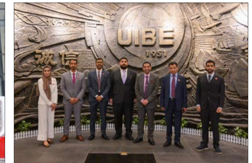
اختتمت المحطة الصينية من جولته البحثية العالمية