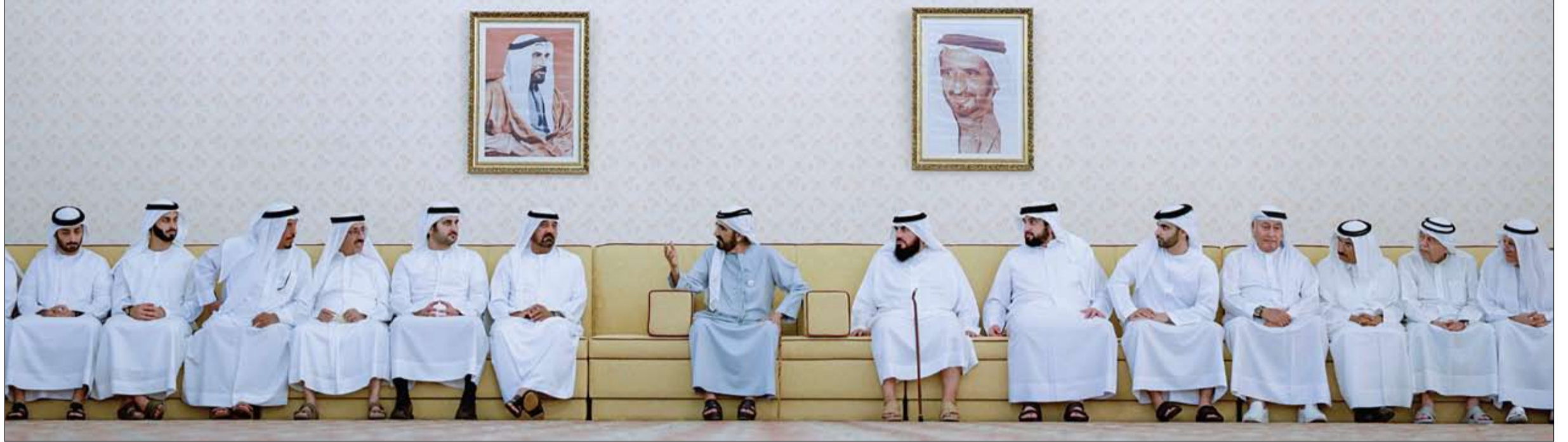
التقى أعيان البلاد ورجال الأعمال والمستثمرين