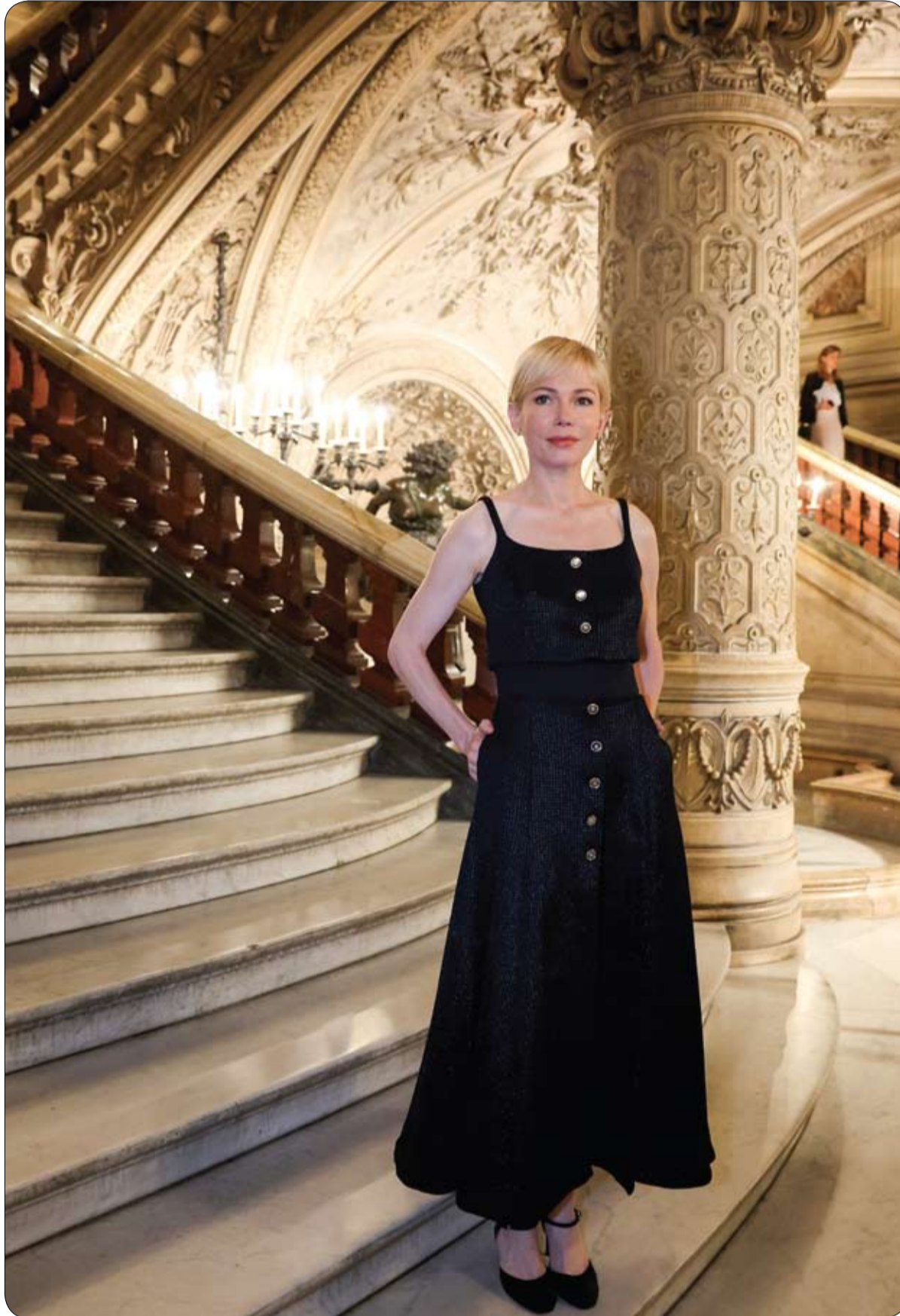
المنثلة الأمريكية ميشيل ويليامز لدى وصولها قبل عرض أزياء شاتيل للأزياء لخريف وشتاء 2024 ضمن أسبوع الموضة في باريس. (أ ف ب)

وإثر ذلك، تم نقل الزوجين إلى المستشفى، حيث تمكن الأطباء من إنقاذ حياة الزوجة، إلا أن الزوج كان قد فارق الحياة.