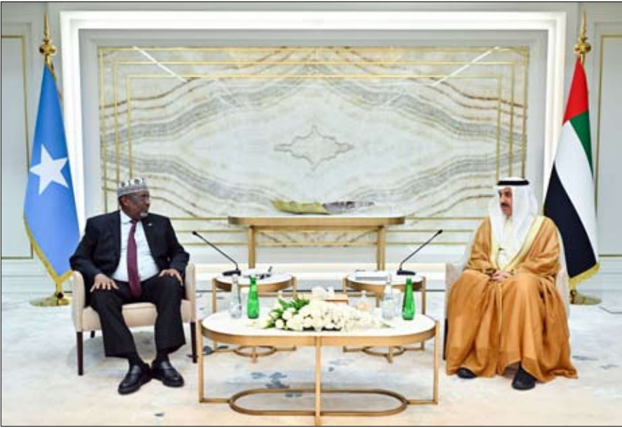
المتبادلة في تعزيز علاقات التعاون التاريخية القائمة بين بلادها ودولة الإمارات، مشيراً إلى الدعم الذي تقدمه الإمارات في مختلف القطاعات وفي المجال الإنساني على وجه الخصوص.

بداية اللقاء بمعالي رئيس مجلس الشعب بجمهورية الصومال والوفد المرافق له، مؤكداً أن هذه الزيارة الأخوية تشكل دعفاً قوياً لتطور وتعزيز العلاقات نحو آفاق أوسع بما يخدم المصالح المتبادلة للبلدين، وبما يجسد العلاقات التاريخية التي تربطهما وتشهد تطوراً مستمراً ورغبة في تطوير العلاقات اليبينية بينهما. وأشار إلى العلاقات التاريخية والأخوية التي تربط دولة الإمارات وجمهورية الصومال الفيدرالية الشقيقة، قيادة وشعباً، والتي تشهد تطوراً مستمراً ورغبة صادقة في تطوير العلاقات اليبينية