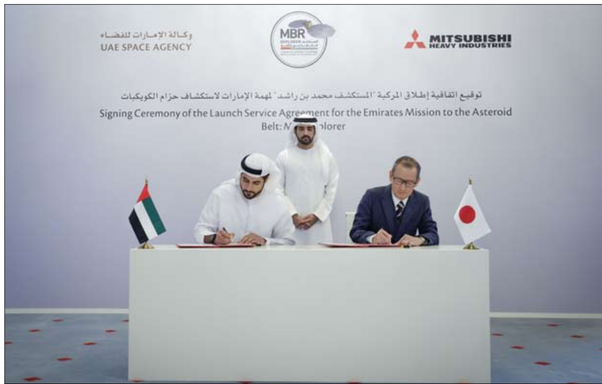
توقيع اتفاقية إطلاق المركبة "المستكشف محمد بن راشد" لاهمة الإمارات لاستكشاف حزام الكويكبات Signing Ceremony of the Launch Service Agreement for the Emirates Mission to the Asteroid Belt: Explorer