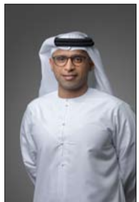
الإنسانية والاجتماعية، وبناء مجتمع متماسك ومتربط.

أعلنت دائرة تنمية المجتمع في أبوظبي، الجهة المنظمة لقطاع الاجتماعي في الإمارة، عن إصدار 8 تراخيص جديدة لمؤسسات النفع العام خلال العام الجاري، ليصبح العدد الإجمالي 99 مؤسسة نفع عام مرخصة في الإمارة حتى نهاية العام الجاري، ويأتي إصدار التراخيص بهدف