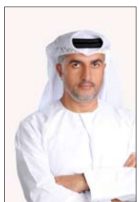
تعزيز وتنظيم الأعمال المرشحة التي اجتازت عملية الفرز واستوفت المعايير المطلوبة لكل مجال من المجالات المطروحة وتنتهي عملية التحكيم في 24 مارس المقبل، وبعدها تعلن نتائج الدورة الحالية في إبريل المقبل.

أعلنت الأمانة العامة لجائزة خليفة التربوية عن انتهاء قبول طلبات المرشحين للدورة الثامنة عشرة 2024-2025 وذلك على كافة المستويات المحلية والإقليمية والدولية للمجالات المطروحة في جائزة خليفة التربوية وعددها 10 مجالات موزعة على 17 فئة يتم التنافس فيها على المستويات المحلية والعربية والعالمية