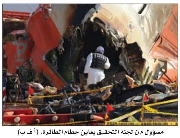
مسؤول من لجنة التحقيق يعاين حطام الطائرة.

•• عواصم-وكالات: بدأت القوات الأمريكية تحركات جديدة في شمال وشرق سوريا لتعزيز وجودها العسكري، حيث استقدمت وتلا يضم حوالي 50 شاحنة محملة بكتل إسمنتية، شوهدت على طريق الحسكة-الرقبة، متجهة نحو منطقة عين العرب (كوباني) في ريف حلب الشرقي. رافق الرتل سيارات عسكرية تابعة لقوات سوريا الديمقراطية (قسد)، في خطوة وصفها مراقبون بأنها تأتي في إطار تحصين القواعد الأمريكية الحالية وإنشاء قاعدة عسكرية جديدة في كوباني. تأتي هذه التحركات في ظل تصاعد التوترات الأمنية والعسكرية في شمال سوريا، مع استمرار التهديدات من قبل الفصائل الموالية لتركيا بشأن عملية عسكرية تستهدف مدينة كوباني عين العرب. وكشفت مصادر في وزارة الدفاع التركية إجراء محادثات مع نظرائهم في سوريا حول إقامة علاقات استراتيجية وتأسيس تعاون في مجالات متعددة بعد تفعيل الأجهزة الحكومية في دمشق. وأضافت المصادر أنه سيتم تقديم الدعم اللازم بناءً على خارطة الطريق التي ستعد وفقاً للاحتياجات المحددة عقب هذه المحادثات، وفق ما نقلته قناة العربية. ميدانياً، أفادت وسائل إعلام سورية، أمس الخميس، بسقوط قتلى وجرحى في اشتباكات عشائرية شمالي درعا في جنوب البلاد. وذكر تلفزيون سوريا أن اشتباكات بالأسلحة الرشاشة اندلعت بين مسلحين من عشائر البدو في منطقة الصافيا قرب مدينة إزرع شمالي درعا، مشيراً إلى أن الاشتباكات