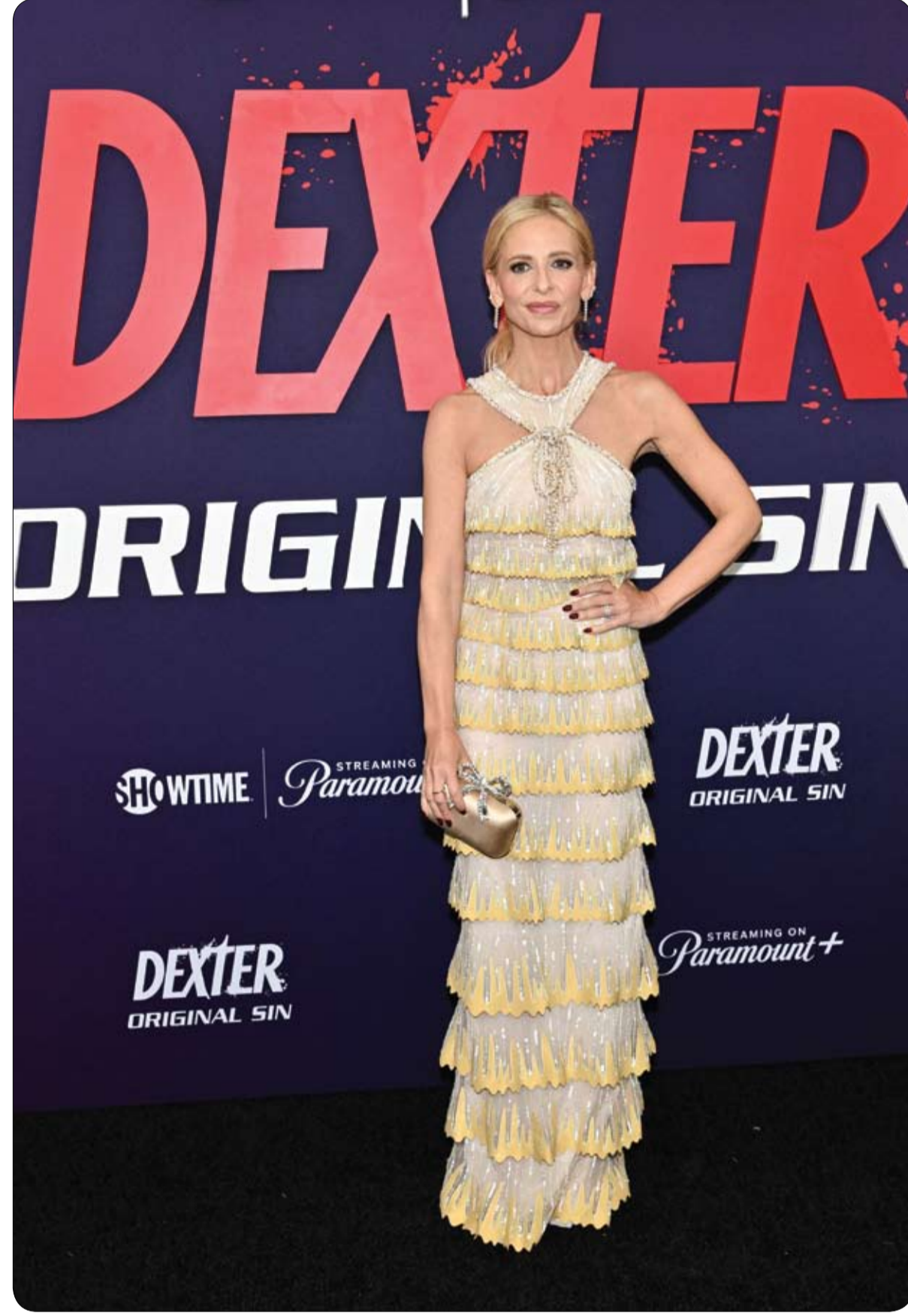
الممثلة الأمريكية سارة ميشيل جيلر لدى حضورها العرض الأول لفيلم Dexter, Original Sin في نيويورك.

في حالة نادرة استقبل زوجان أمريكيان، مجموعتين من التوائم، جعلت الأم تضحك وتبكي في الوقت نفسه، بينما كاد يغشى على الزوج. ووفق موقع "People" أنجبت فرح لاري، من لويزيانا، في نوفمبر- تشرين الثاني الماضي، أربع بنات عن طريق عملية فيضرية وبعد حمل سليم دون علاجات الخصوبة وهو أمر نادر، وفق الموقع. أصيب الزوجان بالصدمة، بعدما كشف جهاز الموجات فوق الصوتية أن فراه حامل بأربع فتيات، وكان الأمر الأكثر ندرة أن الأربع عبارة عن مجموعتين من التوائم المتطابقة.