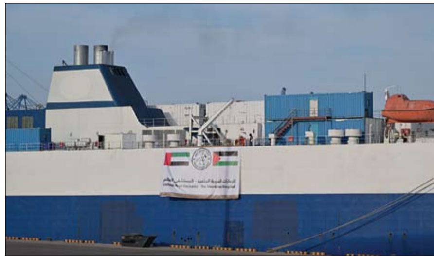
المستشفى العائم الإماراتي يبحر إلى سواحل العريش لتقديم الدعم الطبي للفلسطينيين (وام)

عواصم-وكالات: يعلم أن الطرح مرفوض لإسرائيل، ومع ذلك أودع وزير الخارجية الأمريكي، أنتوني بلينكن، بحث أهمية إقامة دولة للفلسطينيين، مع وزير الدفاع الإسرائيلي، يوفا غالات. وقال بلينكن مضيقه الفلسطينيين، باعتبار أن واشنطن، بدولة فلسطينية مستقلة، قبل نهاية 2024. كما يرى وزير الخارجية الأمريكي أنتوني بلينكن، أنه لا يزال هناك مكان لاتفاق في غزة، داعياً إلى حماية المدنيين، بينما تستعد إسرائيل للقيام بعمل عسكري في رفح، في تصريحات أتت رداً على رفض رئيس الوزراء الإسرائيلي بنيامين نتانياهو الشديد لدعوات حماس بوقف إطلاق النار. وقال بلينكن للصحافيين في تل أبيب بعد ساعات من لقائه نتانياهو، رغم أن هناك بعض الأمور غير القابلة للتطبيق بشكل واضح في رد حماس، إلا أننا نعتقد أن هذا يفسح مكاناً للتوصل إلى اتفاق، ونحن