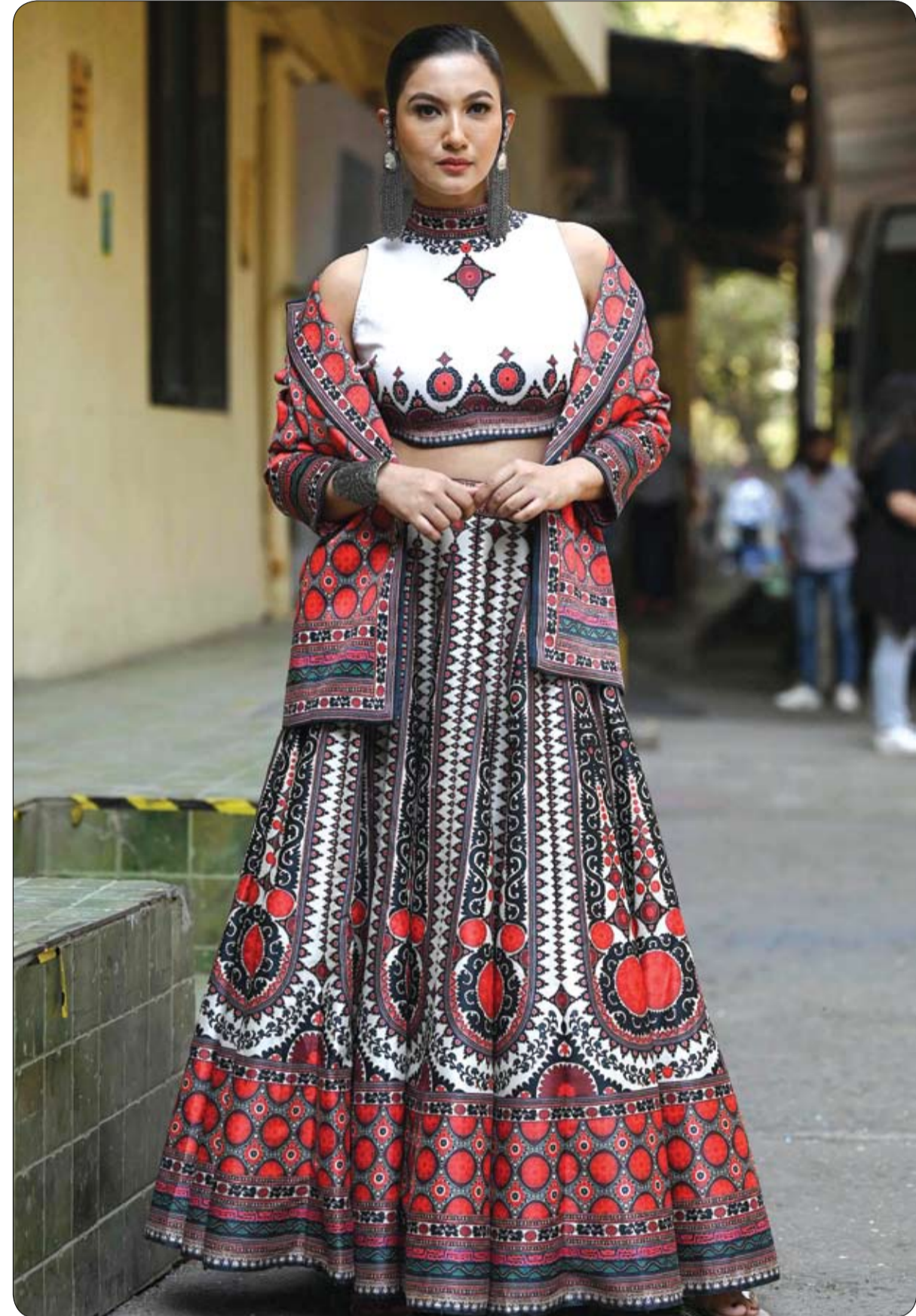
ممثلة بوليوود جوهر خان تطف لالتقاط الصور أثناء الترويج لبرنامج الرقص التلفزيوني الواقعي الهندي باللغة الهندية Jhalak Dikhhla Jaa في مومباي.

خلال أعوام عمرها التسعة، اضطرت الطفلة للخضوع لأكثر من 20 عملية جراحية شاقة، تم خلالها تركيب العديد من العين الاصطناعية.