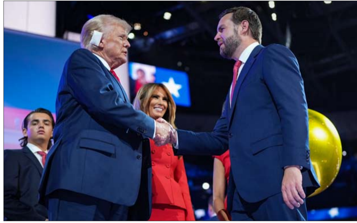
غادر دونالد المؤتمر في ميلووكي أقوى

بالنسبة للاقتصاد الأمريكي، تميز آراء فانس بين ثقافة الميم بالنسبة إلى أولئك الذين، مثل رأس المال الاستثماري وبعض السياسات اليسارية التي من شأنها إثارة بيرني ساندرز، فهو يريد من الدولة أن تحمي العمال من المنافسة وأن ترفع الحد الأدنى للأجور إلى 20 دولاراً في الساعة. يعتقد أنه يجب تفكيك شركات التكنولوجيا الكبرى.