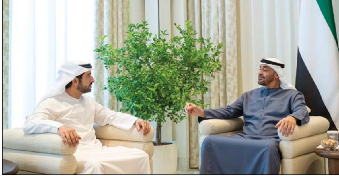
رئيس الدولة خلال استقباله حمدان بن محمد بن راشد

بعد انقطاع تكنولوجيا المعلومات الشامل لـ (مايكروسوفت) اضطراب تقني هائل يشل مرافق حيوية حول العالم •• عواصم-وكالات: بعد تأكيد شركة مايكروسوفت أن السبب الأساسي لانقطاع تكنولوجيا المعلومات الشامل قد تم إصلاحه لتطبيقاتها تقريبا، تبين سبب العطل. فقد أعلنت شركة «كراود سترايك» للأمن السيبراني، الجمعة، أن المشكلة التي تسببت في اضطرابات كبيرة حول العالم، وأدت إلى تعطيل الخدمات ليست حادثاً أمنياً أو هجوماً إلكترونياً. وقال الرئيس التنفيذي لشركة كراود سترايك، جورج كورتز، إن الشركة تعمل مع العملاء المتأثرين بالخلل الذي تم اكتشافه في تحديث محتوى واحد استخدمته أنظمة ويندوز، فيما لم تتأثر أنظمة ماك ولينكس. أتى ذلك بعدما تعرضت العديد من الخدمات بمختلف أنحاء العالم، في وقت سابق الجمعة، إلى انقطاع مفاجئ للإنترنت مرتبط بخلل تقني، مما تسبب في تعطيل العمليات في مطارات وشركات طيران ووسائل إعلام وبنوك. ولاحقاً أعلنت شركة مايكروسوفت أنه تم إصلاح الخلل التقني. يذكر أن شركة كراود سترايك تقدم خدمات وحلول أمن متقدمة لحماية الأنظمة والشبكات من التهديدات السيبرانية، باستخدام تقنيات الذكاء الاصطناعي والتعلم الآلي لتحليل البيانات واكتشاف الهجمات المحتملة في الوقت الفعلي، حسب الصياد. في حين أدى الانقطاع التكنولوجي العالمي إلى توقف رحلات جوية، وتوقف بنوك من العمل، وتوقف وسائل إعلام عن البث يوم الجمعة في اضطراب هائل أثر على الشركات والخدمات في جميع أنحاء العالم وسلط الضوء على الاعتماد على برامج عدد قليل من مقدمي الخدمات.