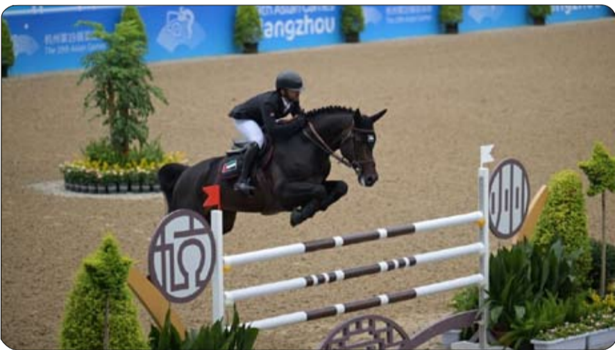
الحفل الأولي الكبيرة، وتنمتى ولخيولهم كامل الجاهزية خلال لهم ولجهازهم الفني التوفيق المناهضات.

اعتمد سمو الشيخ منصور بن زايد آل نهيان، نائب رئيس الدولة، نائب رئيس مجلس الوزراء، رئيس ديوان الرئاسة، رئيس هيئة الإمارات لسباق الخيل، البرنامج الرسمي لسباقات الخيل في الدولة للموسم 2024 - 2025، الذي يُتوقع أن يكون الأكثر تميزًا في تاريخ سباقات الخيل بالدولة. وقال سموه : نطلق اليوم برنامج سباقات استثنائي لموسم 2024 - 2025، يمثل نقلة نوعية في عالم سباقات الخيل، ويرسخ موقع الإمارات كوجهة عالمية رائدة لهذه الرياضة