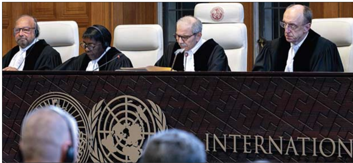
القاضي ورئيس محكمة العدل الدولية نواف سلام يصدر حكماً غير ملزم بعدم قانونية الاحتلال الإسرائيلي للأراضي الفلسطينية (ا ف ب)

•• لاهي-وكالات: أكدت محكمة العدل الدولية أعلى هيئة قضائية تابعة للأمم المتحدة أمس أن الاحتلال الإسرائيلي المستمر منذ عقود للأراضي الفلسطينية غير قانوني ويجب أن ينتهي في أسرع وقت ممكن. وطالبت محكمة العدل الدولية كافة الدول للتعاون مع الأمم المتحدة لإنهاء الاحتلال الإسرائيلي للأراضي الفلسطينية. وقال القاضي نواف سلام الذي يرأس محكمة العدل الدولية: لقد خلصت المحكمة إلى أن الوجود الإسرائيلي المستمر في الأراضي الفلسطينية منذ 1967 غير قانوني، ويجب على إسرائيل إنهاء الاحتلال في أسرع وقت ممكن.. وأضاف أن دولة إسرائيل ملزمة بإنهاء وجودها غير القانوني في الأراضي الفلسطينية المحتلة في أسرع وقت ممكن. وأضاف أن دولة إسرائيل ملزمة