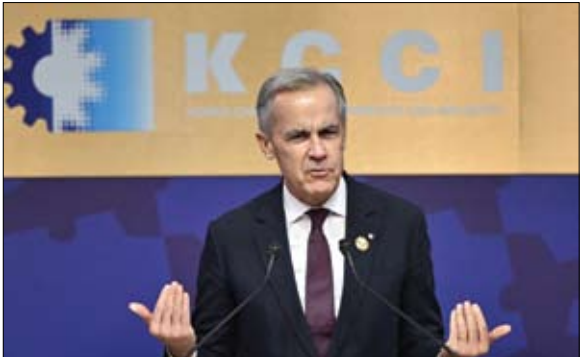
رئيس الوزراء الكندي يلقى كلمة خلال منتدى (APEC) في كوريا.

ترامب: أمريكا وكندا لن تستأنفا المحادثات التجارية كارني: انتهى عصر التجارة الحرة القائمة على القواعد