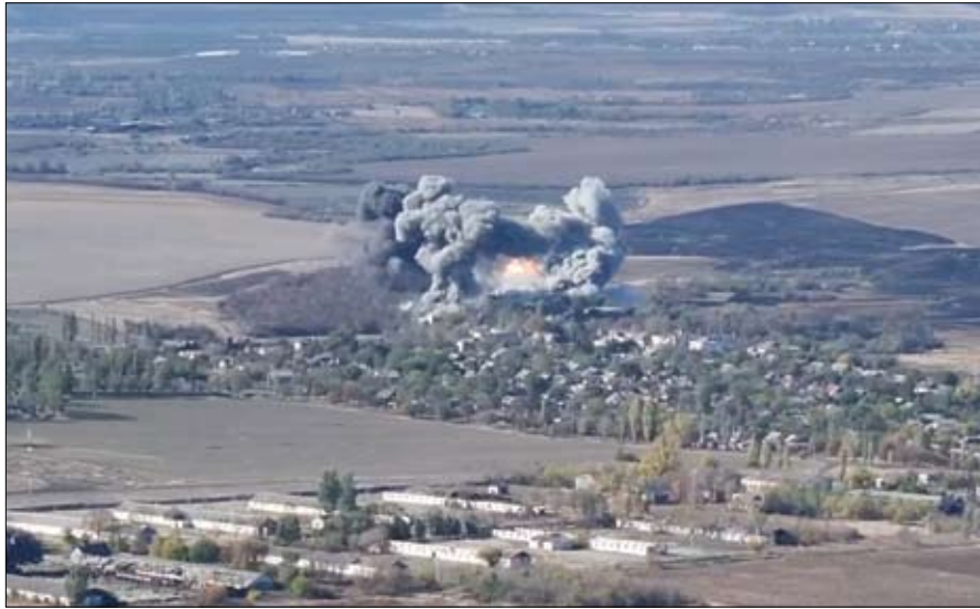
منظر لانضجار، حيث سيطرت القوات الروسية على قرية فيشنيف، منطقة دنيبروبيتروفسك، أوكرانيا.

وأفادت دتيك (DTEK)، أكبر شركة طاقة أوكرانية خاصة، بأن محطات الطاقة الحرارية تضررت بشدة في مناطق عدة، ما أدى لاستمرار انقطاع الكهرباء لمدة طويلة. وقال وزير الخارجية الأوكراني أندريه سيبيها، إن روسيا هاجمت بلاده في الشهور القليلة الماضية بصاروخ كروز، الذي دفع تطويره سرا الرئيس الأميركي دونالد ترامب إلى الانسحاب من معاهدة مع موسكو للحد من الأسلحة النووية خلال ولايته الرئاسية الأولى. وتعد تصريحات الوزير أول تأكيد على أن روسيا استخدمت الصاروخ 729م الذي يطلق من الأرض في القتال بأوكرانيا أو في أي مكان آخر.