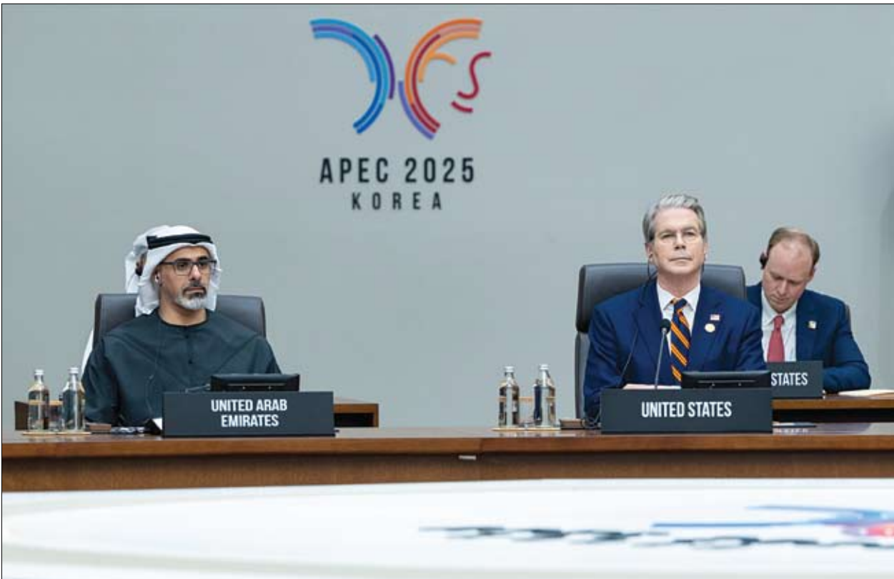
ولي عهد أبوظبي خلال ترؤسه وفد الدولة المشارك في أعمال منتدى التعاون الاقتصادي لدول آسيا والمحيط الهادئ