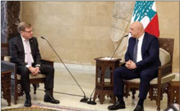
الرئيس اللبناني خلال لقائه وزير الخارجية الألماني في بيروت

أعلن مدير مكتب التحقيقات الفدرالي الأمريكي (إف بي أي) كاش باتيل الجمعة إحباط هجوم إرهابي محتمل كان من المخطط تنفيذه في ولاية ميشيغن في شمال البلاد خلال عيد الهالوين. وقال باتيل في منشور على إكس هذا الصباح أحبط مكتب التحقيقات الفدرالي هجوما إرهابيا محتملا وأوقف العديد من الأشخاص في ميشيغن كانوا يخططون لهجوم عنيف خلال الهالوين في عطلة نهاية الأسبوع. وأضاف أنه سيتم الكشف عن مزيد من التفاصيل حول المخطط في وقت لاحق. من جهتها، قالت إدارة الشرطة في ديترويت الواقعة غرب ديترويت، إن (إف بي أي) أجرى عمليات في المدينة في وقت مبكر الجمعة. وأضافت على فيسبوك فريد أن نطمئن سكاننا بأنه لا يوجد أي تهديد للمجتمع في الوقت الحالي.