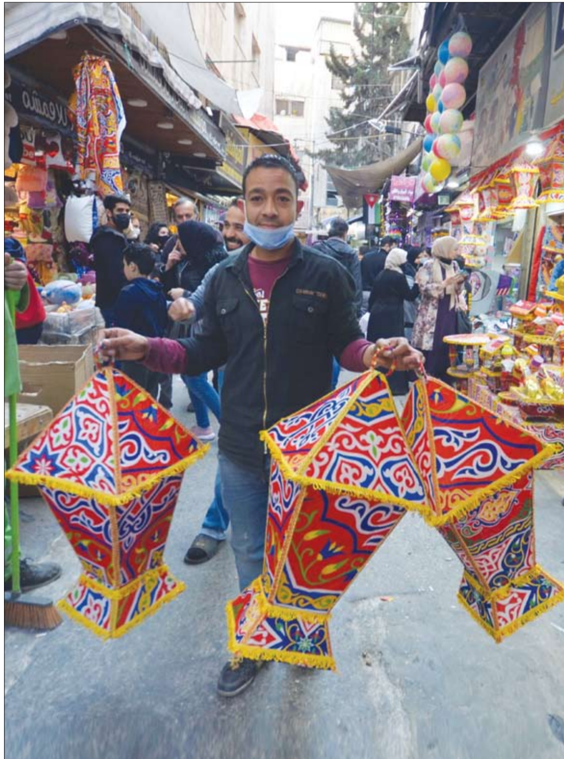
بائع يحمل زينة رمضان وسط جائحة فيروس كورونا، في عمان، الأردن.

وتجدر الإشارة، إلى أن استخدام هذه الطريقة (العلاج الكيميائي الموضعي) يمكن أن ينقذ حياة آلاف المرضى الذين يعانون من أورام في الدماغ غير قابلة للجراحة.