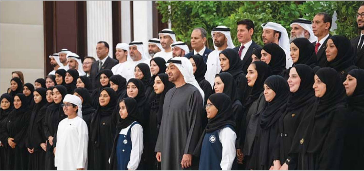
استقبل عددا من المعلمين والإداريين والطلاب المتميزين بمناسبة شهر رمضان المبارك