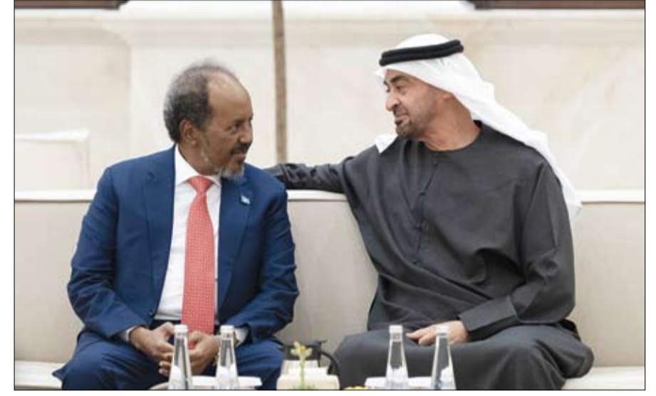
رئيس الدولة خلال استقباله الرئيس الصومالي

المجال التعليمي، مؤكدا أن التعليم الذي يتمحور حول الإنسان والارتقاء بقدراته ومهاراته يمثل أولوية رئيسة للدولة لأنه طريقها نحو المستقبل الأفضل الذي تطمح إليه وتعمل من أجله. الدولة بمناسبة شهر رمضان المبارك. وهنا صاحب السمو رئيس الدولة، خلال اللقاء الذي جرى في قصر البطين في أبوظبي، المعلمين والإداريين والطلاب المتميزين بالشهر الفضيل، داعيا الله تعالى أن يعيده عليهم وعلى أسرهم بالخير والسعادة، وشكرهم لجهودهم المتميزة في استقبل صاحب السمو الشيخ محمد بن زايد آل نهيان رئيس الدولة - حفظه الله، أمس، عددا من المعلمين والإداريين والطلاب المتميزين من مختلف مدارس أبوظبي - وام: