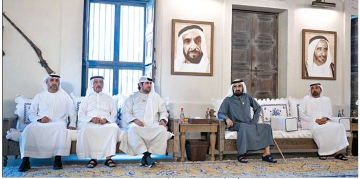
محمد بن راشد خلال لقائه جمعاً من أعيان البلاد ورجال الأعمال والمستثمرين، والوزراء وكبار المسؤولين

الإمارات تعرب عن قلقها البالغ إزاء خطر المجاعة في السودان وترحب باجتماع مجلس الأمن •• أبو ظبي - وام: تعرب دولة الإمارات عن قلقها البالغ إزاء الأزمة الإنسانية المتفاقمة في السودان وانعدام الأمن الغذائي الشديد الذي يؤثر على أكثر من 25 مليون مواطن سوداني. كما تعرب عن قلقها الشديد عقب إعلان المجاعة في أجزاء من شمال دارفور، وخاصة في مخيم زمزم الذي يأوي أكثر من نصف مليون نازح، واحتمال حدوث مجاعة في مخيمي أبو شوك والسلام، والولايات السودانية التسع الأخرى التي يعيش سكانها في ظل مستويات جوع كارثية. وفي هذا الصدد، ترحب دولة الإمارات بالاجتماع الذي عقده مجلس الأمن أمس والذي ركز على الضرورة الملحة لمواجهة حالة المجاعة في السودان. (التفاصيل ص2) المستشفى الإماراتي الميداني يرفع ياطع وفداً من منظمة الصحة العالمية على جهوده لدعم القطاع الصحي بفترة •• رفح - وام: قام وفد من منظمة الصحة العالمية بزيارة للمستشفى الميداني الإماراتي برفح خلالها على الجهود الطبية والبيات التنسيق والتعاون وتبادل الخبرات المختلفة والاستفادة من الجهود المتواصلة في المجال الطبي الذي تقدمه الإمارات لدعم القطاع الصحي في غزة ضمن عملية الفارس الشهر 3. وأشاد وفد منظمة الصحة العالمية بدور دولة الإمارات العربية المتحدة الإنسانية البارز والمميز من خلال عملية الفارس الشهر 3. في المجال الطبي والعمل المتواصل في توفير الرعاية الصحية للجرحى والمصابين جراء الوضع الصعب في قطاع غزة ودور الكوادر الطبية الإماراتية في المستشفى لرفع المعاناة عن أهالي غزة. (التفاصيل ص3)