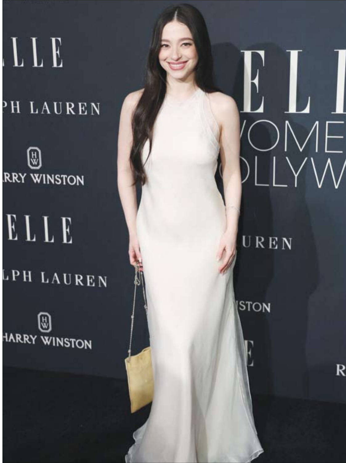
الممثلة الأمريكية مايكي ماديسون لدى حضورها حفل مجلة Elle Women in Hollywood 2024 في لوس أنجلوس.

يذكر أن هذه دراسة رصدية، لذا لا يمكنها تحديد السبب، ويقر الباحثون بأن الأزواج الذين لا يحاولون الحمل ربما تم تضمينهم في التحليل، مع غياب المعلومات حول عوامل نمط الحياة والتعرض للضوضاء وتلوث الهواء في العمل وأثناء الأنشطة الترفيهية. نُشرت الدراسة في مجلة BMJ The.