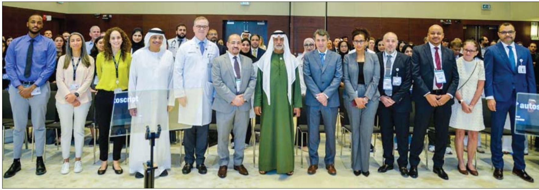
بحضور 1000 مشارك من المجتمعات المحلية والإقليمية والعالمية