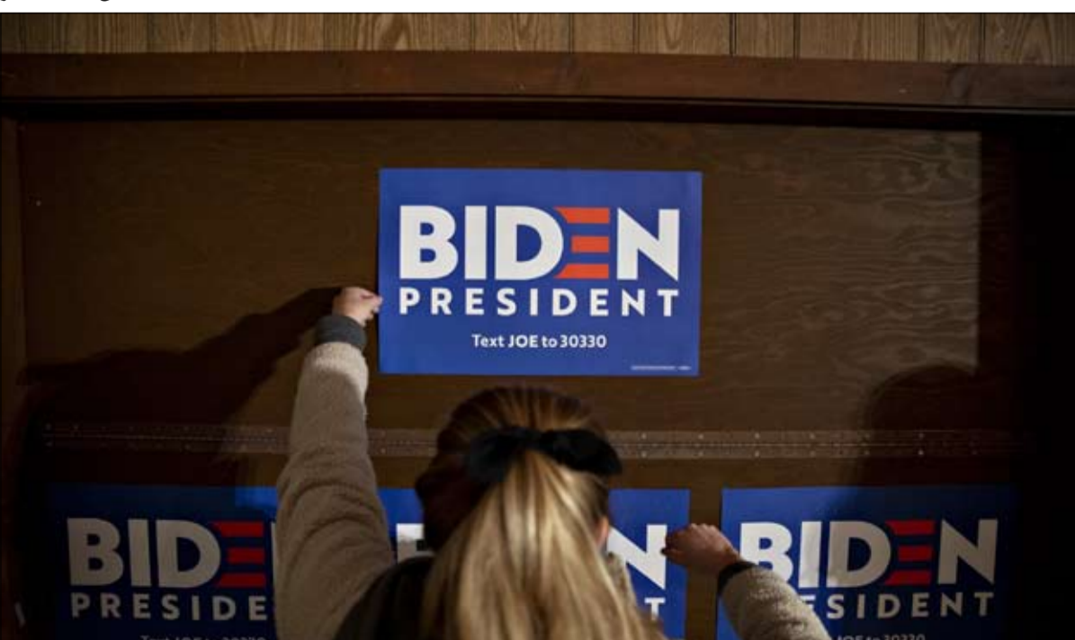
مي تو... الحرج