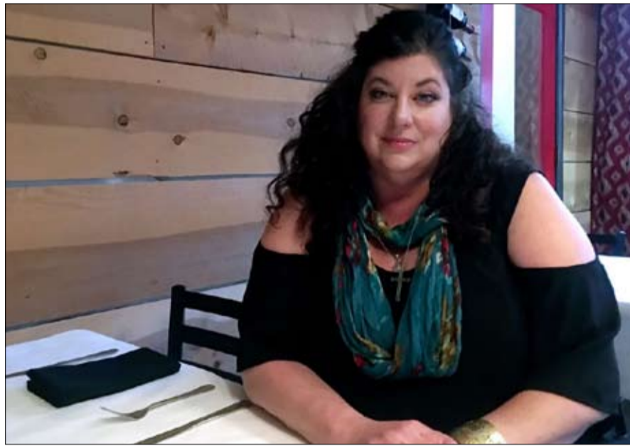
تارا ريد تتهم

المشكلة أن هذه المقاربة المعتدلة لم تكن هي القاعدة قبل تارا ريد