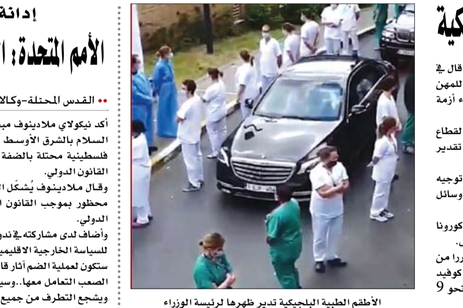
الاطمق الطبية البلجيكية تدير ظهرها لرئيسة الوزراء