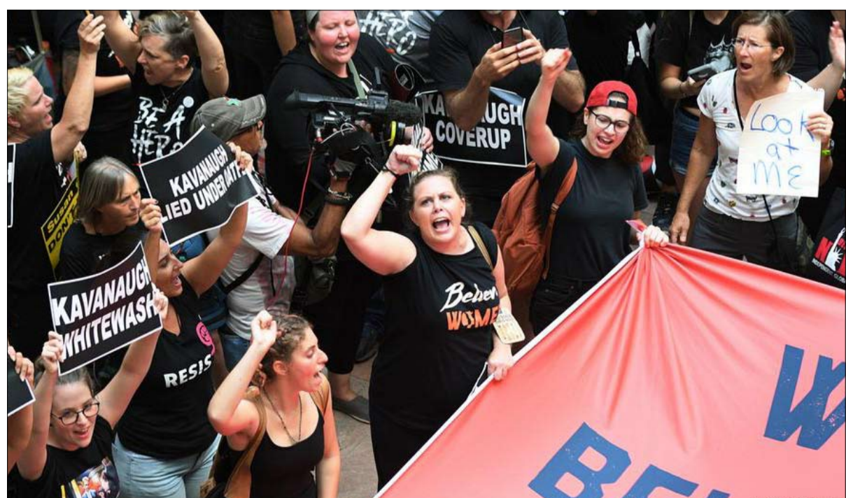
مسيرة نسوية ضد التحرش