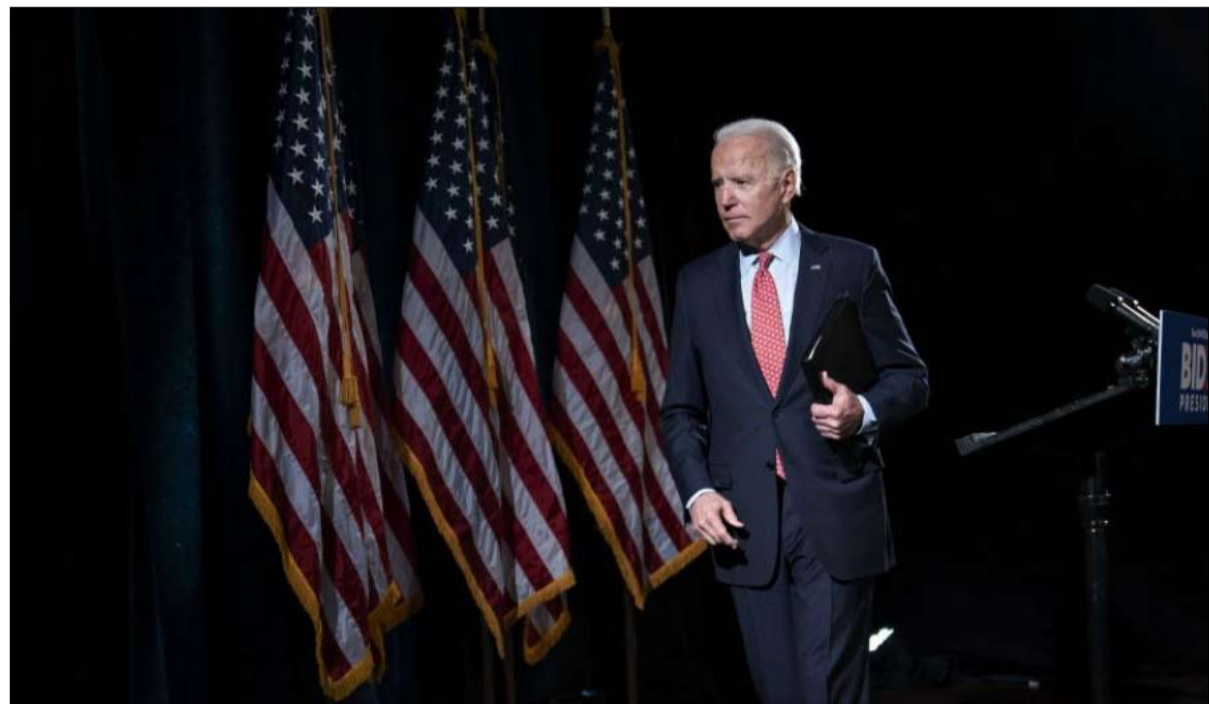
بايدن ارباك غير منتظر