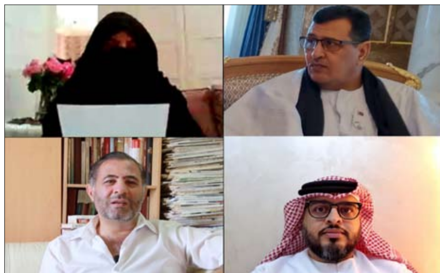
مسجل للشيش زايد - طيب الله ثراه - يدعو فيه للصبر والبذل والعطاء والتضحية والجدد والوقفة. وإجلاء رعايا عدد من الدول الشقيقة والصديقة. وبجهد الختام استعاد المشاركون في المجلس الرضائي الافتراضي فيديو