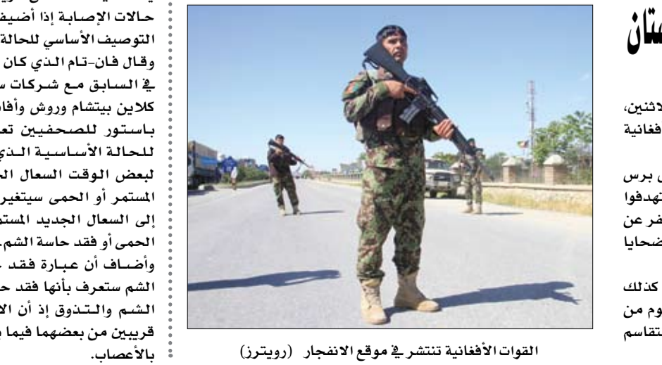
القوات الأفغانية تنتشر في موقع الانفجار

واشنطن - وكالات: في رد فعل متوقع، شن الرئيس الأمريكي دونالد ترمب هجوما حادا على الرئيس السابق باراك أوباما وصفه بأنه غير كفء، كما أنه موجود اليوم في البيت الأبيض بسبب فساد إدارته وناثبه جو بايدن. وصف الرئيس ترمب الرئيس السابق أوباما بأنه «غير كفء للغاية، عندما سئل الأحد، عن الانتقادات التي وجهها سلفه الديمقراطي في اليوم السابق. وقال ترمب للصحافيين، الأحد، خارج البيت الأبيض: «انظر، لقد كان رئيسا غير كفء. هذا كل ما يمكنني قوله. غير كفء إلى حد كبير». وأضاف أنه لم ير تصريحات أوباما، كما أنه لن يتوسع في تعليقاته حول الرئيس السابق. وواصل الرئيس الأمريكي ترمب هجومه على أوباما هذه المرة على تويتر، حيث قال: «تحول إدارة أوباما إلى واحدة من أكثر الحكومات فسادا في تاريخ الولايات المتحدة. تذكروا، هو والثناص جو بايدن هما السبب في وجودي في البيت الأبيض». وكان الرئيس الديمقراطي السابق أوباما قد كسر كل الأعراف الرئاسية في أميركا وشن هجوما لاذعما على إدارة ترمب ووصفهم بأنهم غير أكفاء في ردهم على ويا كورون، وقال لقد كشفت الأزمة أنهم لا يعرفون شيئا، لقد كسرت الأزمة مقولة أن المسؤولين يعرفون ما يفعلون.