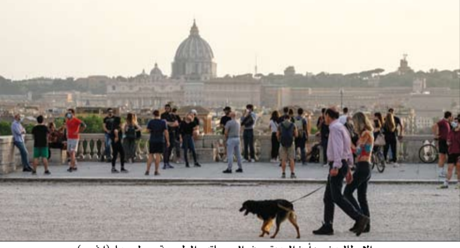
الاطالبيون يبدؤون العودة بحذر الى حياتهم الطبيعية وسط روما (ا ف ب)

دعم 116 دولة في جمعية الصحة العالمية، وهو ما يكفي لتقريره في اجتماع يعقد اليوم الثلاثاء. يأتي ذلك في وقت قالت وزارة الخارجية الصينية، أمس الاثنين، إن من السابق لأوانه الشروع في إجراء تحقيق بشأن أصول وانتشار فيروس كورونا الذي قتل أكثر من 300 ألف شخص في أنحاء العالم. وقال المتحدث باسم الوزارة تشاو ليجيان خلال إفادة صحافية يومية، وصالونات تصفيف الشعر ومتاجر البيع بالتجزئة. والمسابع ودور السينما والمسارح في 25 أيار مايو. غير أن السلطات حذرت من أن الفيروس يواصل انتشاره، داعية إلى التزام توجيهات التباعد الاجتماعي. إلى ذلك، حصل مشروع قرار دفع به الاتحاد الأوروبي والشركات والتاجر في البلاد، بما في ذلك المطاعم والحانات والمقاهي أظهرت بيانات معهد روبرت كوخ للأمراض المعدية، أمس الاثنين، أن ألمانيا سجلت 342 إصابة جديدة بفيروس كورونا ليصل إجمالي حالات الإصابة في البلاد إلى 174697. وزاد عدد الوفيات 21 حالة إلى 7935. يأتي ذلك فيما أعلنت روسيا أمس عن 8926 إصابة جديدة بفيروس كورونا خلال ال 24 ساعة الماضية، مما يرفع عدد الحالات هناك إلى 290678. وجاءت الزيادة اليومية في الحالات أقل من 10 آلاف لليوم الثالث على التوالي، وهو رقم تجاوزته الإصابات اليومية معظم شهر مايو. وقال مركز إدارة مكافحة فيروس كورونا في روسيا إن 91 توفوا ليرتفع عدد الوفيات إلى 2722. وفي إيطاليا، أعلن الدفاع المدني، أن فيروس كورونا المستجد تسبب في وفاة 145 شخصاً في خلال الساعات الأربع والعشرين الماضية، وهو أذى عدد يومي منذ بدء الحجر الصحي في 9 آذار مارس. وسُجِّد فتح معظم الشركات والمتاجر في البلاد، بما في ذلك المطاعم والحانات والمقاهي