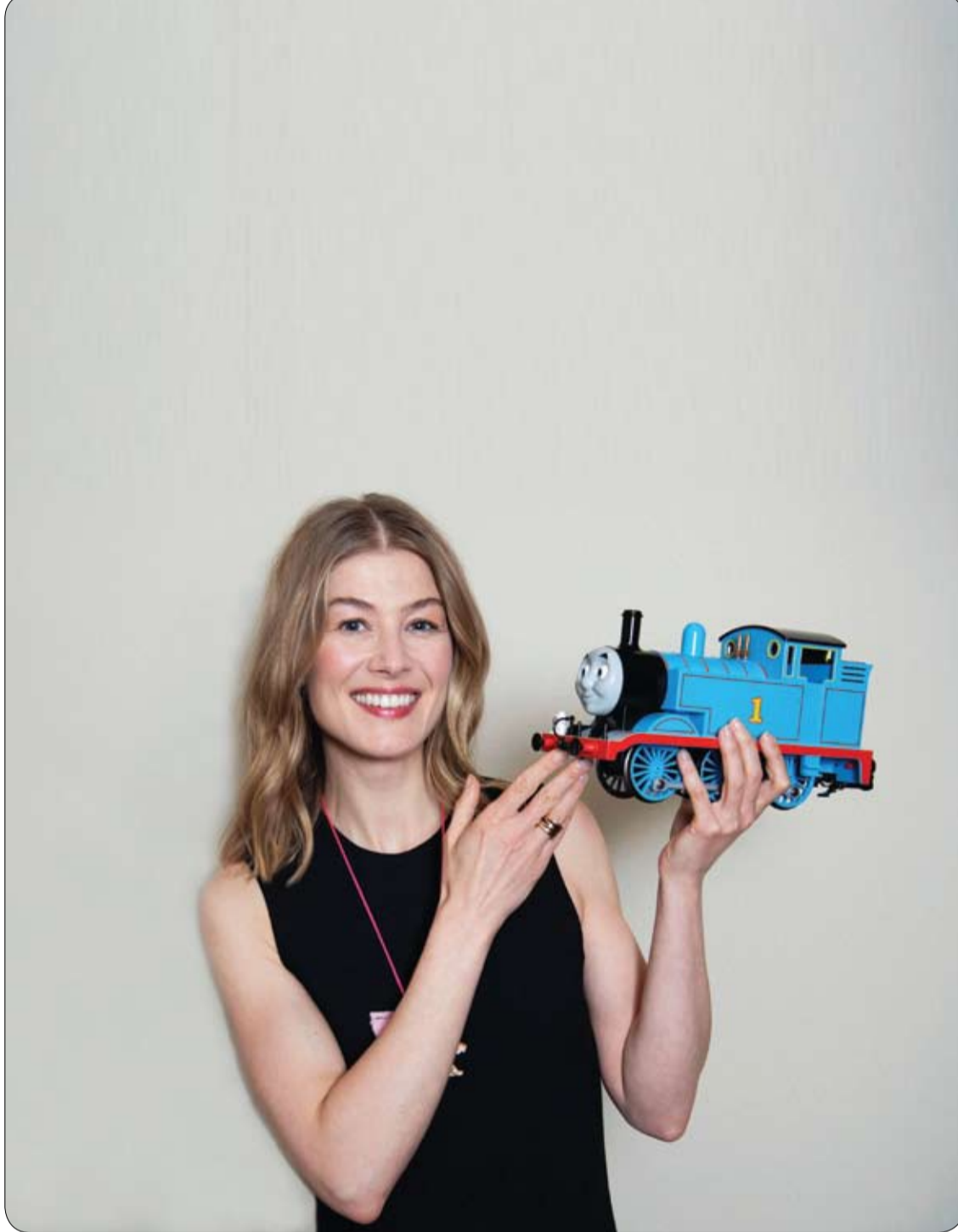
الممثلة البريطانية روزاموند بايك أثناء تسجيلها الصوتي في الاستوديو كخشية تسمى دوقة لوبورو في الرسوم المتحركة الخاصة بعرض توماس والأصدقاء: المحرك الملكي.

4. تستدعي بقع الحبر والألوان على رداء الطفل، نقعها في وعاء يحتوي على ماء فاتر، مع إضافة فنجان صغير من خل التفاح أو سائل الجلي إليه، والانتظار حتى تزول البقع. تنجح هذه الحيلة غالبًا مع بقع الحبر فور حدوثها. وبالإمكان أيضًا استخدام معجون الأسنان (أو معجون الحلاقة)، مع اسفنجة ناعمة لإزالة بقعة الحبر تحت ماء جار، بخاصة إذا كان رداء الطفل مصنوعًا من الحرير وال"شيفون". وإذا كانت البقعة "مستعصية"، يستخدم القليل من الخل الأبيض، والقليل من النشاء لصنع معجون، بغية التخلص منها. ومن الطرق أيضًا، وضع القليل من الملح الخشن على مكان البقعة، بدون لها أو نقعها، ثم إضافة بضع نقاط من الليمون الحامض، مع ضرورة وضع منشفة أو قطعة ورق تحت رداء الطفل، حتى لا تنتشر البقعة على مساحة أوسع، ثم فركها برفق حتى تزول بقعة الحبر، بصورة تدريجية، ووضعها في ما بعد في الغسالة على دورة غسيل مناسبة.