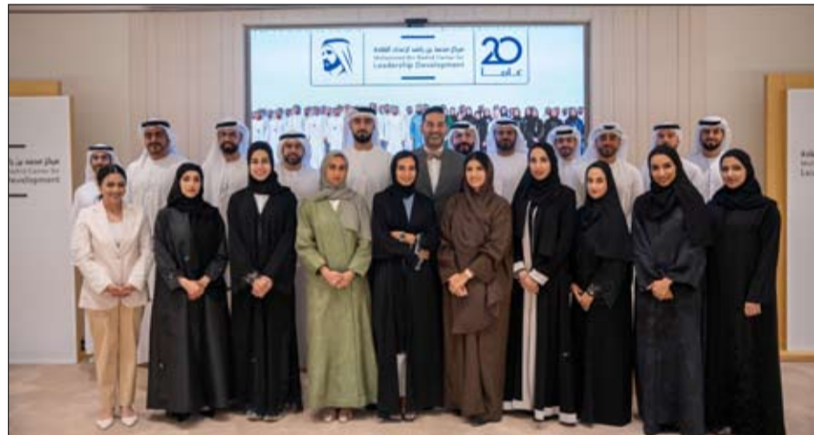
• محمد القرقاوي: البرنامج يجسد رؤية محمد بن راشد في الاستثمار بالكفاءات الوطنية وصقلها واستكمال إعداد أجيال من القادة القادرين على مواكبة متطلبات المستقبل

والقيادة الإبداعية المتقدمة اللازمة لاستشراف الاتجاهات المستقبلية، ودفع الابتكار، وتحقيق الأهداف الطموحة من خلال استراتيجيات قابلة للتطبيق تساهم في تعزيز نمو إمارة دبي ونجاحها المستدام.