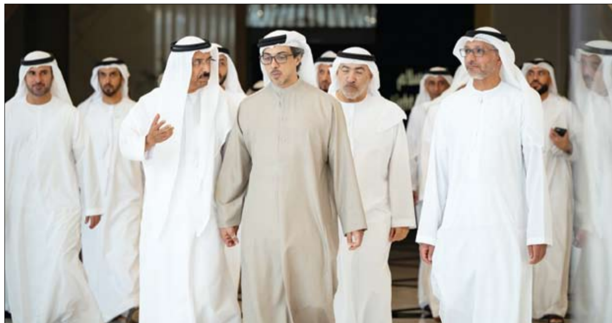
افتتح متحف (نور وسلام) في مركز جامع الشيخ زايد الكبير