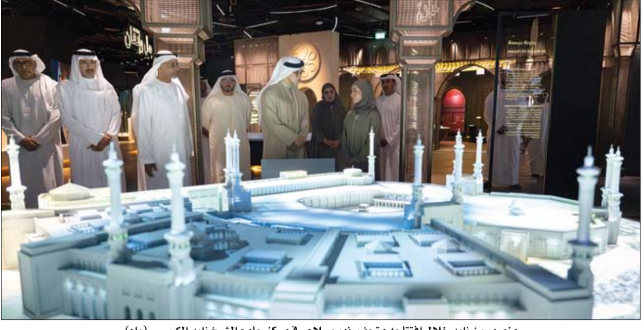
منصور بن زايد خلال افتتاحه متحف «نور وسلام» في مركز جامع الشيخ زايد الكبير

2 و3 ديسمبر إجازة الحكومة الاتحادية والقطاع الخاص بمناسبة عيد الاتحاد الـ 53 دبي - وام: أعلنت الهيئة الاتحادية للموارد البشرية الحكومية، أن عطلة عيد الاتحاد الـ 53 لدولة الإمارات العربية المتحدة، لموظفي الوزارات والجهات الاتحادية ستكون يومي الإثنين والثلاثاء الموافق 2 و3 ديسمبر 2024، على أن يستأنف الدوام الرسمي يوم الأربعاء الموافق الرابع من الشهر نفسه. جاء ذلك استناداً إلى قرار مجلس الوزراء بشأن أجندة العطلات الرسمية المعتمدة للقطاع الحكومي والخاص في الدولة لعام 2024، حسب تعميم صادر عن الهيئة، وموجه للوزارات والجهات الاتحادية كافة. ورفعت الهيئة، بهذه المناسبة، أسمى آيات التهنية إلى قيادة وحكومة وشعب دولة الإمارات العربية المتحدة، والمقيمين على أرضها، راجية الله تعالى أن يعيدها على الوطن بمزيد من الخير والنماء. من جهة أخرى أعلنت وزارة الموارد البشرية والتوطين، أن الثاني والثالث من شهر ديسمبر المقبل، عطلة رسمية مدفوعة الأجر لجميع العاملين في القطاع الخاص في دولة الإمارات بمناسبة عيد الاتحاد الـ 53. جاء ذلك في تعميم أصدرته الوزارة تنفيذاً لقرار مجلس الوزراء بشأن العطلات الرسمية المعتمدة للقطاع الحكومي والخاص لعام 2024. ورفعت وزارة الموارد البشرية والتوطين بهذه المناسبة أصدق التهاني والتبريكات إلى القيادة الرشيدة وشعب دولة الإمارات والمقيمين على أرضها.