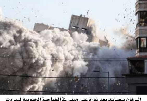
الدخان يتصاعد بعد غارة على مبنى في الضاحية الجنوبية لبيروت