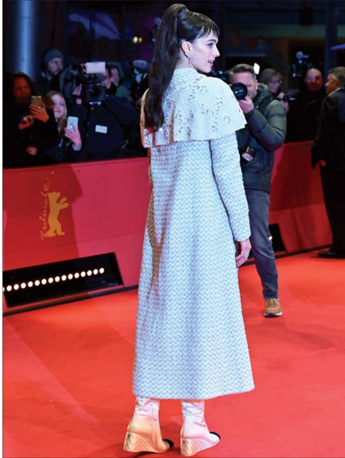
الممثلة الأمريكية مارغريت كوالي تتألق أمام الصوريين على السجادة الحمراء لفيلم "القمر الأزرق"، في المسابقة الرسمية لمهرجان برلين السينمائي.